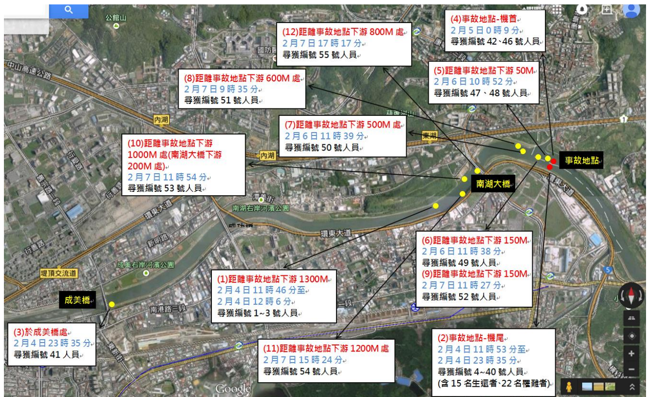
圖 2：復航 GE235 航班人員發現時間及位置斑點圖(截至 104 年 2 月 8 日 24 時止)。