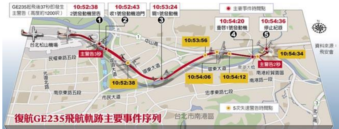
圖 1 復航 GE235 航班飛航軌跡圖。