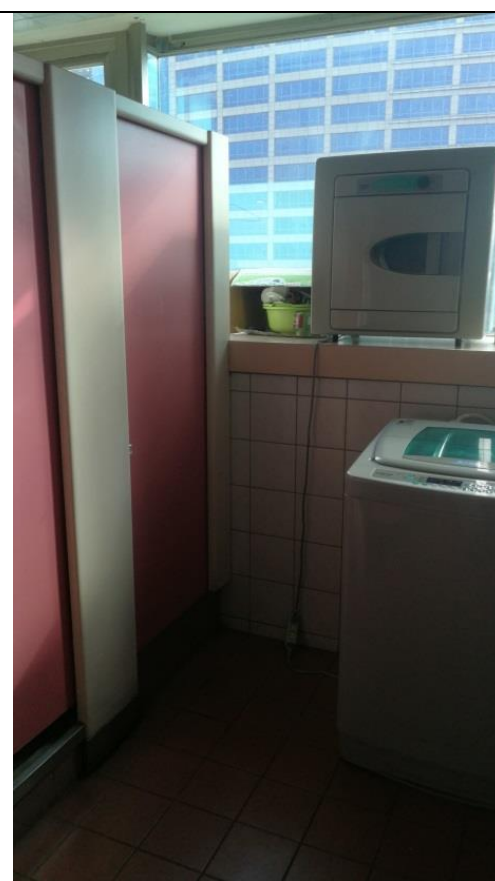
說明：設置女性專用洗衣機、烘衣機