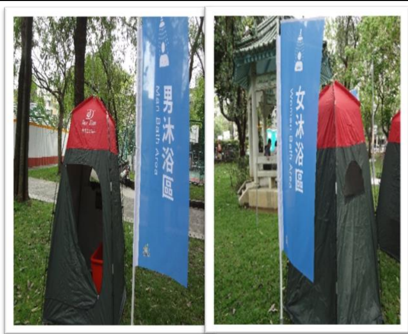
說明：沐浴區(男沐浴區、女沐浴區)