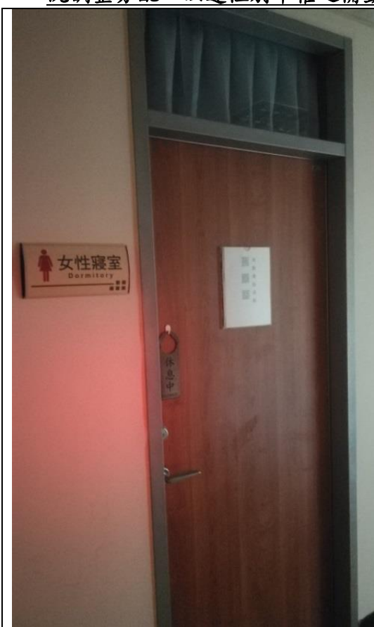
說明：設置女性專用寢室

本局 119 專線係由執勤人員 24 小時輪班，確保案件受理順遂，執勤人員備勤時應於本局待命，隨時支援突發狀況；本中心為提高女性執勤人員居住品質，將盥洗與居住空間依性別區劃專屬區域外，並規劃洗衣機、烘衣機及床位依性別人數比例視現況調整分配，以達性別平權之備勤環境。