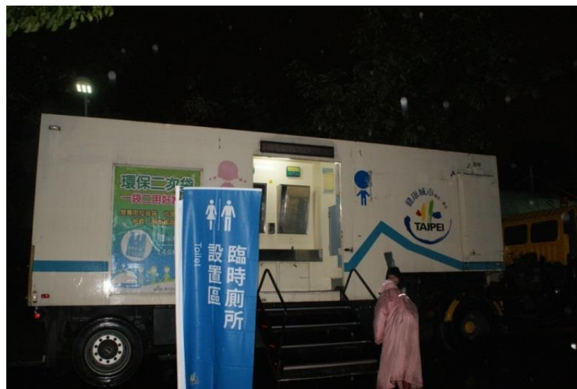
說明：防災公園-臨時廁所設置區