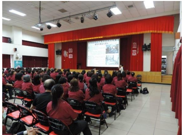
說明：義消訓練情形