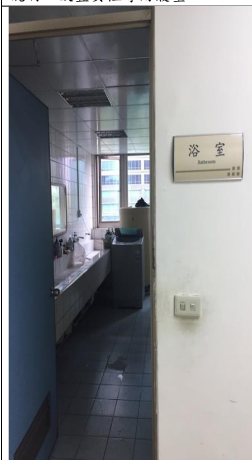
說明：備勤浴室，內置洗衣機