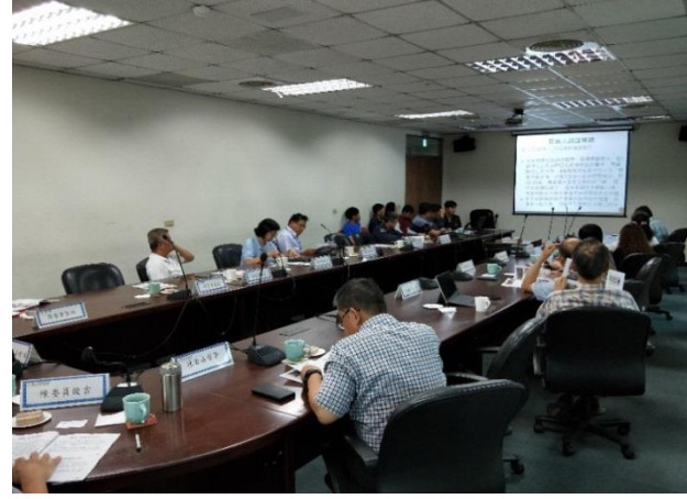
說明：107年6月15日召開第2次鑑委會會議