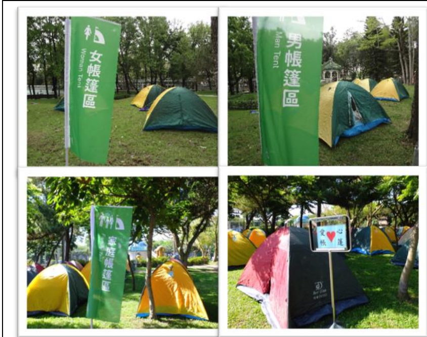
說明：防災公園-帳篷區(女帳篷區、男帳篷區、家庭帳篷區、愛心帳篷)

2、方案名稱： (整備應變科)臺北市107年災害防救演習之防災公園開設演練，規劃男女、家庭帳篷區、沐浴區、增設臨時廁所區，於國防大學政治作戰學院體育館辦理收容所開設演練，設有男女、家庭寢區、沐浴區。