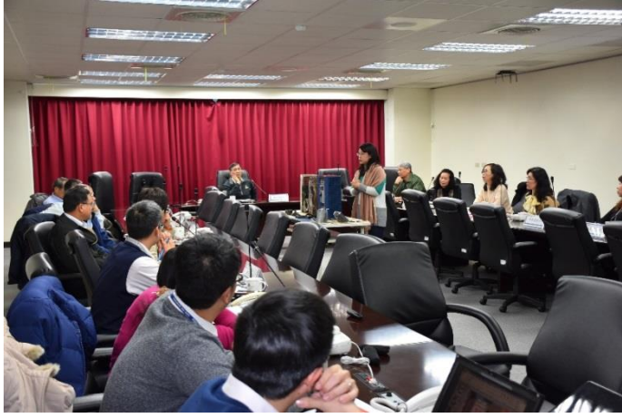
說明：107年1月11日召開第1次鑑委會會議

分別於107年1月11日、107年6月15日、107年7月5日及107年12月13日，共召開4次鑑委會會議，委員會均符合三分之一性別比例原則(委員總數17人，女性7人，男性10人)