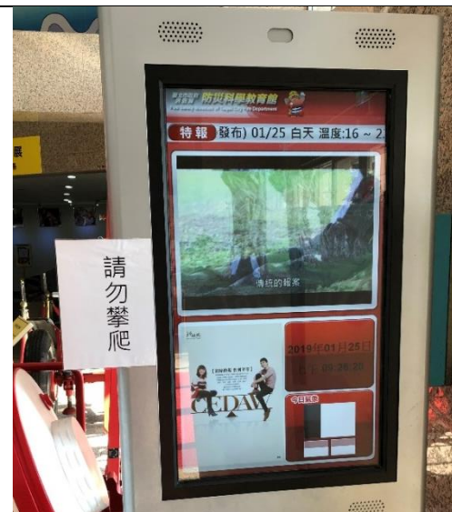
說明：於防災館多媒體傳播平台海報宣導市民性別平等及 CEDAW 宣導文宣。