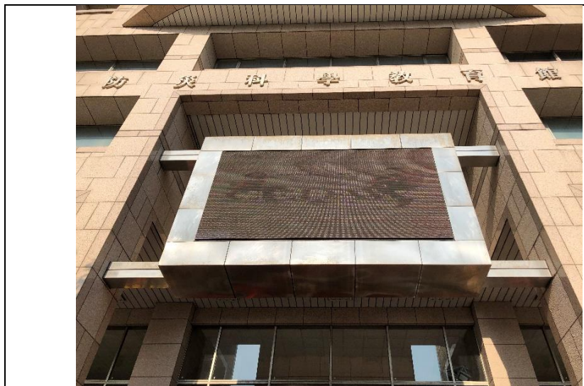
說明：於防災館外牆 LED 螢幕輪播市民性別平等及 CEDAW 宣導文宣。