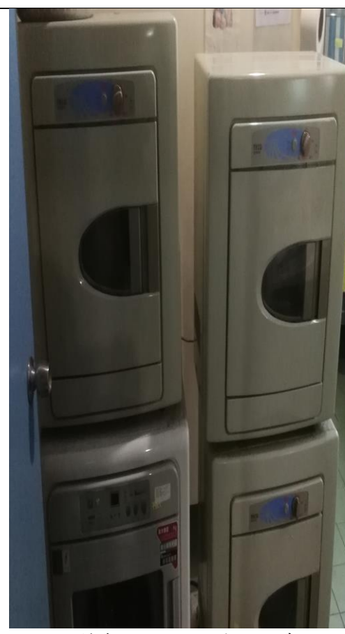
說明：備勤浴室，內置烘衣機