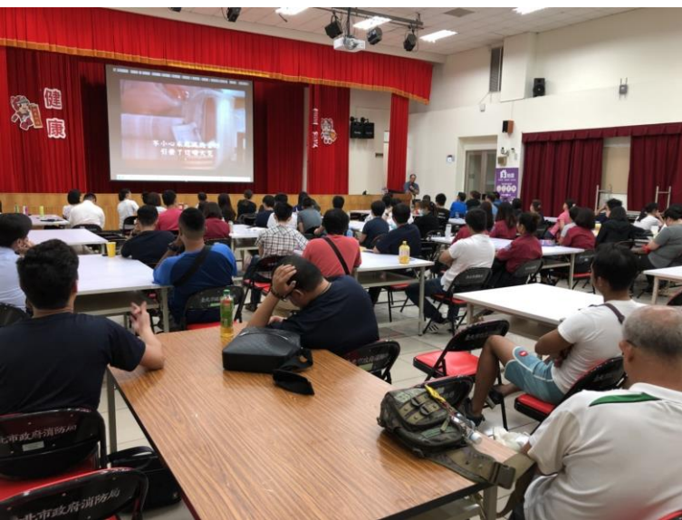
說明：義消訓練情形