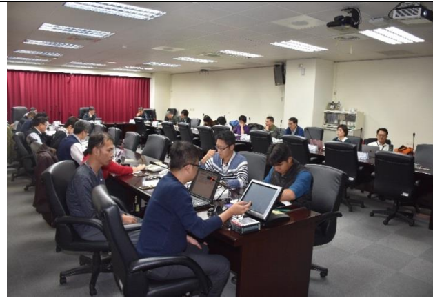
說明：107年12月13日召開第4次鑑委會會議