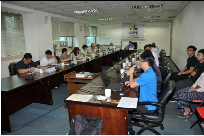
說明：107年7月5日召開第3次鑑委會會議