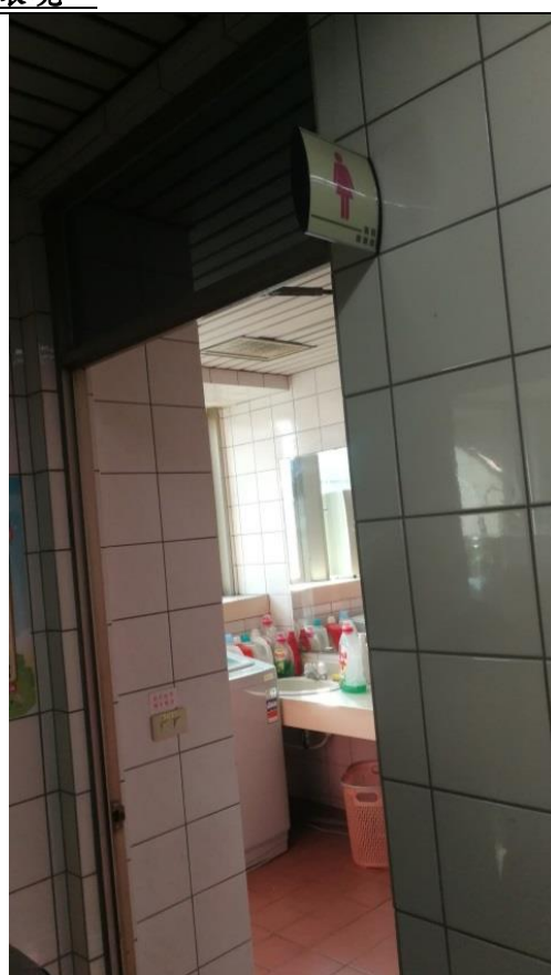
說明：設置女性專用盥洗室