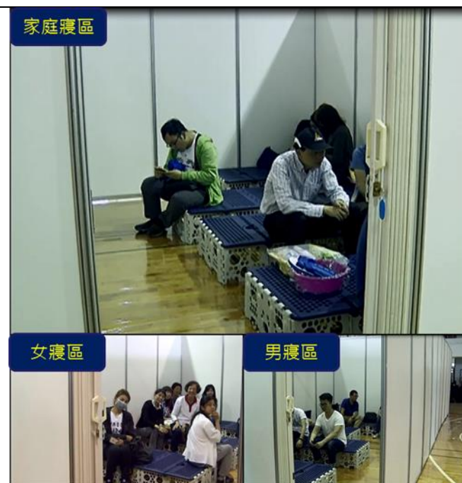
說明：室內收容所-住宿區(家庭寢區、女寢區、男寢區)

3、方案名稱： (人事室)107年度臺北市衛生局「優良哺集乳室認證」 本局參加本府衛生局107年度優良哺集乳室認證作業，計有第三大隊松江分隊及第四大隊陽明山分隊等2個單位，獲得認證通過，認證效期為107年9月至110年8月。