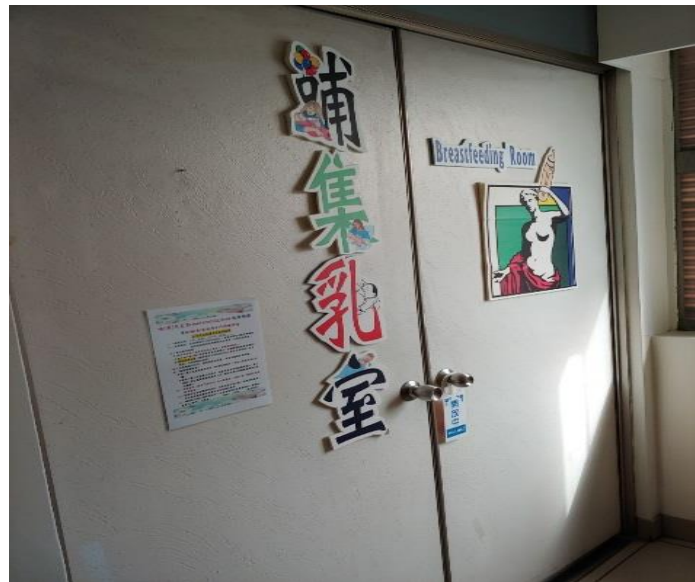
說明：本局哺集乳室