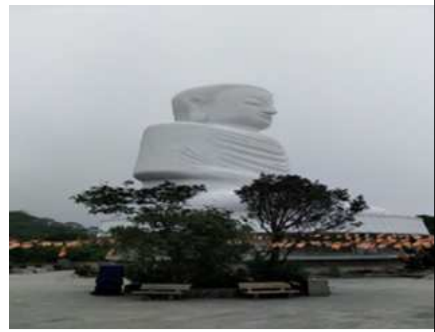
圖片說明：山上靈應寺大佛