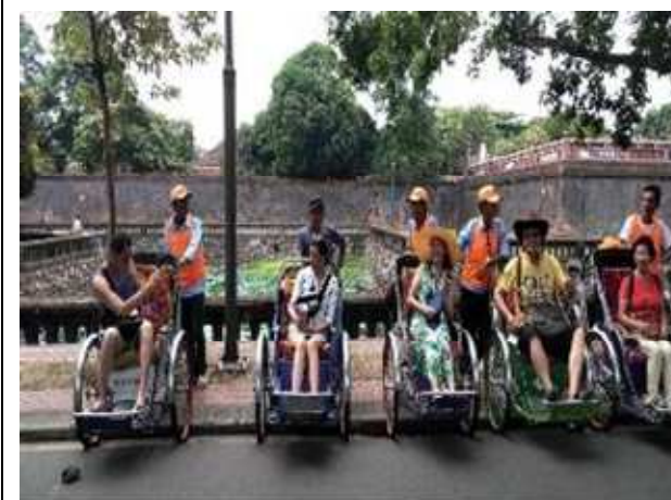
圖片說明：里長們搭乘越南人力車