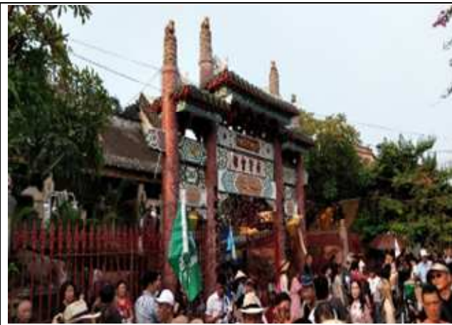
圖片說明：廣東會館