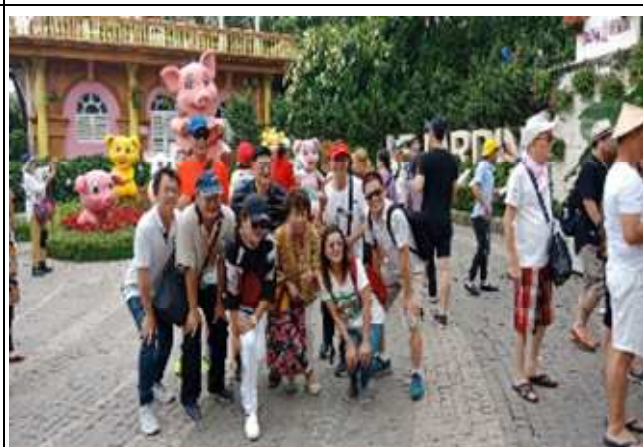
圖片說明：巴拿山空中花園廣場前合影