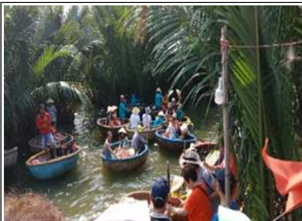
圖片說明：里長們乘坐當地特色竹桶船遊迦南島