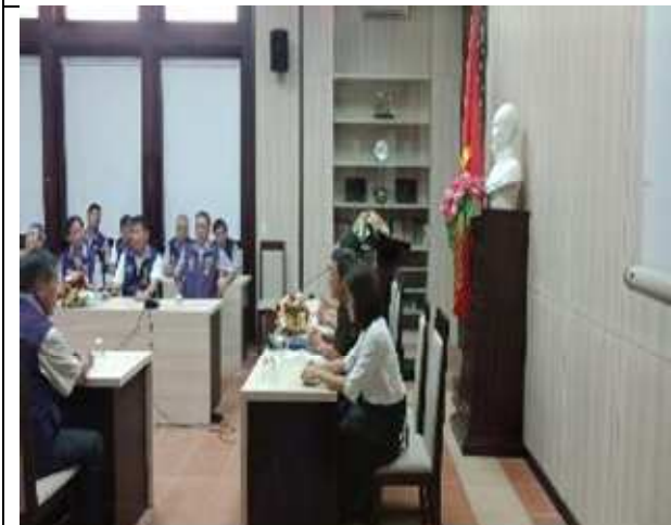
圖片說明：中心代表發表報告事項