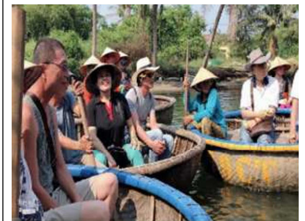
圖片說明: 里長們乘坐當地特色竹桶船遊 迦南島