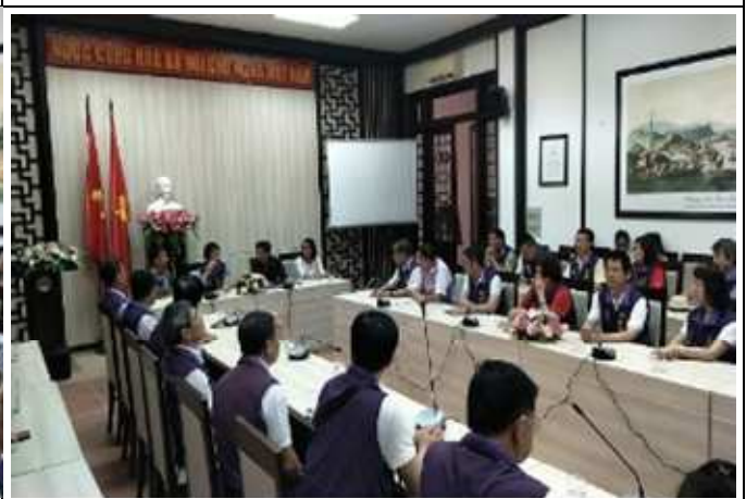
圖片說明：與會人員於討論會上意見交流