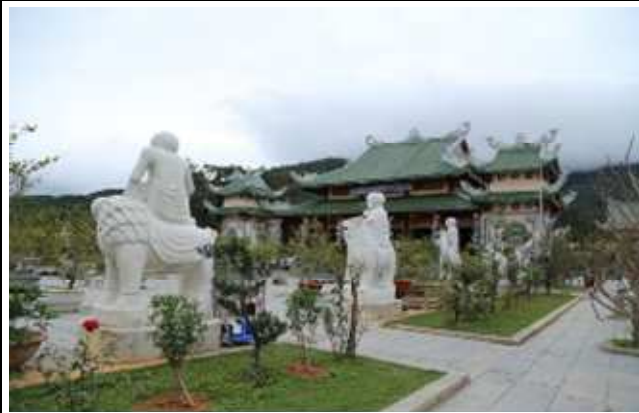
圖片說明：靈應寺前的羅漢雕像