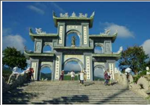
圖片說明：山上靈應寺