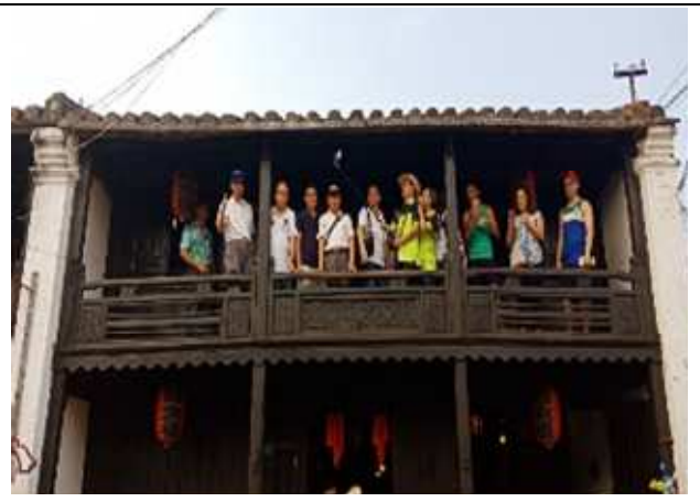
圖片說明：會安古城內日本橋