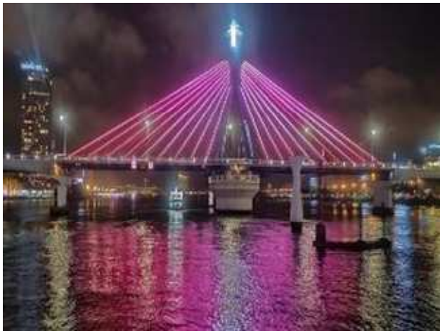
圖片說明: 韓江美景