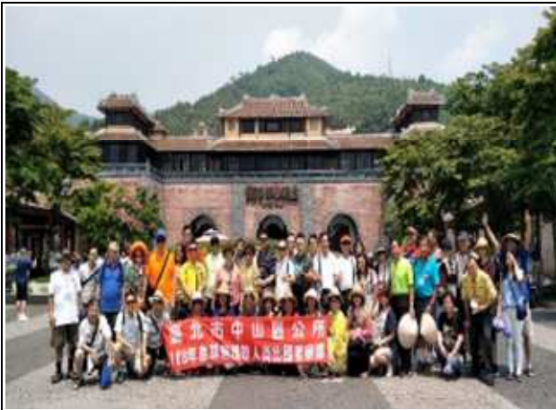
圖片說明：在巴拿山前合影