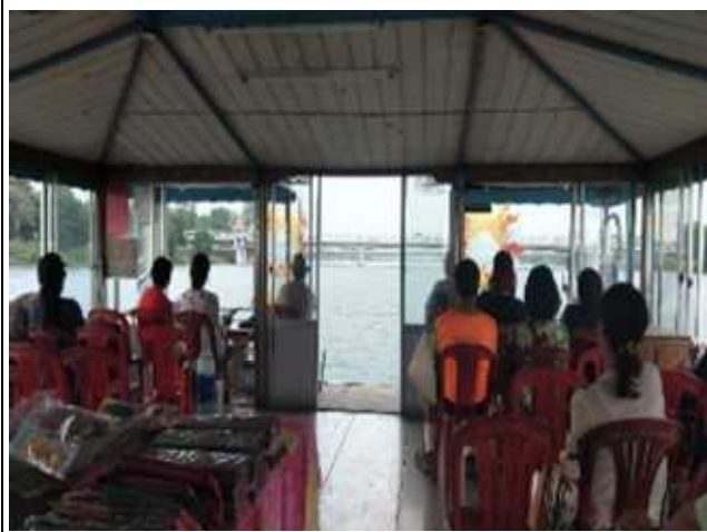
圖片說明：搭乘香江龍船