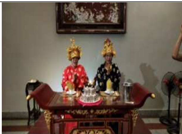
圖片說明: 為四月份壽星慶生