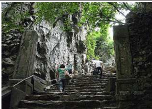
圖片說明: 登山步道