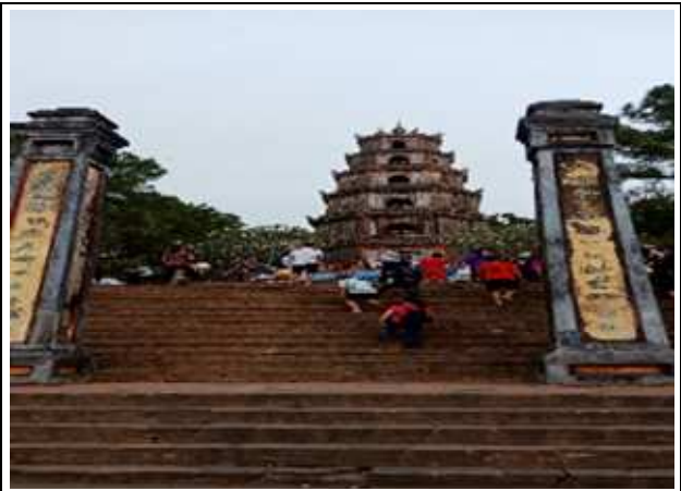
圖片說明：寺口階梯及福緣塔