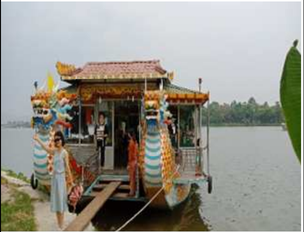
圖片說明：搭乘香江龍船