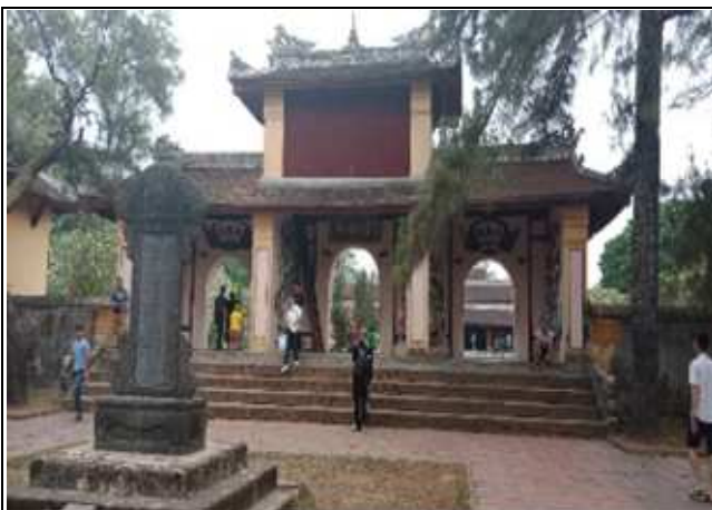
圖片說明：天姥寺牌樓