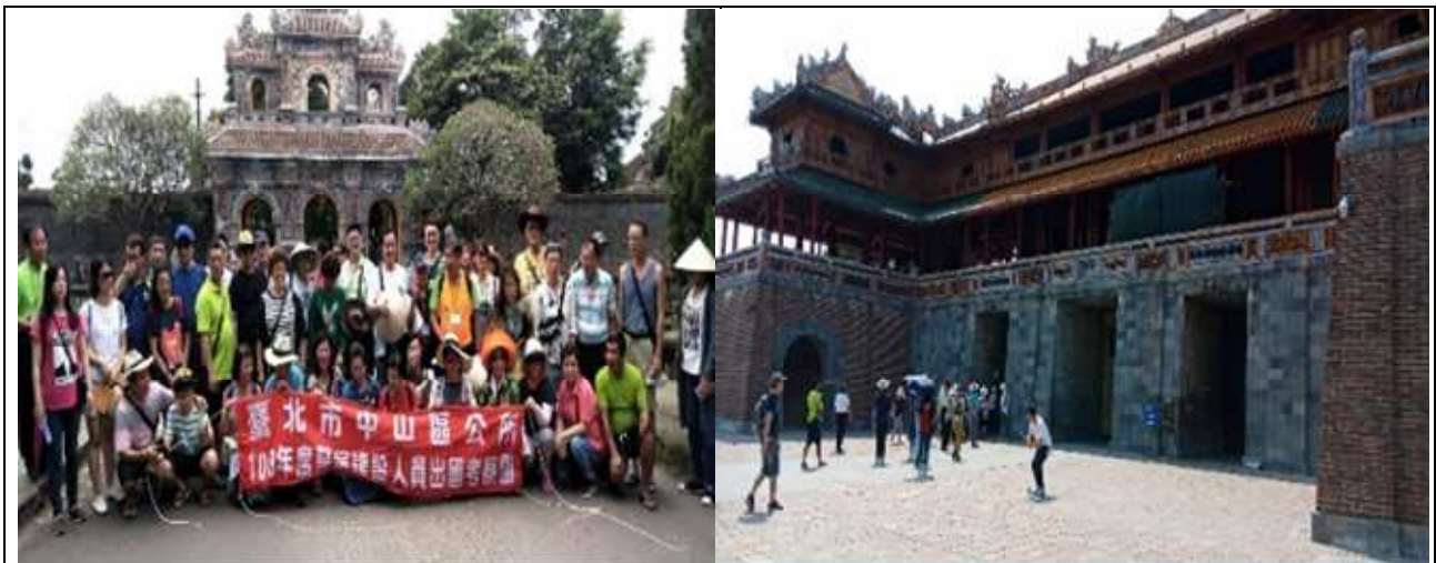
圖片說明：參觀順化皇城合影