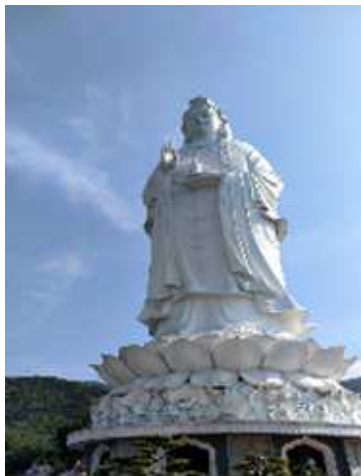
圖片說明：東南亞最高觀音像