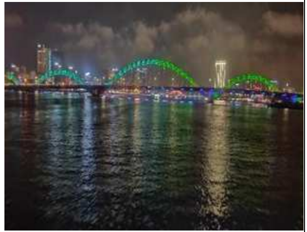
圖片說明: 韓江美景