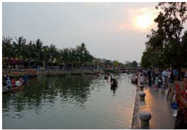
圖片說明：會安古城運河