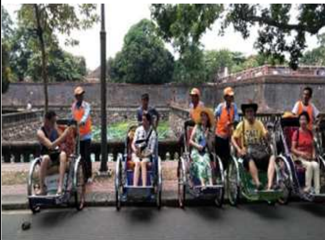
圖片說明：搭乘人力三輪車遊覽皇城