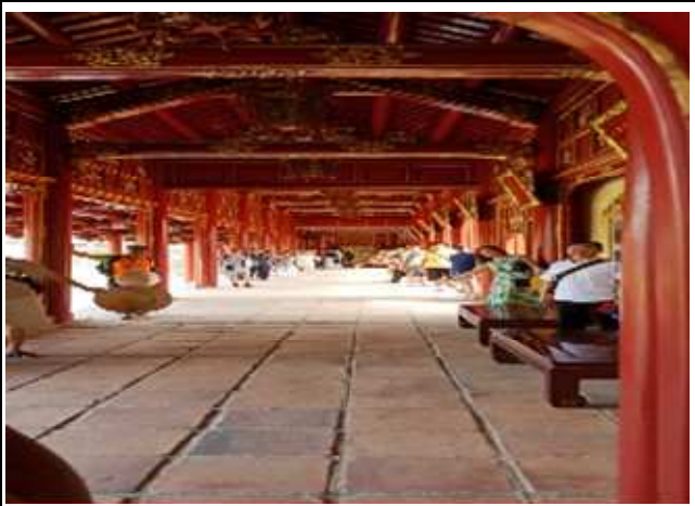
圖片說明：參觀皇城內部