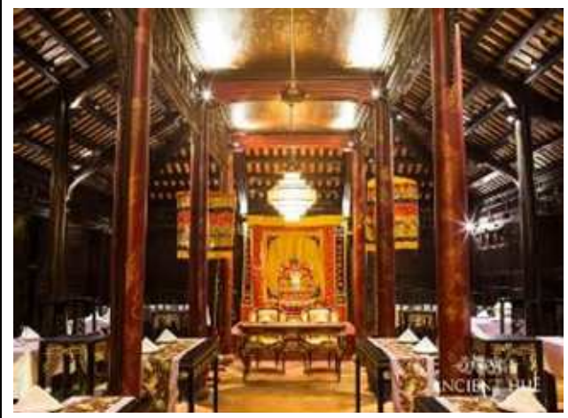
圖片說明：享用順化皇帝宴