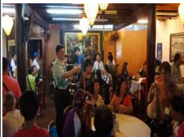
圖片說明：里長們品嚐越南當地風味下午茶