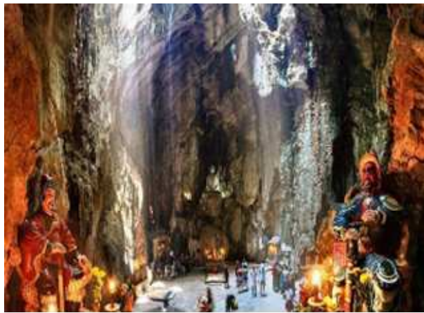
圖片說明: 參觀山頂石窟