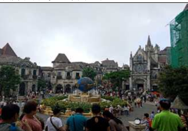
圖片說明: 夢幻樂園全景