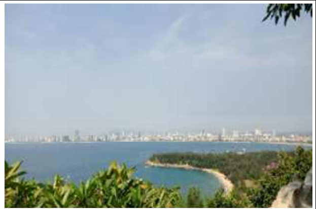
圖片說明：從山茶半島眺望美溪沙灘