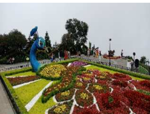
圖片說明：空中花園藝術造景