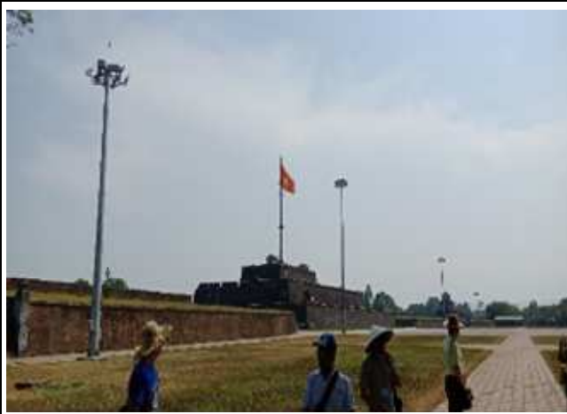
圖片說明：參觀皇城外部