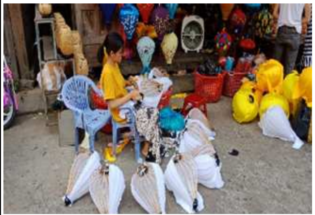
圖片說明：會安傳統手作燈籠