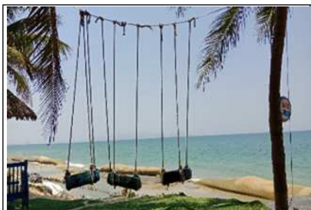
圖片說明: 美溪沙灘