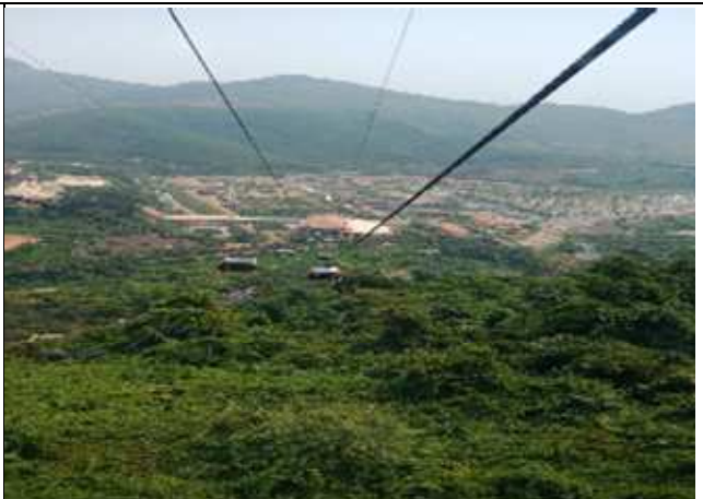
圖片說明：搭乘金氏世界紀錄纜車上山