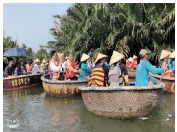
圖片說明: 里長們乘坐當地特色竹桶船遊 迦南島