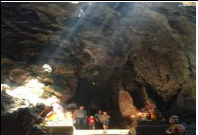
圖片說明: 參觀天然石洞