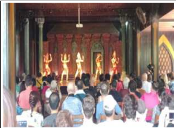
圖片說明：欣賞當地少數民族舞蹈表演