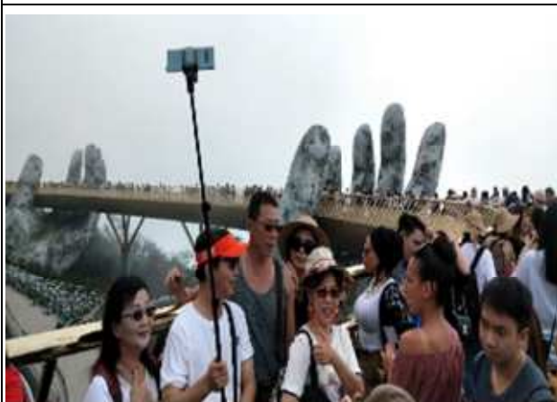
圖片說明：在知名地標黃金佛手前合影