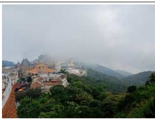
圖片說明: 夢幻樂園全景