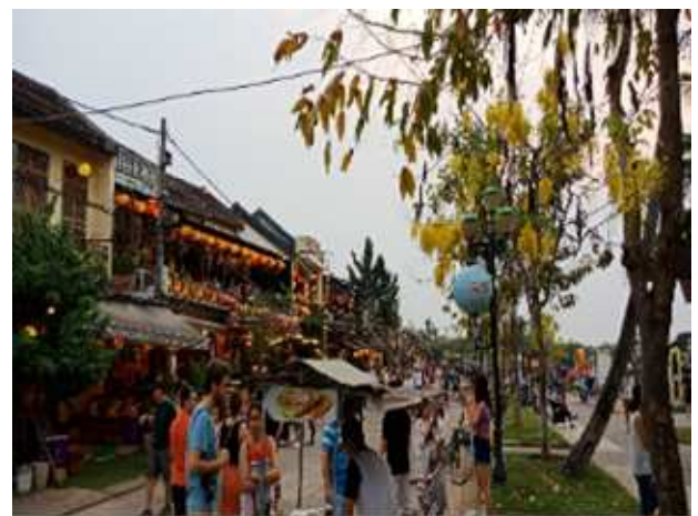
圖片說明：會安古城街景