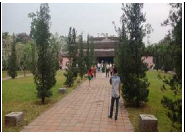
圖片說明：天姥寺大殿