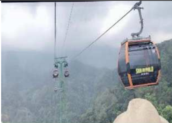
圖片說明：纜車上俯瞰森林景色