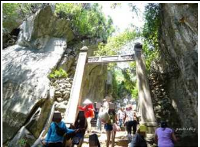
圖組說明: 導遊講解遊覽五行山