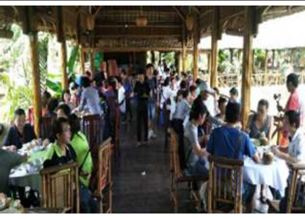
圖片說明: 里長們品嚐迦南島當地風味餐