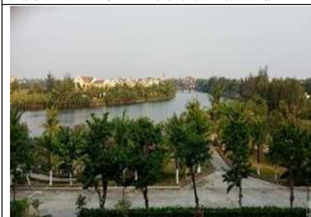
圖片說明: 夢幻樂園一角景色