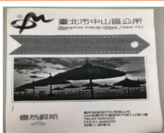
優然假期旅行社製作之旅遊手冊