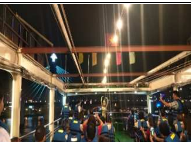
圖片說明: 遊輪上當地表演