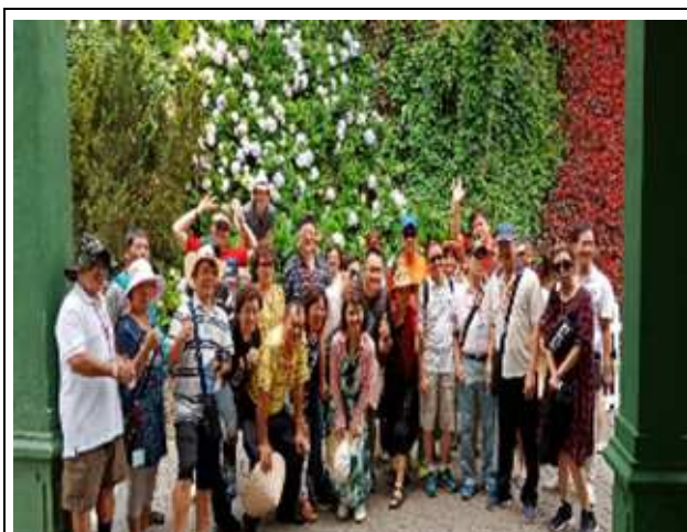
圖片說明: 巴拿山空中花園廣場前合影