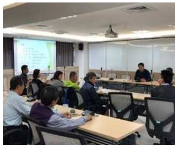
里長參加行前說明會踴躍發問