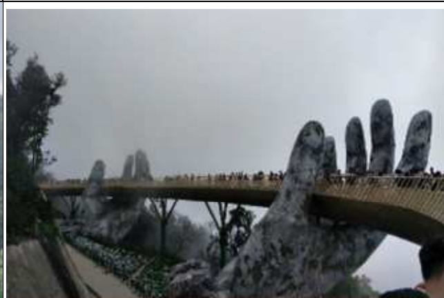
圖片說明：參訪知名地標黃金佛手