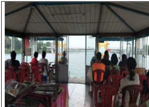
圖片說明: 搭乘香江龍舟遊船