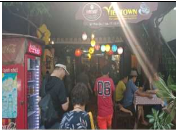
圖片說明：里長們品嚐越南當地風味下午茶