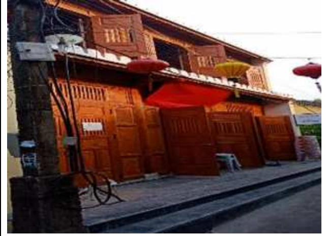
圖片說明：會安古城街坊景色