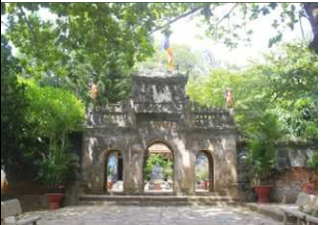
圖片說明: 參觀山頂牌樓