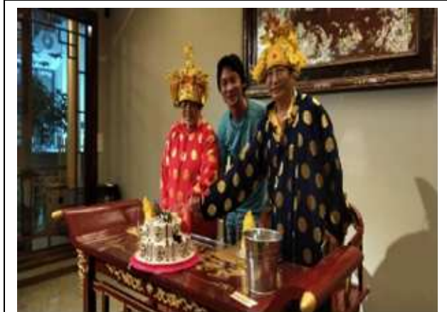
圖片說明: 會長與壽星合影