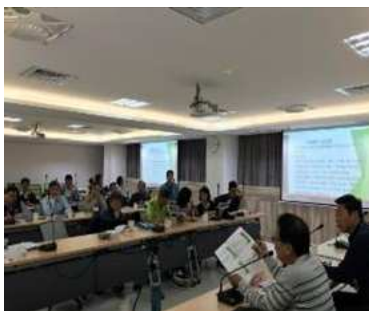
承辦課室-民政課報告