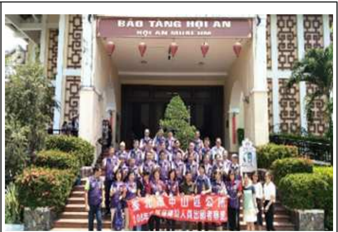
圖片說明：與會人員及會安古蹟管理和保護中心總經理於館前合影留念