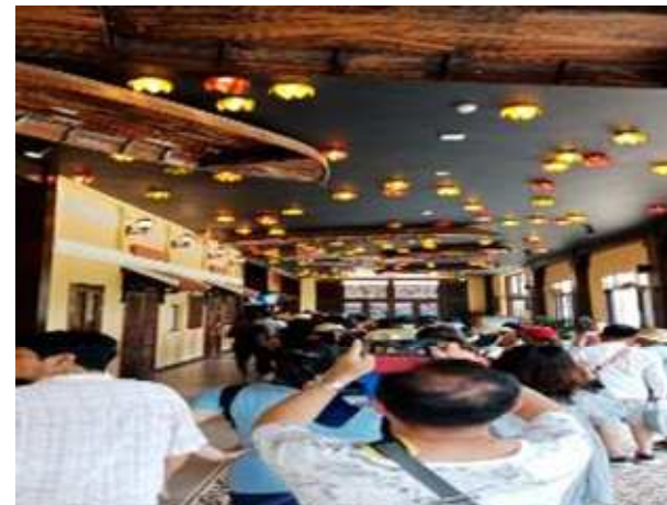
圖片說明：博物館內景觀