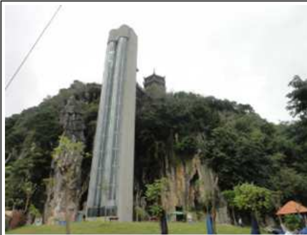
圖片說明: 觀景電梯登高