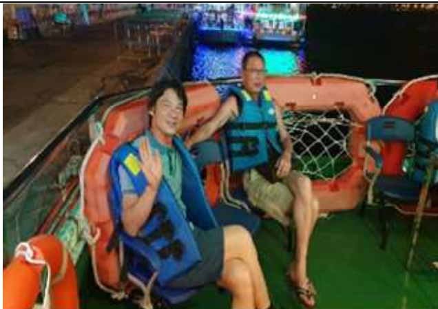
圖片說明: 於韓江上游輪合影