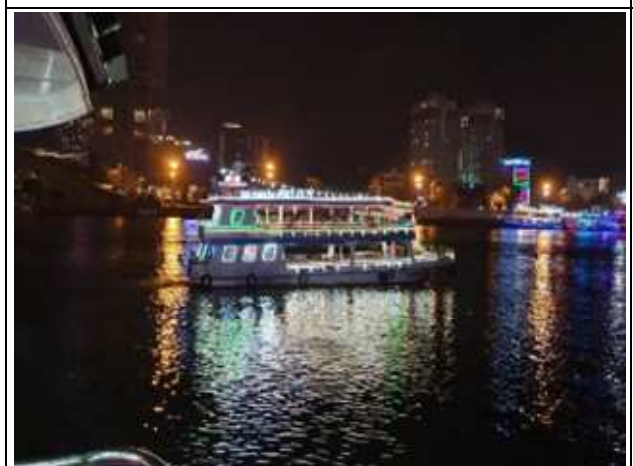
圖片說明: 夜遊韓江