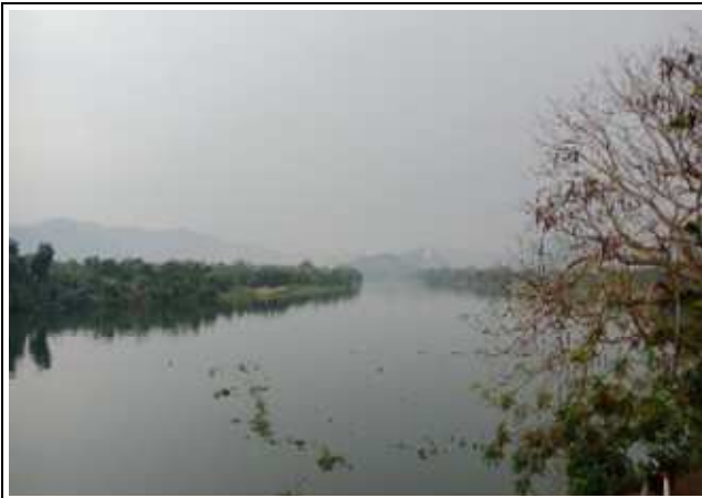
圖片說明：香江河畔