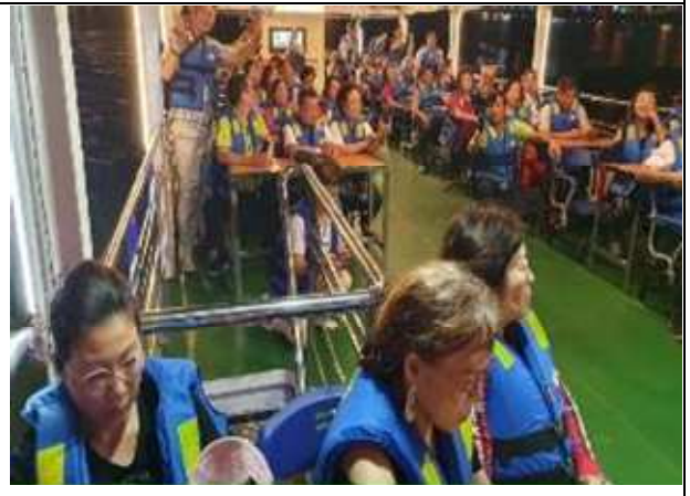
圖片說明: 於韓江上游輪合影