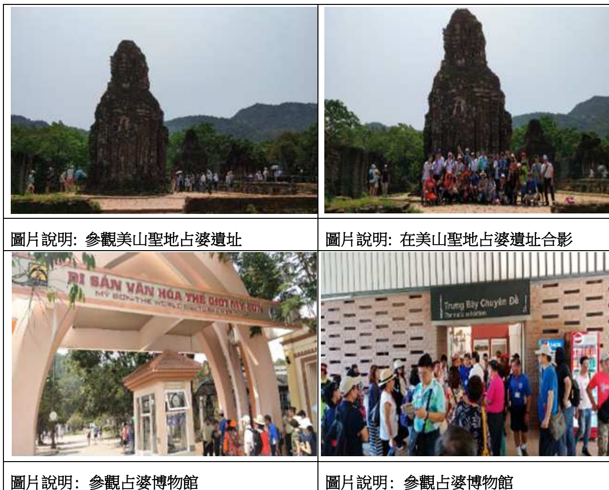
圖組 5 -美山聖地

在 1999 年，聯合國教科文組織將美山寺廟作為文化遺產，列入世界遺產名錄。美山聖地被認為滿足世界遺產登錄基準中的以下基準而予以登錄：在某期間或某種文化圈裡對建築、技術、紀念性藝術、城鎮規劃、景觀設計之發展有巨大影響，促進人類價值的交流。呈現有關現存或者已經消失的文化傳統、文明的獨特或稀有之證據。