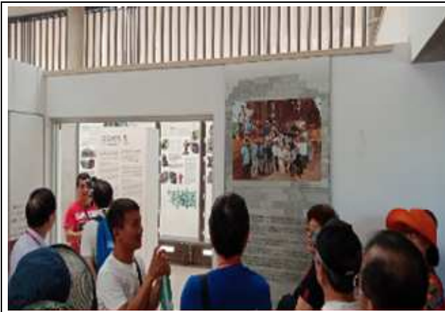
圖片說明：解說員介紹占婆博物館