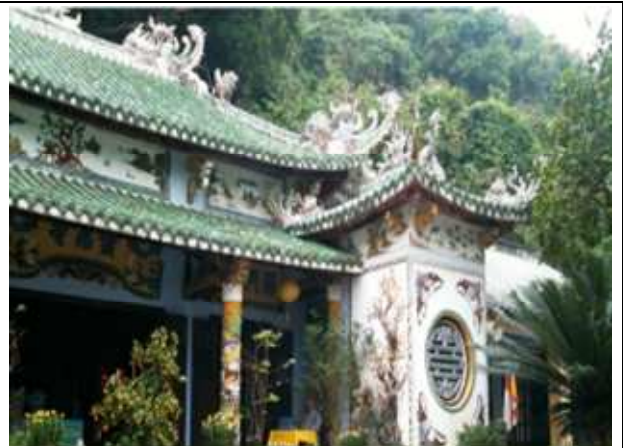
圖片說明：靈應寺正殿