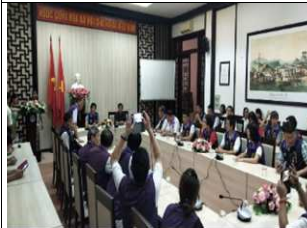
圖片說明：與會人員於討論會上討論問題