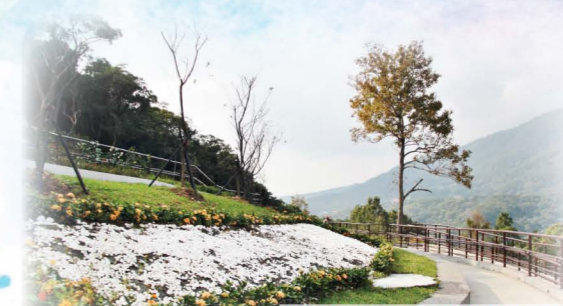
陽明山臻善園(花葬區)