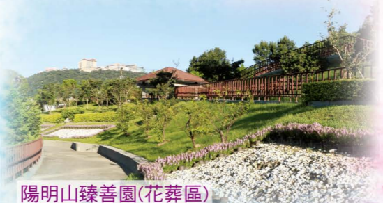
陽明山臻善園(花葬區)