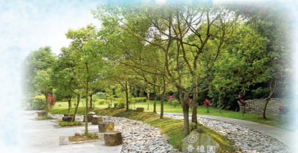
富德詠愛園(樹葬區)