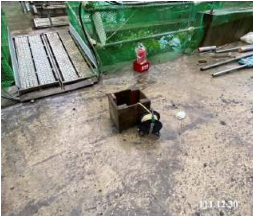
12 月 份 水 位 觀 測 (W002)