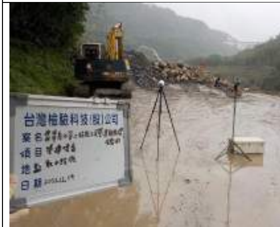
營建噪音(取水設施)