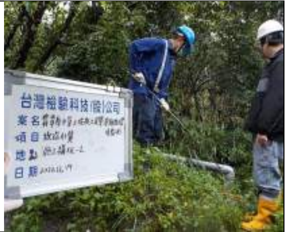
工區放流水(2號施工橫坑)