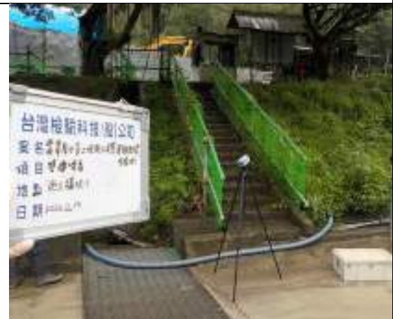
營建噪音(1號施工橫坑)