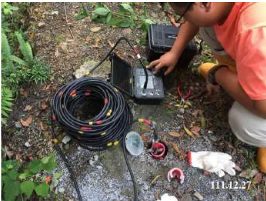
12 月 份 傾 斜 觀 測 (C62)