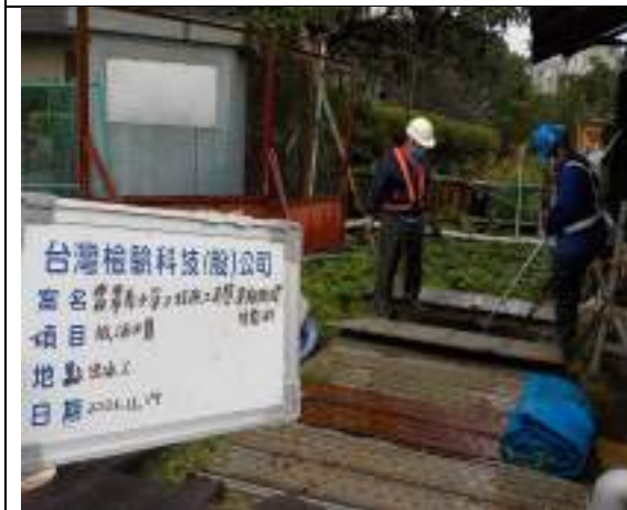
工區放流水(出水工)