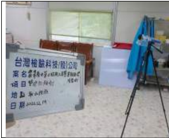
低頻噪音(取水設施)