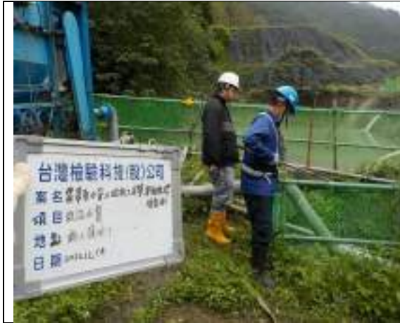
工區放流水(1號施工橫坑)