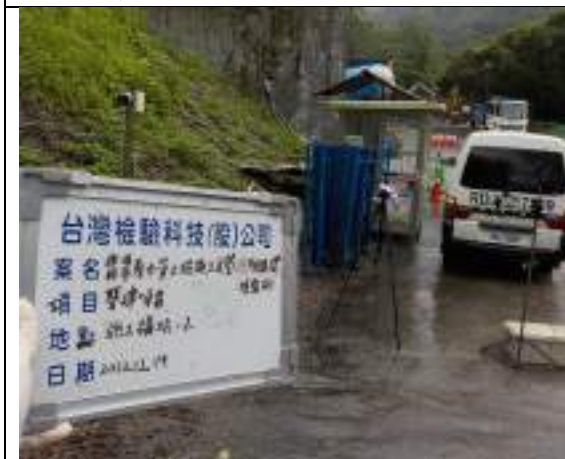
營建噪音(2號施工橫坑)