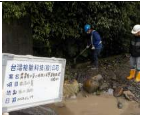
工區放流水(取水設施)