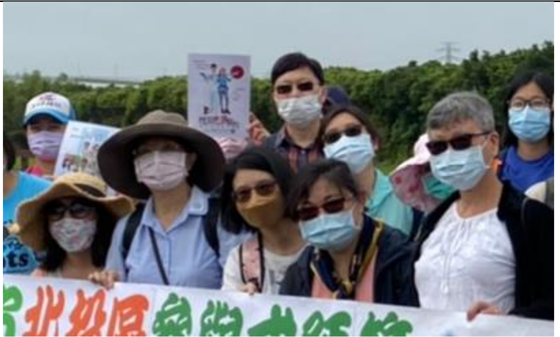
111年3月19日 洲美五分港溪及北投焚化爐走讀，於導覽時置入性平宣導