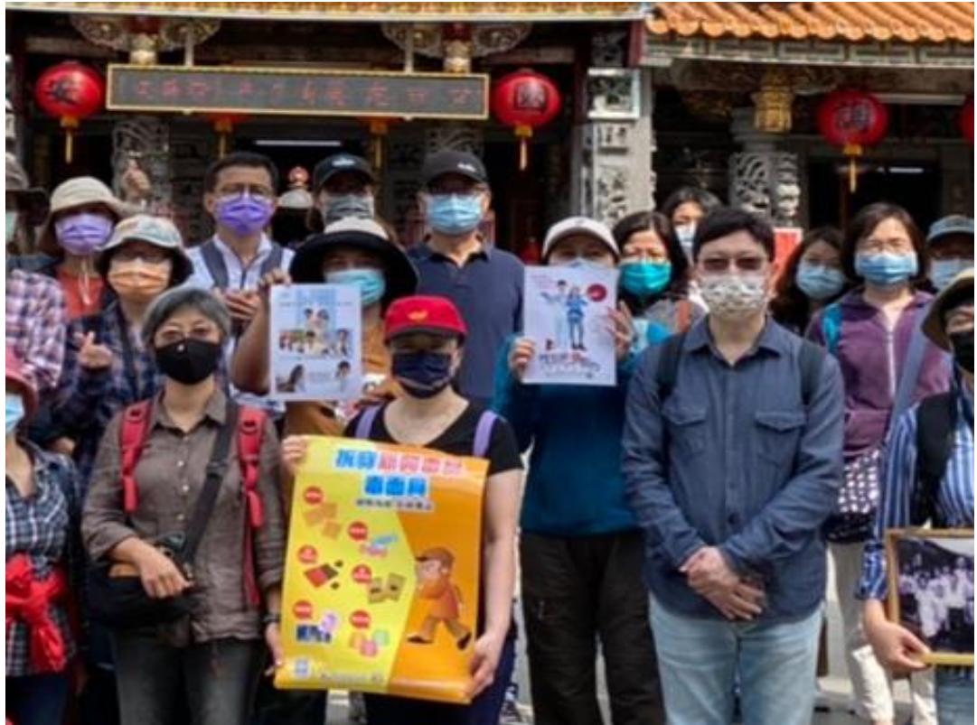
111年3月5日 慈生宮及唶哩岸打石場走讀，於導覽時置入性平宣導