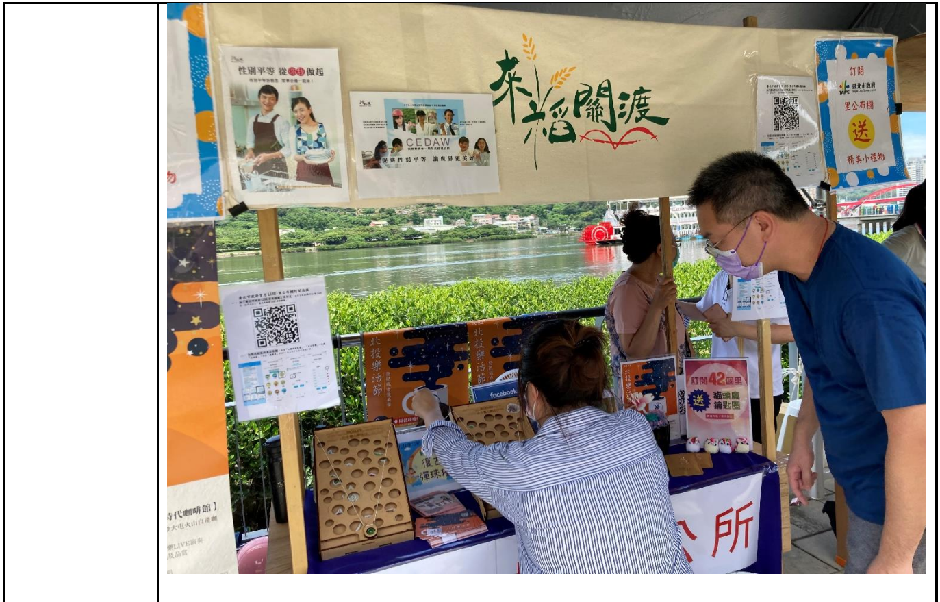
推展性別平等工作策略及具體措施類別及項目執行情形表