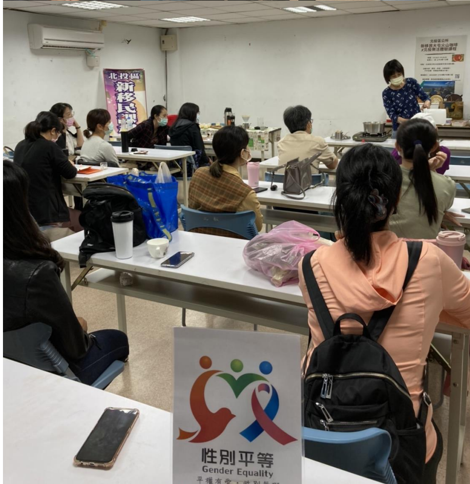
辦理活動時優先考量設有性別友善設施設備之場地