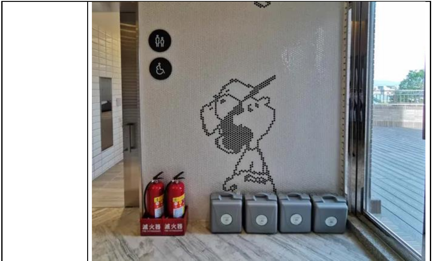
推展性別平等工作策略及具體措施類別及項目執行情形表