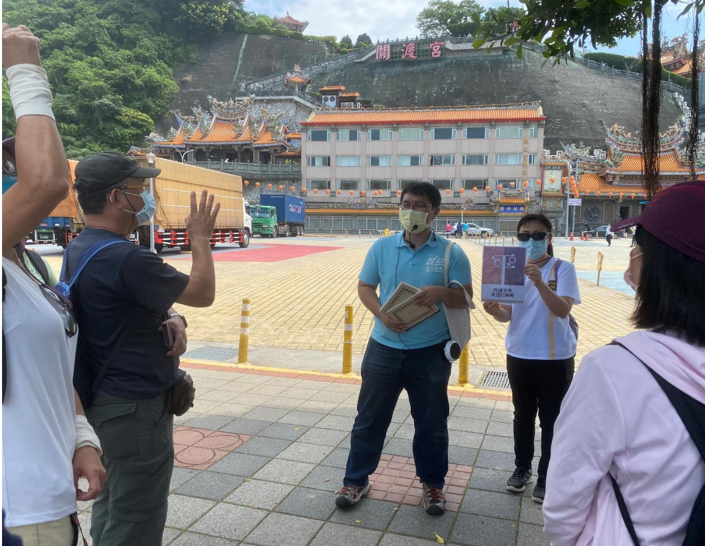
走讀活動-性別平等宣導品：