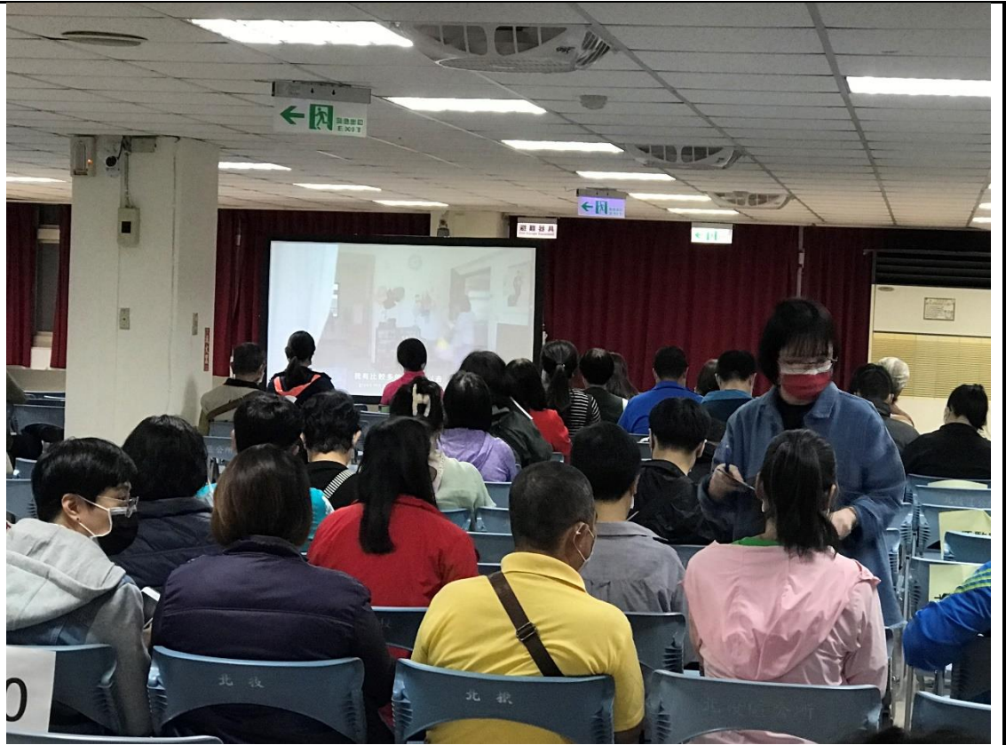
辦理活動時優先考量設有性別友善設施設備之場地