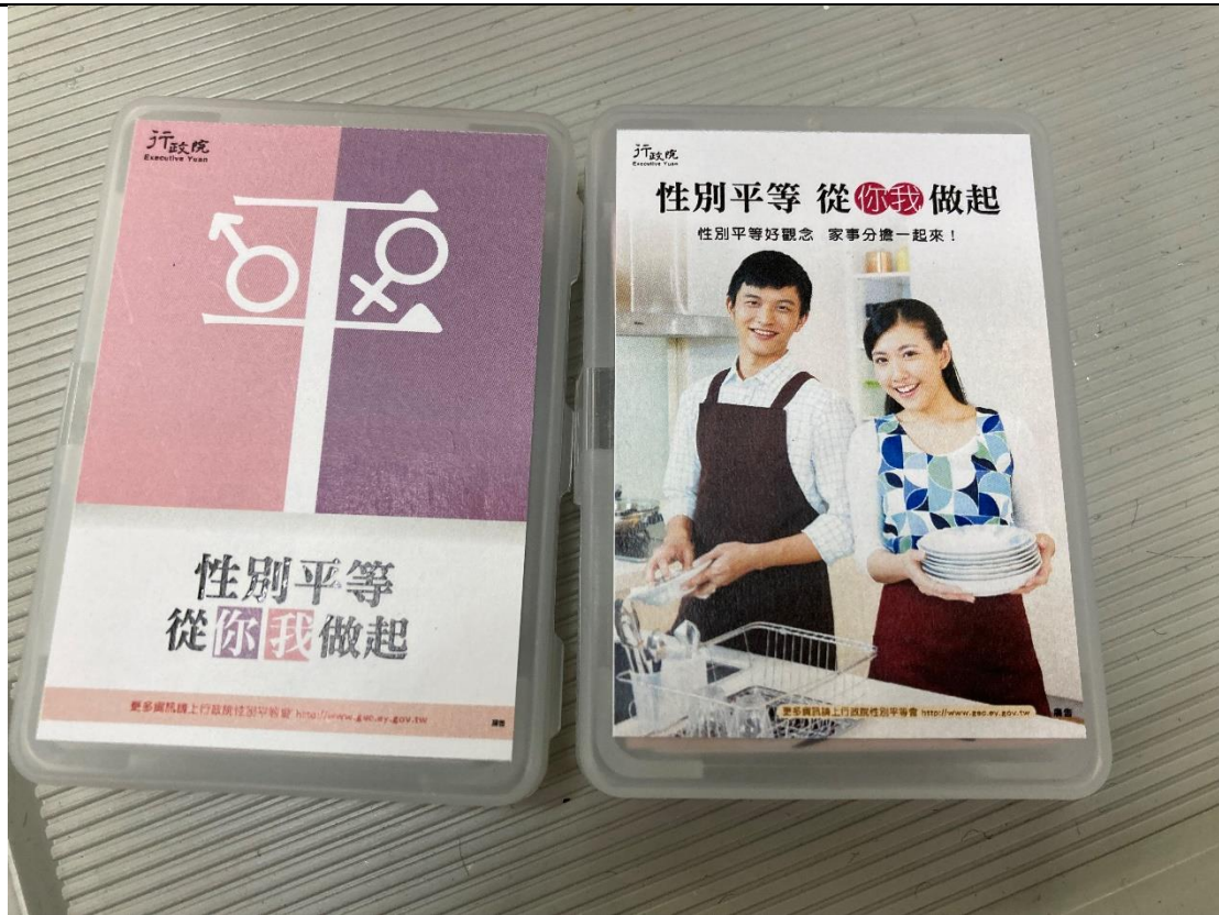
於活動進行中宣導性平。