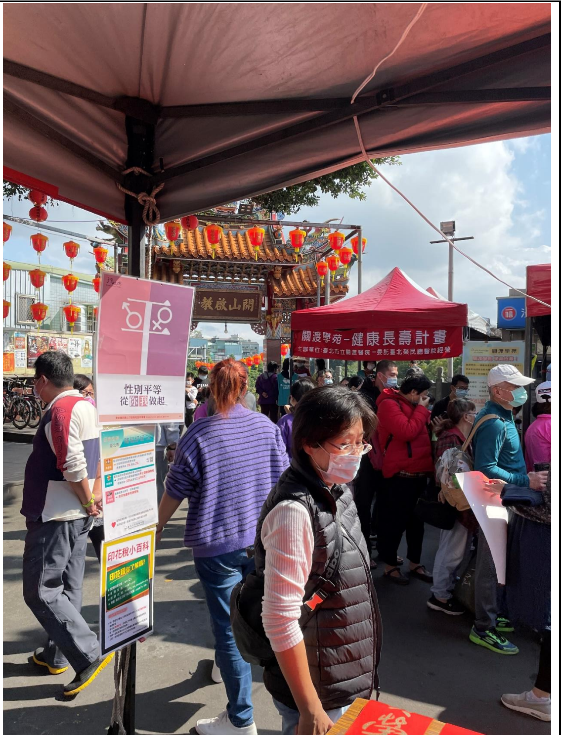
推展性別平等工作策略及具體措施類別及項目執行情形表