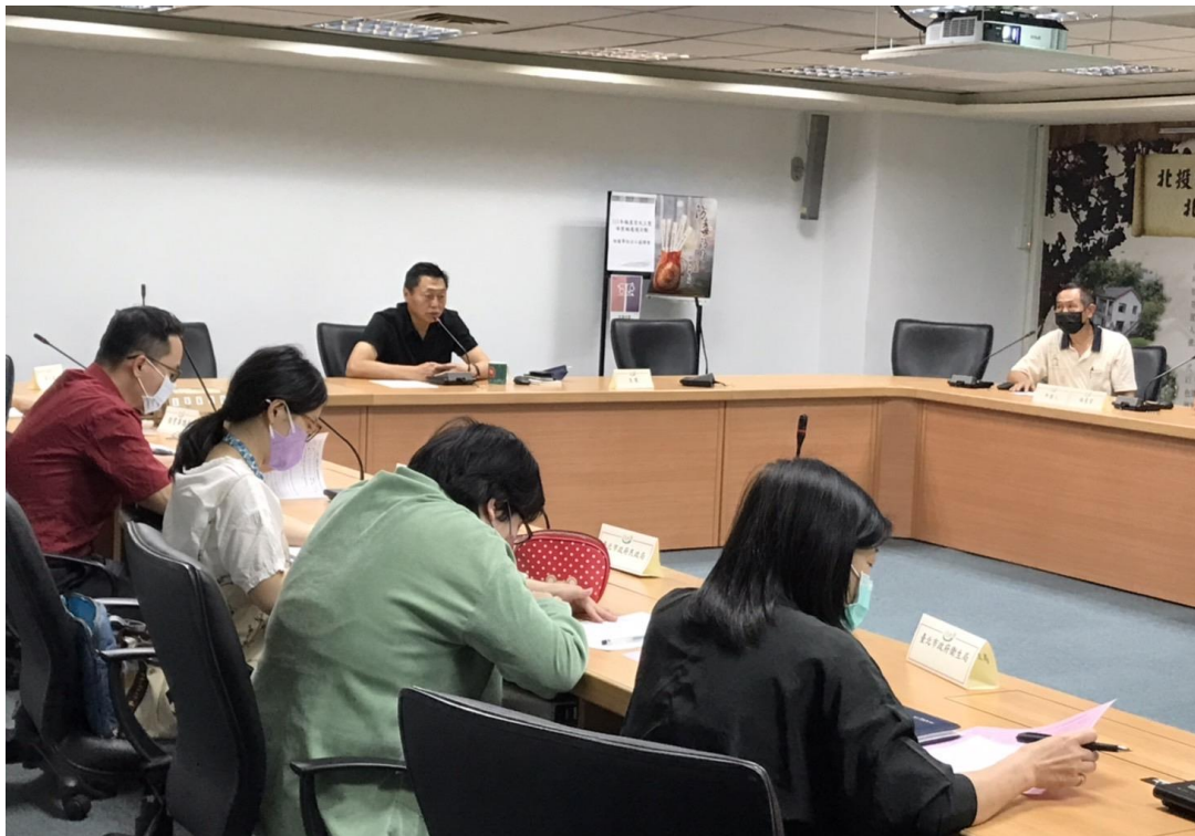
辦理活動時優先考量設有性別友善設施設備之場地