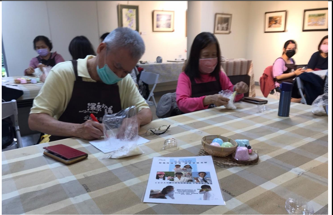
辦理活動時優先考量設有性別友善設施設備之場地