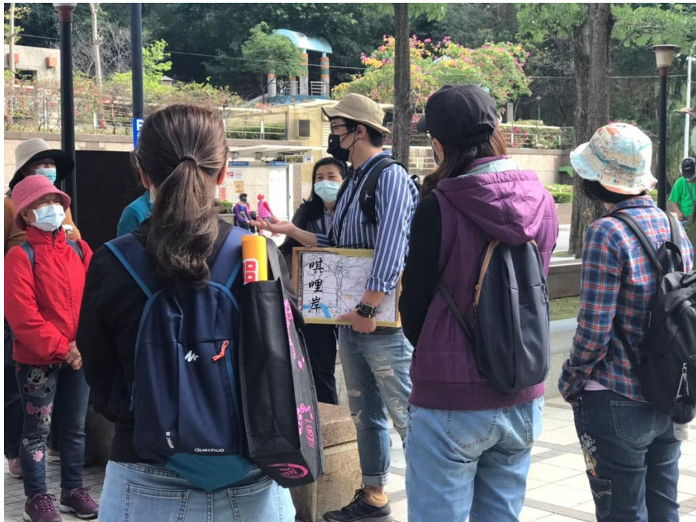
111年3月19日 洲美五分港溪及北投焚化爐宣導照片