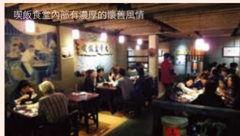
喫飯食堂內部有濃厚的懷舊風情

也是美食比賽中的得獎高手，包括臺北市商業處舉辦的91年度簡餐美食選拔賽榮獲「金質獎」，而且用「小吃」拼「大菜」還能得獎，困難度更高，也由此可知喫飯食堂認真對待食材、服務客人的態度。來到店內，招牌雞腿、芋香排骨等名菜，必點！