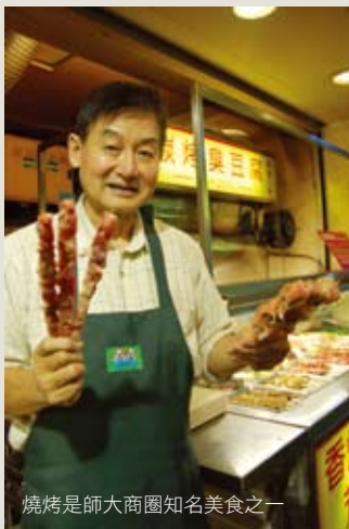
燒烤是師大商圈知名美食之一

龍泉街裡的美食餐廳、美食攤，網站上一搜尋通常就會有一大串資料可供網友參考，不過這次不找滷味、吃牛排、嚐南洋美食，而是嚐嚐商圈內一家很不起眼的燒烤小店「香烤小肥羊」。這家小店原本在龍泉街、師大路49巷口，後來搬到49巷內。小攤位前放著滿滿一串串的碳烤食材，最受歡迎的有小肥羊、牛小排、臭豆