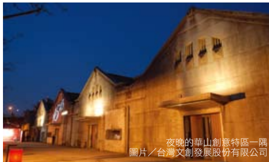
夜晚的華山創意特區一隅

擴建，斑駁的廠房牆面，更見證了自日治時期以來的臺灣酒類專賣史。完整的製酒產業建築群更成為一座產業建築技術的博物館。酒廠搬遷後金枝演社進入廢棄華山園區演出，被指侵佔國產，藝文界人士群起聲援，最後爭取到臺北酒廠再利用，成為多元發展的藝文展演空間，並正式更名為「華山藝文特區」，成為藝文界、非營利團體及個人使用的創作場域。