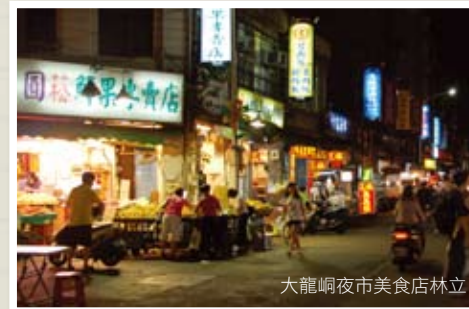
大龍峒夜市美食店林立

來到保安宮，逛完了44坎，大龍峒夜市就是旅遊、逛街補充體力最重要的一站。整個夜市其實全長不到200公尺，攤位大多集中在大龍街與酒泉街口的馬路兩旁，每天一到傍晚夜市開始營業後，很容易就能發現外國觀光客來這裡找吃的。幾家常在電視、報紙上出現的美食小吃名店，看到招牌、發現人潮就能讓人想跟著排隊來品嚐。