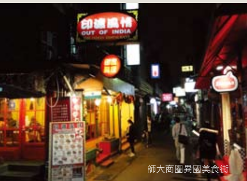
師大商圈異國美食街

韓國料理店「飯館兒」，傳統、平價的韓國料理，有套餐、韓國烤肉，份量十足又能符合學生的口袋，所以店裡的消費主力幾乎都是年輕人。而其他家美食餐廳也不遑多讓，整條街一到夜晚就全都是找美食的饕客。