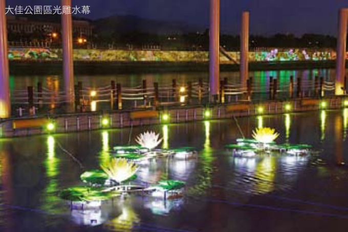
大佳公園區光雕水幕