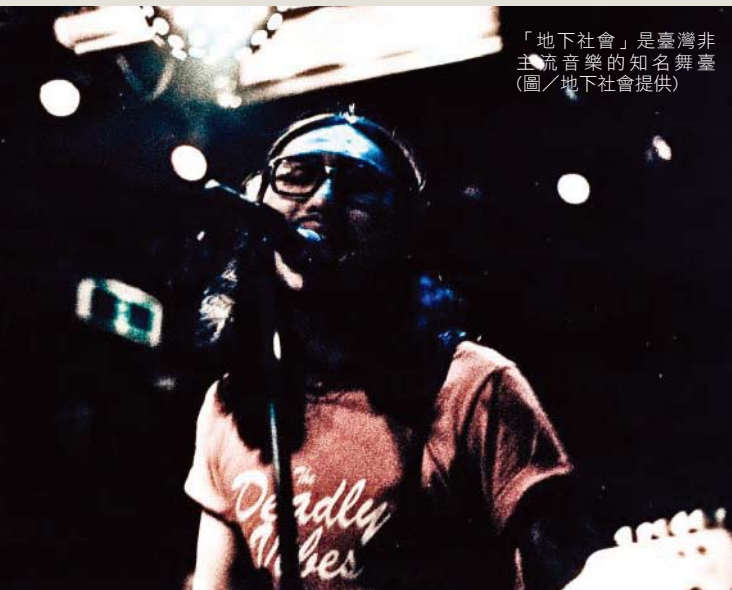
「地下社會」是臺灣非主流音樂的知名舞臺

臺灣社會氛圍還不是很開放的年代，地下社會經常被警察取締，久而久之反而塑造這處音樂聖地在音樂舞臺上的特殊性。