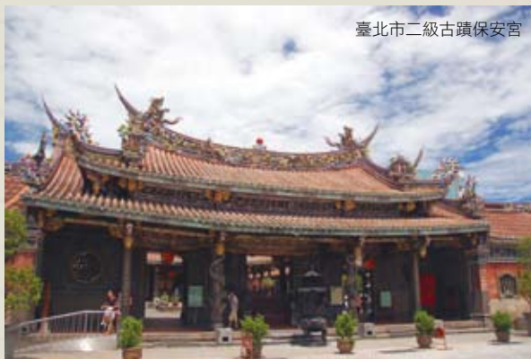
臺北市二級古蹟保安宮

大龍峒44坎是臺北市十分具特色的街區，商業處先前規劃以「保安·養生·漢學」為定位，輔導並吸引新店家進駐44坎及協助舊有店家轉型，也輔導原為傳統中藥行的正一堂，首度開發出養生狀元餅與藥膳包，而原本販售金牛角麵包的金儒家，也融合漢