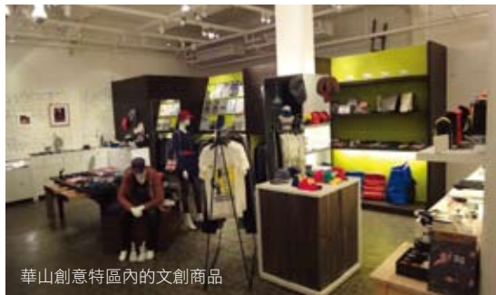
華山創意特區內的文創商品