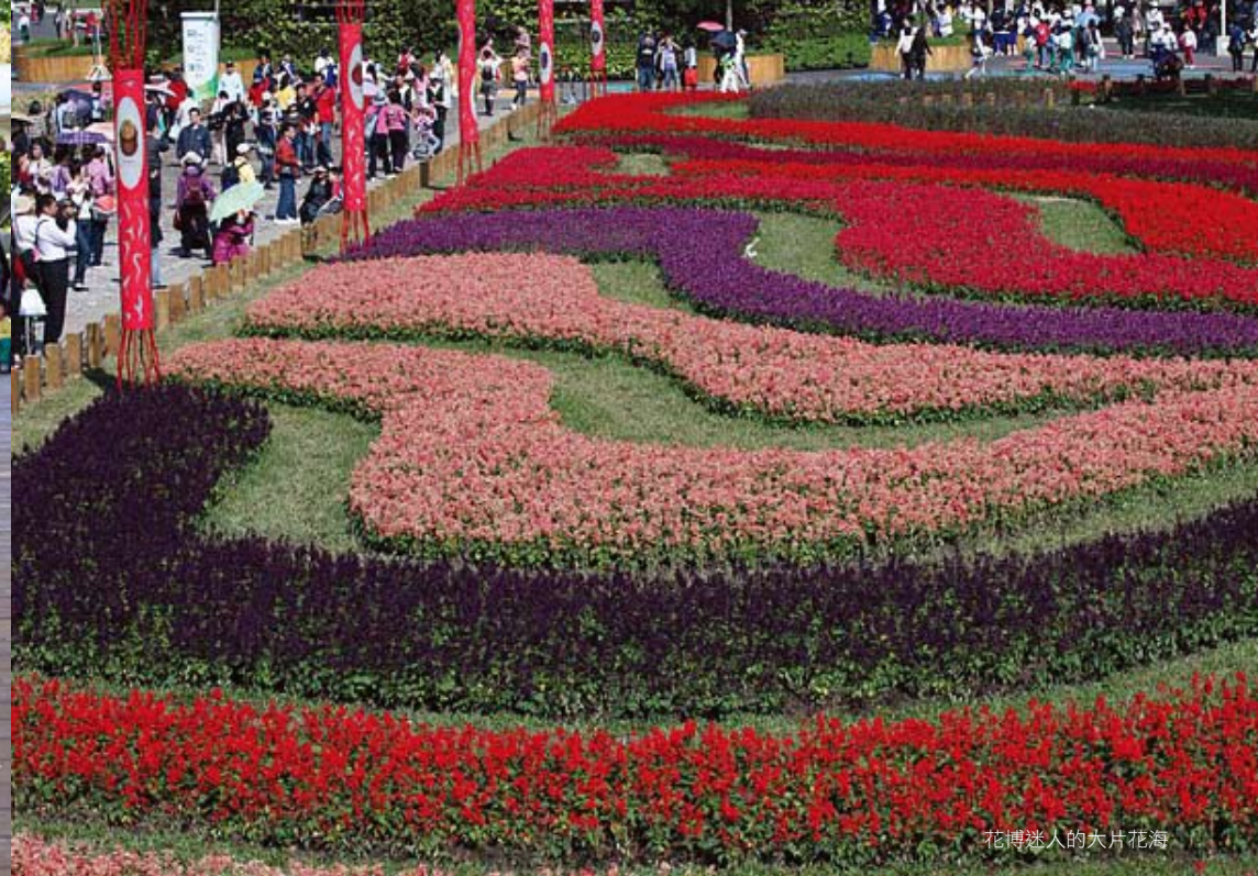
花博迷人的大片花海