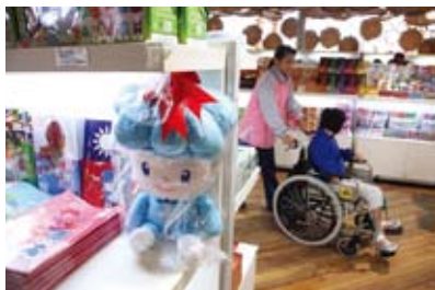
園區也有販售可愛的紀念品唷