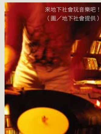
來地下社會玩音樂吧！

樂表演中心「地下社會」，就藏身在這不起眼的空間裡。這裡是許多師大人、外國留學生的共同記憶，店名