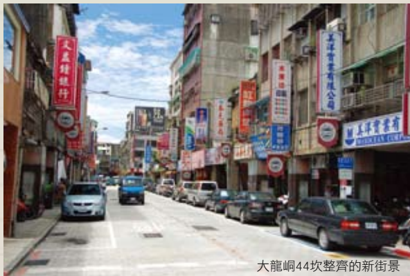
大龍峒44坎整齊的新街景

學元素，開發文房四寶伴手禮，並推出漢餅，打造傳統糕餅新口味。商業處還施作具大龍峒特有文化風味整體改造，有效美化舊有街道景觀，讓整個44坎附近商圈呈現完全不同以往的古味。