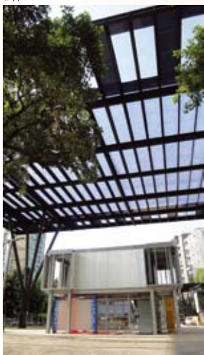
臺北市電影主題公園

幾十年來，看戲、看電影休閒活動已是西門町的主要特色，為呈現西門町電影產業的文化特色，位於康定路、武昌街口的電影主題公園，園內呈顯獨特電影氛圍的場景，值得一探。原為日治時代臺灣瓦斯株式會社社址，迄今仍保存著當年廠房、煙囪及煉焦爐等設施，經過改裝後及新搭鋼棚、鋼