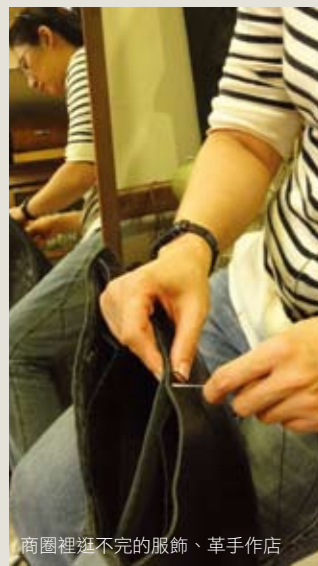
商圈裡逛不完的服飾、革手作店