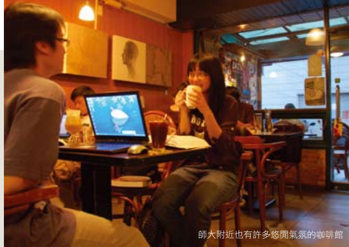
師大附近也有許多悠閒氣氛的咖啡館

腐、豬肉捲、肥腸等，其中小肥羊和孜然粉配方來自老閩習自大陸新疆的秘方，口味特殊，在夜市裡已屹立20年，連一些電視名人也是他的常客。