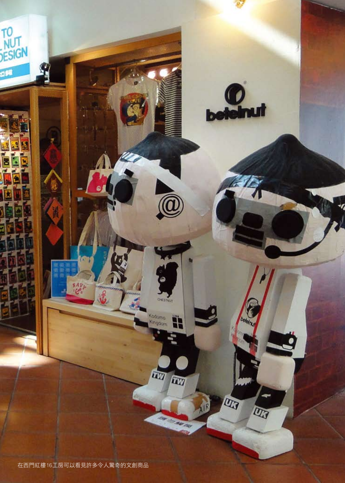
在西門紅樓 16 工房可以看見許多令人驚奇的文創商品

的北廣場在假日則有創意市集、月光電影院，加上濃厚的人文氣息，常吸引文人雅士來此飲茶、歇息，體會紅樓的歲月風華。