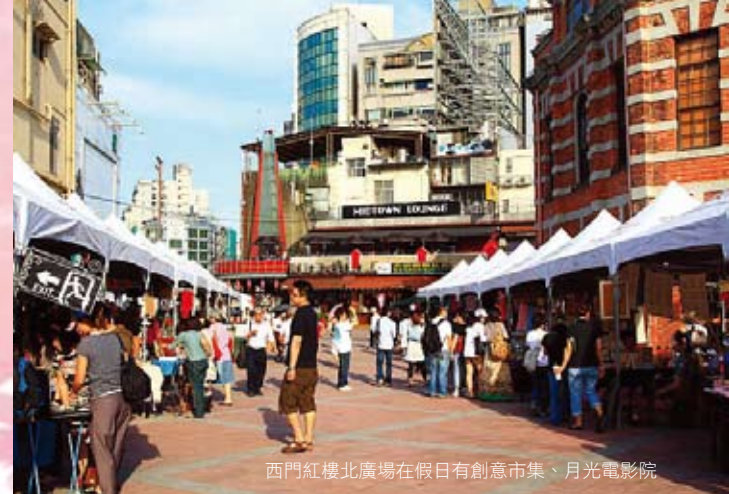
西門紅樓北廣場在假日有創意市集、月光電影院

位於西門紅樓後方十字樓內的 16 工房，是臺灣推廣文創產業的重要據點之一，近年來臺灣文創商品在國際發光發熱，並屢屢獲獎，也帶動年輕朋友投入文創工