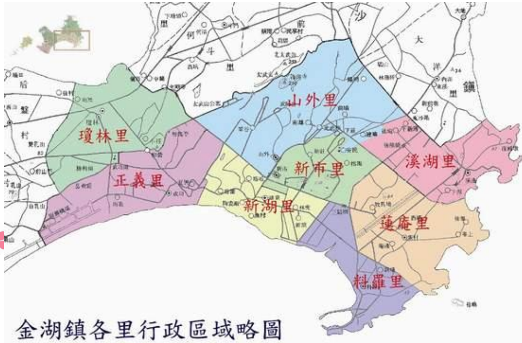
金湖鎮各里行政區域略圖

掩映於九重葛花叢中，屹立在木麻黃樹下，那段關乎國家存亡的時光，硝煙遍地的歲月，戰地的苦難與榮耀，完整地停留在這些防禦工事裡。