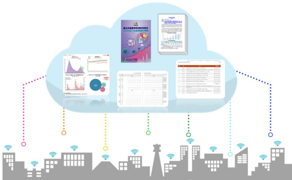
圖 1 臺北市 COVID-19 疫情統計專區一站式多元服務