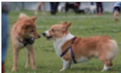
帶著狗狗出遊，可讓牠結交新朋友，增進「狗際關係」。

看KUMA開心玩耍一整天，周邊的人也感染了牠的幸福無憂。寵物的快樂是主人的財富，與其擔心狗狗在家太寂寞孤單，不如常帶牠出門走走。「沒事多溜狗，多溜狗沒事。」一點都沒錯。