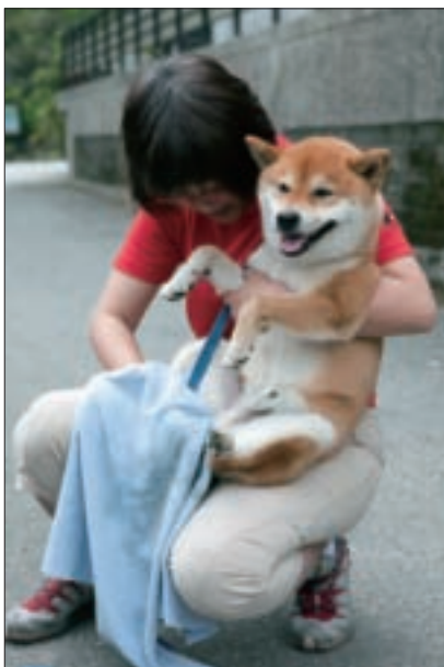
離開內溝溪前，記得先擦擦腳再前往下一站。

地點：塔悠路底，民權大橋下， 進入6號水門左轉到底 電話：8789-7158（臺北市動物保護處）