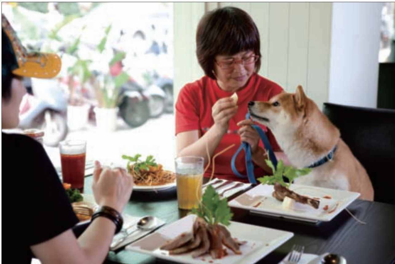
找間飼主可與寵物共享美食的餐廳，飽足一頓。

是否會過敏等問題，再決定菜色。狗狗主餐包括不添加任何調味料的碳烤羊排、爐烤鴨胸等，貓主食則有香煎魚排、碳烤雞腿排等，並搭配季節蔬菜，營養美味的程度，完全不亞於主人嘴裡的老墨嗆辣檸檬魚義大利麵、阿拉斯加鮮魚漢堡，而且用餐的地方可不是地板，而是與主人平起平坐的正式餐桌椅。