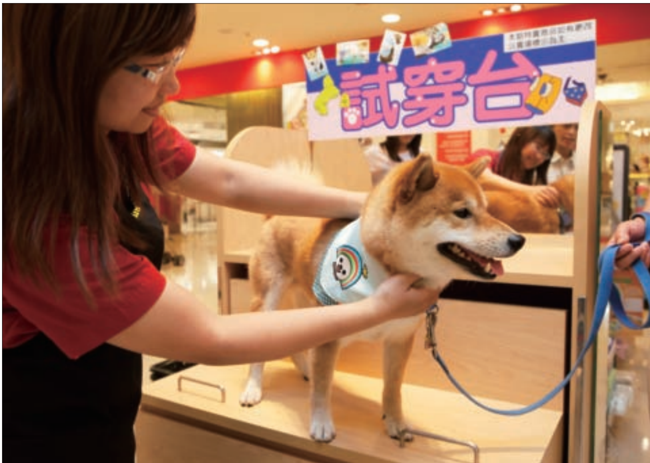
帶著狗狗前往寵物百貨採購各式造型行頭，飼主和狗兒皆開心。