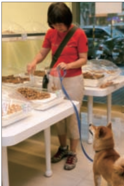
回家前別忘了買些點心，犒賞狗寶貝。