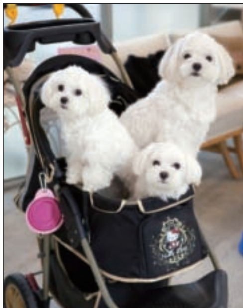
利用夏日，帶著狗兒們一同出遊吧！

主人和狗兒一起玩樂吃喝，看到狗狗得到充分的運動，甚至玩到高興累趴、一上車就睡翻，主人可是比什麼都滿足開心！