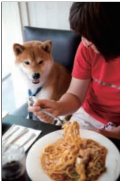
「口水快流出來了，好想吃呀！」

小狗，只有懶主人。」幫狗寶貝打理得人見人愛，對許多飼主來說，不只是滿足狗狗基本需求與顧及主人的面子，更是飼養寵物的一大樂趣。各式寵物專屬的美容造型、精品賣場因而誕生，產