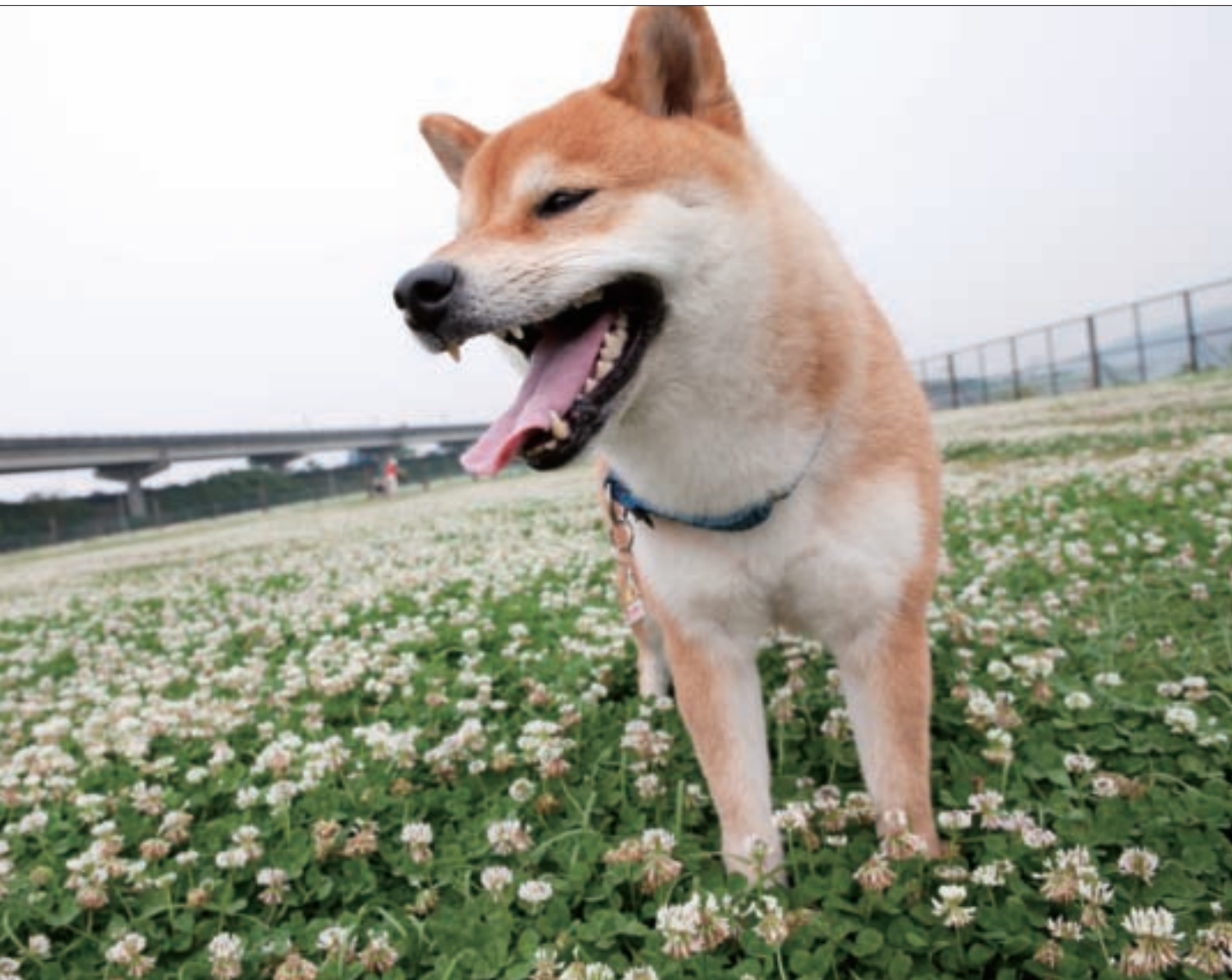
迎風狗運動公園園區寬廣，可放心鬆開狗狗的牽繩，讓牠在這裡盡情奔跑。

大狗區，以及柴犬、貴賓犬、瑪爾濟斯、長毛臘腸等小狗區，場地內設有狗攀爬板等狗狗遊樂設施，並提供狗便清潔便利設備及狗便袋，以及8座休息桌椅、洗手足台，玩髒了也能就近沖洗，乾淨清爽地繼續下一站的旅程，讓飼主們倍感窩心。