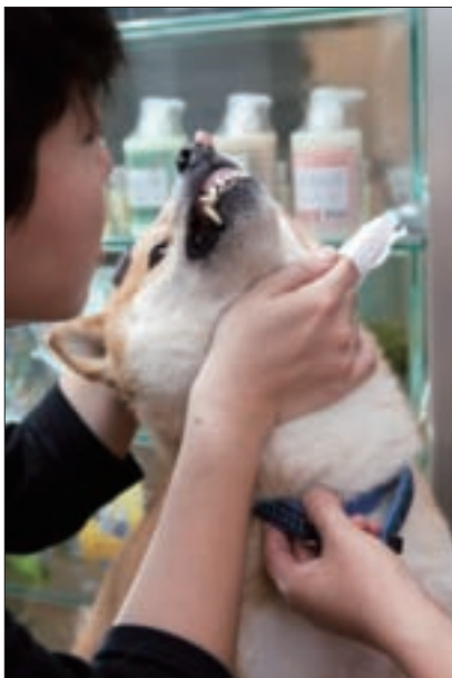
定期幫狗狗清理口腔是飼主的責任。