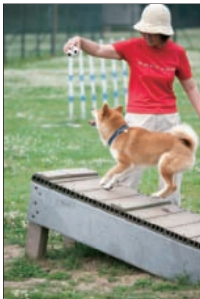
園區內設有攀爬板等狗狗遊樂設施。

在家只能侷限在客廳小跑步的KUMA，來到這裡充分發揮了百米戰將的功力，飛奔跳躍著追球、撿玩具，跑得一頭毛髮飛揚，真是英姿颯發！不過公園裡缺乏樹蔭，記得讓奔跑運動後的狗狗適時補充水分，以便及時散熱降溫，盡情玩耍。