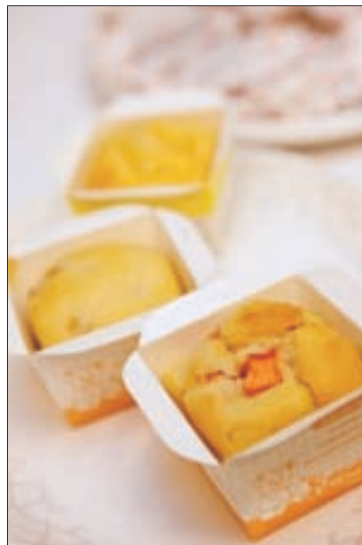
可口的馬芬，連飼主都想咬一口。

狗狗最好至少每一、兩個月就要進行一次全身SPA，透過按摩，除了可促進血液循環，也可順便檢查牠的身體有沒有出現異狀。