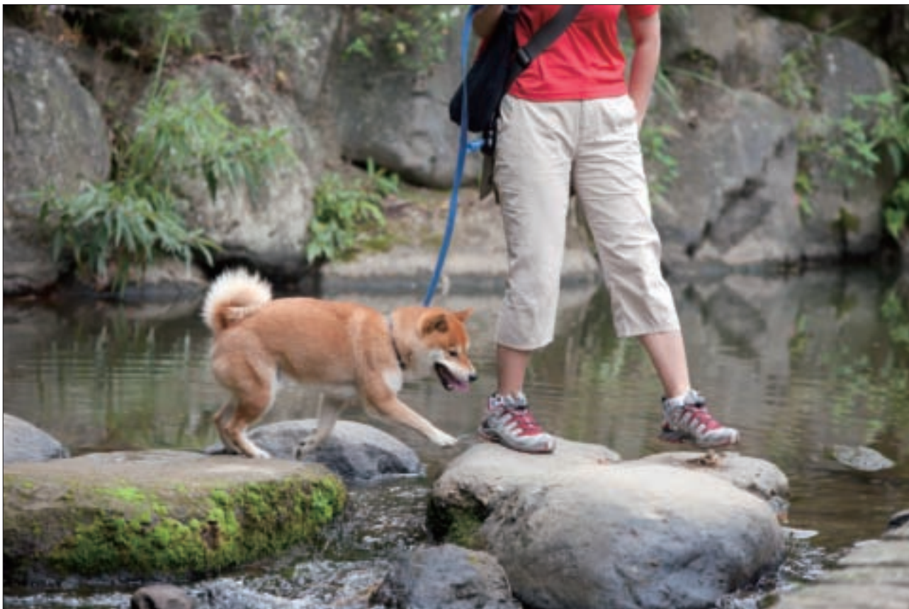
炎炎夏日，有著溪流與樹蔭的內溝溪，很適合帶著狗兒前來踏青戲水。