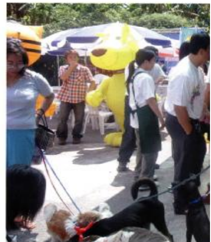
▲每週六不定期的志工遛狗活動。