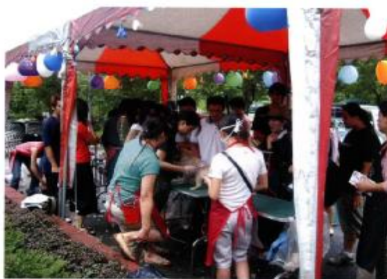
▲落實推動相關活動，提升市民對愛心犬的認知。

雖然二〇〇五年起，中央已開始著手針對公立收容所擬定組織章程，但我們由衷期盼早日完成，便於更有效管理以提升行政效能。而為符合全方位服務與唯客思維理念，自二〇〇一年一月份起，實施週休二日開放服務民眾，且延長愛心犬收容之法定期限為10日等措施，期能提高民眾認領養意願及本市愛心犬貓的認領養比率。至於目前經營現況茲分如下：