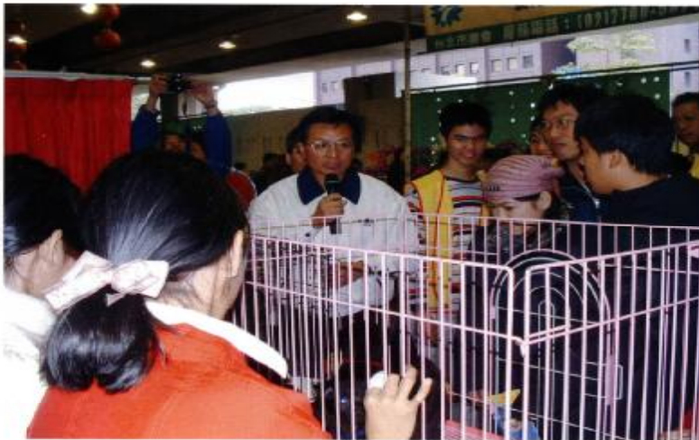
92 | 臺北縣經季刊 |

於二〇〇三至二〇〇五年間，為提升收容動物與人之互動關係，於每周六不定期辦理志工遛狗活動(如下圖)，期間辦理共計 48 場，參加人次約 260 人次，