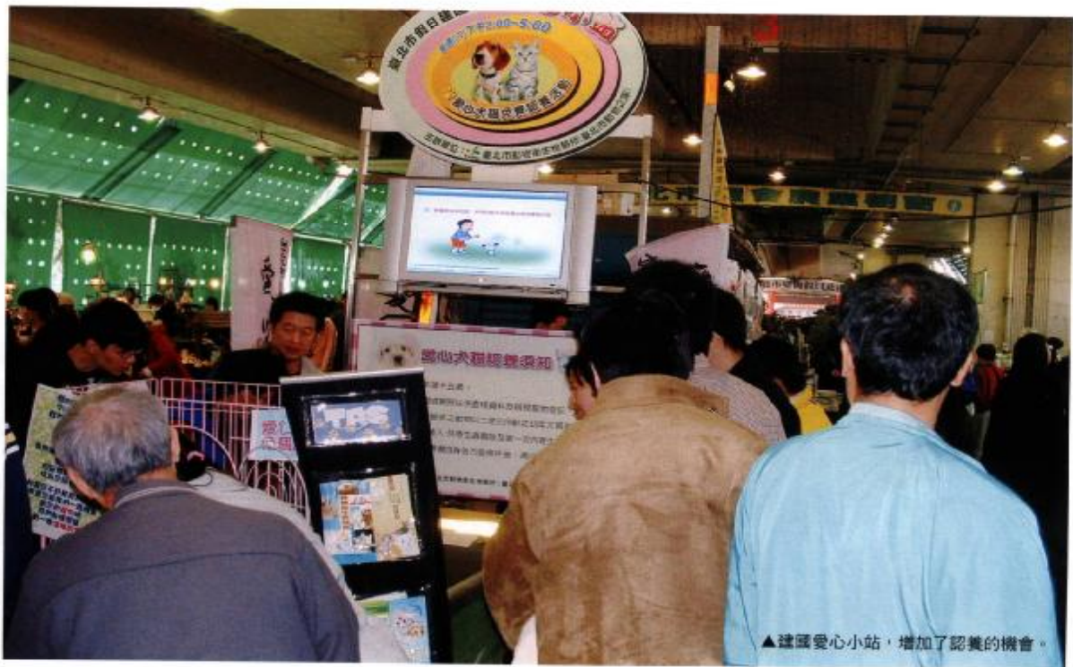
▲建國愛心小站，增加了認養的機會。

自一九九九年末起，臺北市政府建設局所屬臺北市動物衛生檢驗所為了能夠增加收容動物的認養機會，