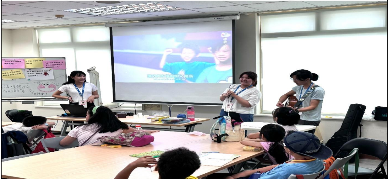
113年7月3日本中心偕同大安婦女中心舉辦兒童周末營隊，圖為參與暑期兒童營的小隊員們學習營隊歌曲。