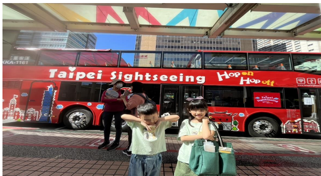
(上圖)113年7月9日本中心服務家庭參加雙層巴士觀光活動照片。