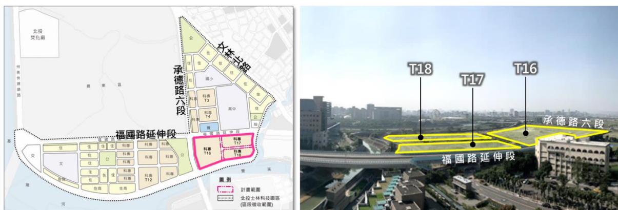
圖 2 T16、T17、T18 基地位置圖