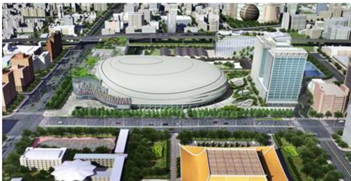
大巨蛋開發案園區鳥瞰圖

「臺北文化體育園區—大型室內體育館開發計畫案」（以下簡稱大巨蛋開發案）係本府於 95 年 10 月 3 日簽約委由遠雄巨蛋事業股份有限公司（以下簡稱遠雄巨蛋公司）辦理之 BOT 性質標案，計畫興建 4 萬觀眾席位之室內多功能體育館及商場等附屬事業（以下統稱大巨蛋）。鳥瞰圖如下：