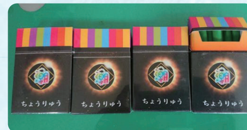
創新的設計 吸引少年