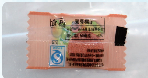
糖果的誘惑 滲入毒品