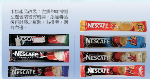
包裝重新封膜 以假亂真

新型態毒品對少年的危害除了以重新封膜或山寨包裝、混搭食物及創新造型吸引少年，其內容物更是以三級毒品K他命、喵喵、二級毒品搖頭丸、安非他命、大麻、一級毒品海洛因等混合使用，像是毒咖啡包內可能同時含有中樞神經抑制劑與興奮劑，且其劑量不明加上個人體質差異，若貿然使用易產生嚴重後遺症，甚至因而死亡。以下圖示為例，建議家長帶領孩子認識目前新型態毒品樣態，提高警覺他人給予物品。