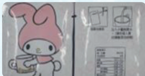
山寨版包裝 魚目混珠