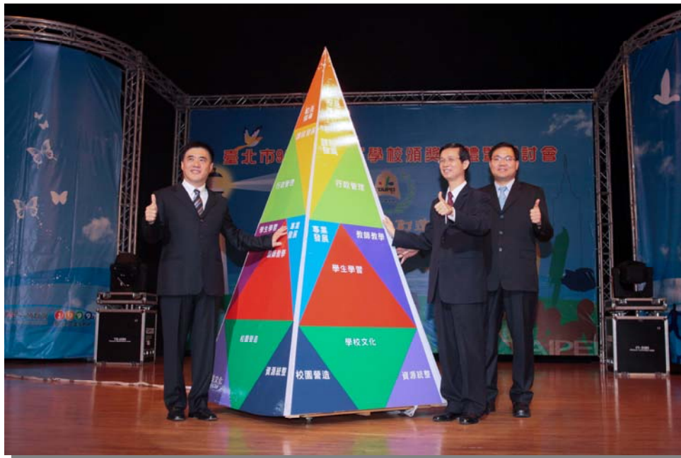
優質學校活動評選頒獎典禮