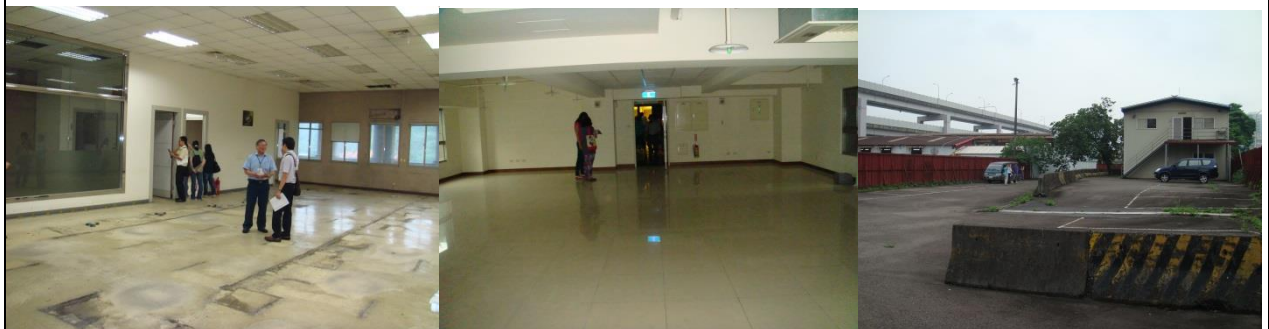
松德大樓 8 樓

查本市公共運輸處經管本市松德大樓 8 樓部分空間、梵帝崗大樓 3 樓部分空間及南港區重陽路 297 號等 3 處市有房地，因管理機關已無使用需求，為市產統籌調度利用及有效使用，前經本局依「臺北市政府各機關學校提報公用房地需求列管計畫」，徵詢列管機關使用需求，計有捷運工程局東區工程處等機關提出公務需求。又為現場瞭解上開市有房地使用現況及提報需求機關目前空間使用情形，本局業於 104 年 6 月 4 日辦理現場會勘，實際瞭解各機關空間使用情形，後續將擇期召開「本府各機關學校經管閒置建物處理情形第 12 次研商會議」，透過市有房地統籌分配運用，提升市有財產效益。