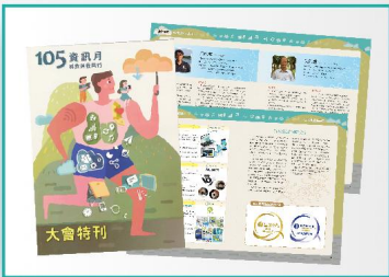
資訊月大會特刊 得獎者介紹/百大創新產品介紹/資訊月記者會/頒獎典禮發送