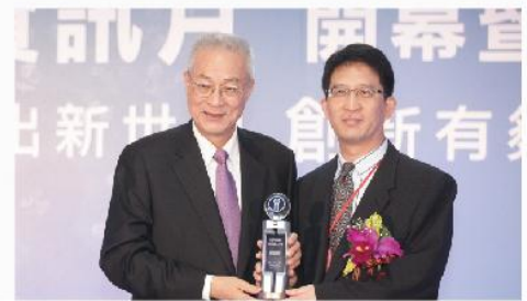
歷年政府首長蒞臨頒獎・授予至高榮耀