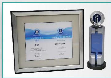
獎座及中英文證書 傑出資訊人才與百大創新金質獎頒發得獎獎座及中英文證書，象徵最高榮譽證明