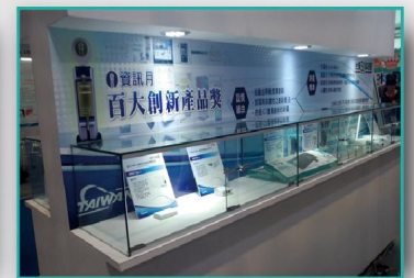
不定期海內外展示 透過不定期海內外展示，協助得獎產品推廣拓銷，並使得獎單位備感尊榮