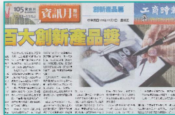
媒體專題報導 虛實媒體曝光宣傳