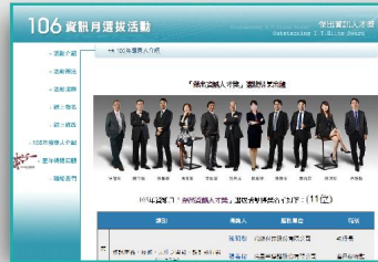
資訊月活動網站宣傳 透過資訊月網站專屬網頁宣傳得獎事蹟，提供得獎單位網頁連結