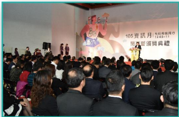
頒獎典禮 萬眾矚目，榮耀加勉