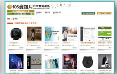
線上媒合平台網站宣傳 百大創新產品線上媒合平台，所有獲獎產品可無限期展示，隨時更新產品介紹