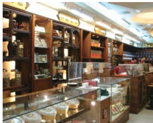
▲ 位於迪化街上的「漢補世家」是美輪美奐的新世代中藥行。

除了外在的行銷，企業的經營管理也很重要。從藥材的整理乃至抓藥、煎藥的流程，藥行都訂定標準化的作業規範，嚴格要求每一關都需有確認的程序，以確保送至客人手上的藥材都是正確、品質佳的。廣生堂甚至還投資了一整套企業E化的系統，只要是外縣市或是無法親自監督製藥過程的顧客，對於藥材處理過程有疑慮，可以透過店家提供的IP位址，上網即時監看整個抓藥、切片、煎藥、包裝的過程。透明化的過程就是要讓顧客買得安心、吃得放心。