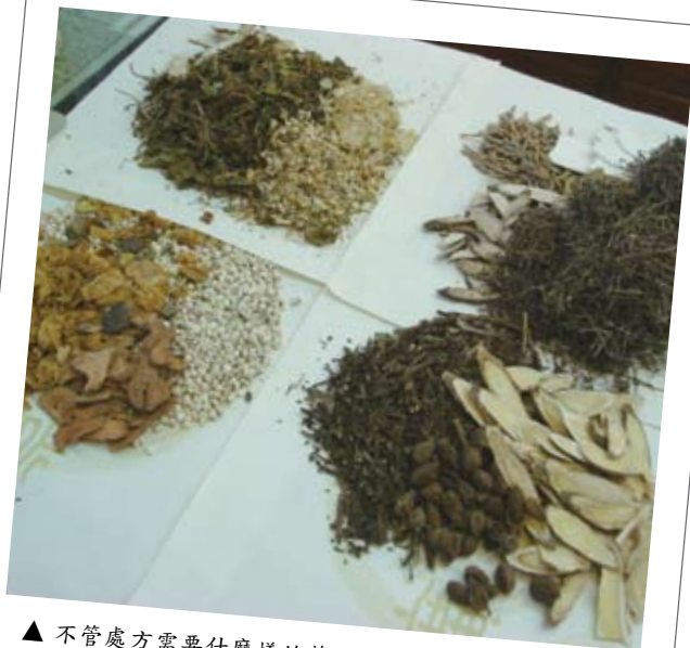
▲ 不管處方需要什麼樣的藥材，在首善之都的臺北市都找得到齊備的藥材。

由於早先未開放兩岸通商，臺灣的中藥進口商無法到中國大陸選貨採購，多是透過香港的仲介商代為採買。現今雖然開放通商，只要走一趟廣東的藥材集散地，就可以找到東北、新疆、內蒙各地的藥材，但由於許多市場個體戶經營的品質良莠不齊，為避免不必要的時間與金錢花費，臺灣的進口商還是會透過有多年合作默契的