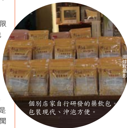
個別店家自行研發的藥飲包。包裝現代、沖泡方便。

另外，養生藥包的種類不同，如何挑選適合自己體質的藥包服用呢？當然必須請中藥專業人士，根據個人體質調配，並且順應節氣進食、進補方是養生的不二法門。台北市中藥商業同業公會為推廣中藥養生保健的觀念，不僅全力支持「中藥全國聯合會」所出版的《元氣藥膳》、《快樂藥膳》等食譜，提供民眾四季應時養生的參考，並號召成立臺北市中藥養生推廣聯盟，民眾只要挑選張貼有養生推廣聯盟標章的店家，便能得到完整的養生諮詢服務，無論是對藥材安全選購有疑慮，或是想嘗試更多新搭配養生藥飲包的消費者，「臺北市中藥養生推廣聯盟」，都是您的不二選擇！