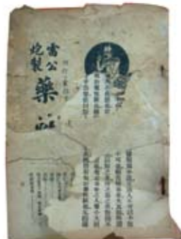
▲ 已經使用到斑駁的《雷公藥性賦》。