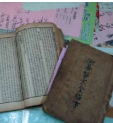
▲ 正統的藥師訓練仍以古教材為主桌。