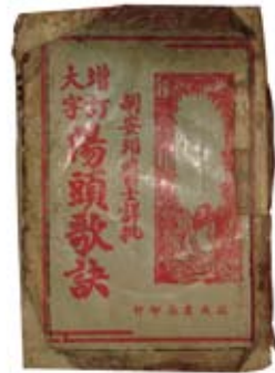
▲ 幾乎是代代相傳的方劑學教材《湯頭歌訣》。