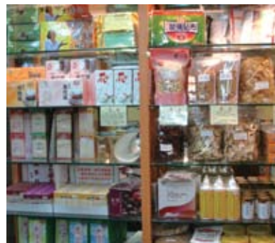
▲ 整齊、明亮的開架式陳列，方便客人選取商品。

以往中藥行的經營多建立在老闆的人際關係上，如果老闆不在，顧客購買的意願便會大幅降低。因此，漢補世家、廣生堂都採取建立品牌的策略來調整經營方向。品牌的建立並非一蹴可幾，而是一點一滴的累積，例如：架設專屬網站主動與E世代的消費者接觸；清楚標示產品說明及價目方便顧客自行選購；發送簡訊或DM促銷廣告提升來客率；提供宅配貨到付款的服務開闢外縣市客源……慢慢形塑出新世代中藥行現代化的品牌形象。