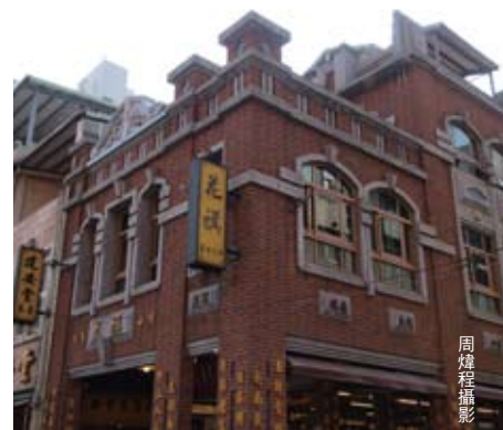
▲ 新世代經營的中藥行，最創新的重要建築美學。