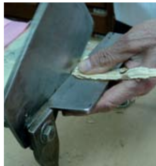
▲ 老師傅才上手的用小南剪刀切藥材。

傳統養成教育上，曾流行風靡藥界的一首順口溜：「飲片（藥材片）切制過程潤藥得當、洗藥靈活、擅長切制、鬼斧神工、藥材形態各異，白芍、白芷、圓片，黃柏、杜仲、葛根、骨牌片，黃耆、甘草、斜片，白朮、直片，厚朴、肉桂、肚片，切制飲片長短適當，厚薄均勻，粗細適當，白芍飛上天，檳榔不見邊，陳皮一條線，半