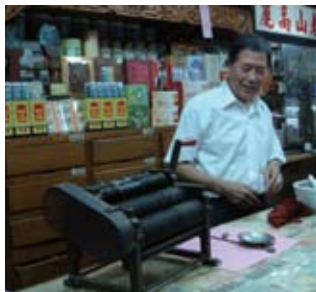
▲ 中藥行遵古法製作藥丸的機器。