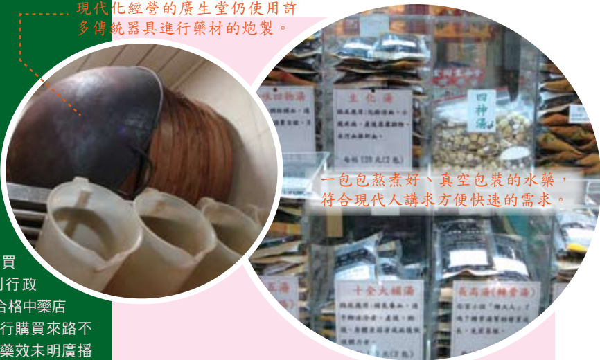
一包包熬煮好、真空包裝的水藥，符合現代人講求方便快速的需求。

傳統煎藥與科學中藥在製程上最大的差異在於「浸膏賦型」的工序。由於製作成本的考量，大部分的科學中藥多是採添加澱粉等賦型劑的製程，因此也常被質疑服用科學中藥的效用未如預期，是因為賦型劑的緣故。