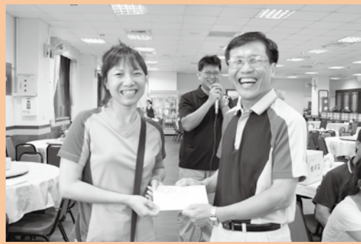
校內活動摸彩得獎