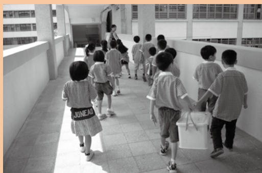
推動閱讀帶領班上學生借書共讀