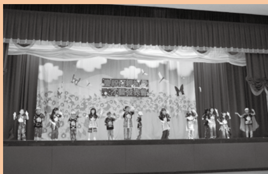
為學生編舞班級獲選母親節才藝表演演出