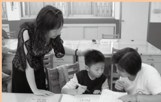
陪學生參加校內晨光英語檢定

總之，她帶著溫暖且甜美的笑容贏得每位被她教過學生的心，那是因為滿滿的「教育愛」。