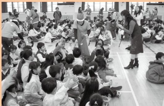
家長會發禮物為學生攝影

而這位學生從一開始上課猶如是「客人」，到慢慢可以參與上課；從不願意乖乖配合參加考試，到可以願意好好配合寫完考卷；以及在班級中受到全體同學的良好照顧，讓這位學生每天上學都是帶著快樂的心來到學校，其中一點一滴的進步，該學生家長最能體會。他能有好的表現，除了成