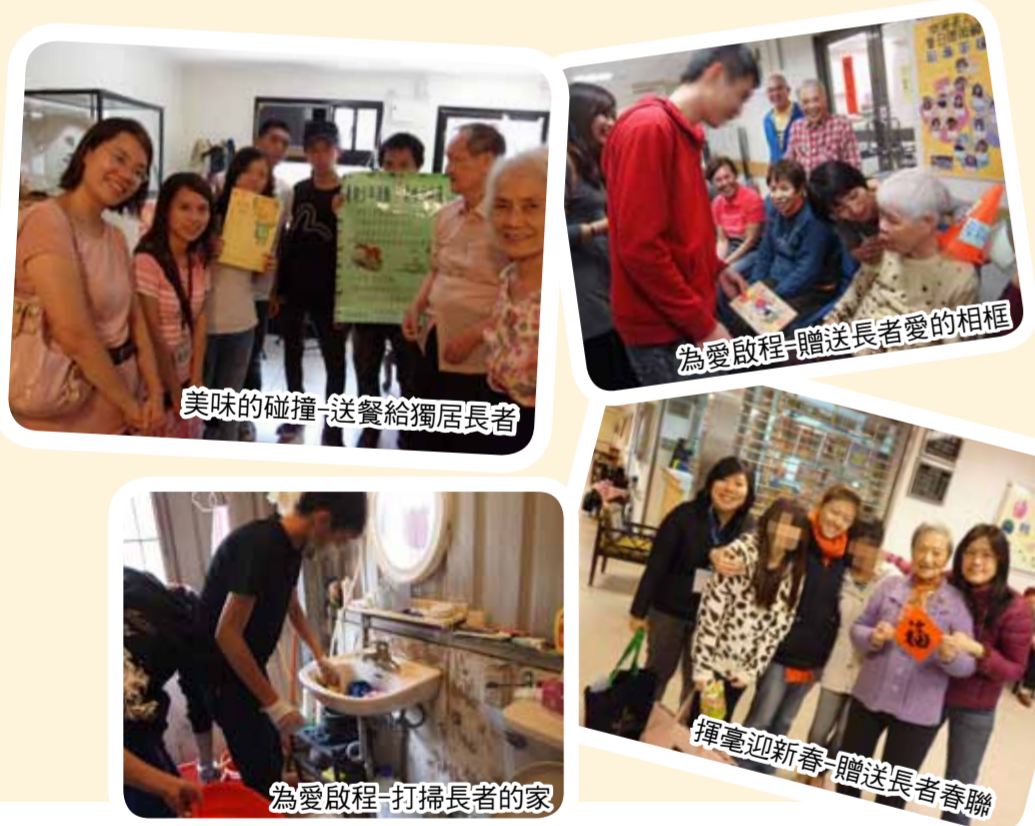
美味的碰撞-送餐給獨居長者

社會中處處是散播愛的地方，我們要先愛孩子，他們才有能量去愛別人，讓我們帶著少年一起愛飛翔，去探索生活周圍適合且能參與的公益服務，使少年從實際體驗中累積無價的寶藏！