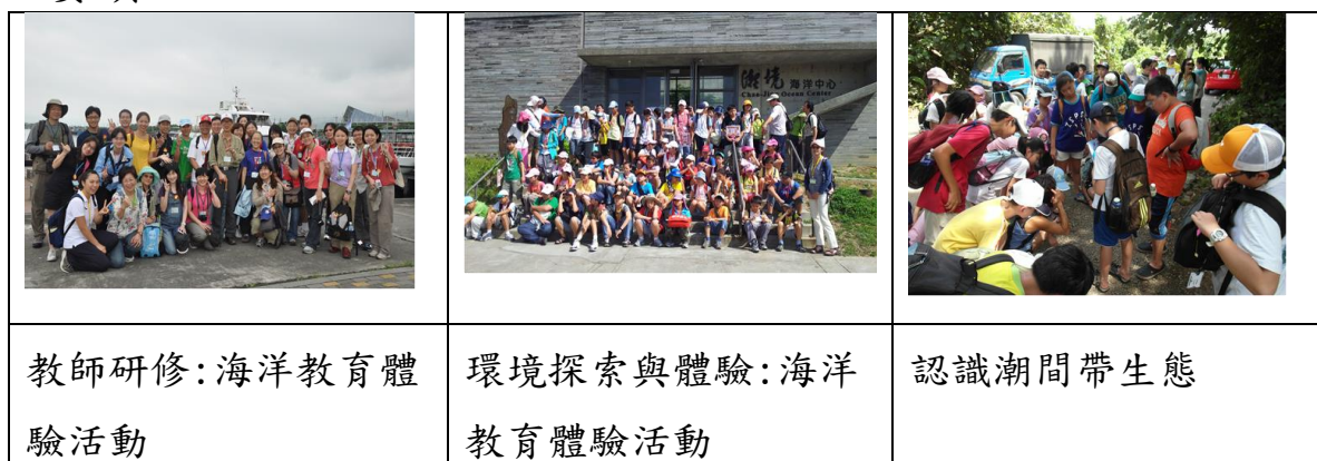
圖 2:環境教育辦理情形

(2) 社子國小辦理「國家防災日地震避難疏散演練」，馬總統、內政部李部長、教育部蔣部長、郝市長等長官全程出席該活動，宣導在地震發生時適合與正確的避難掩護動作及要領。