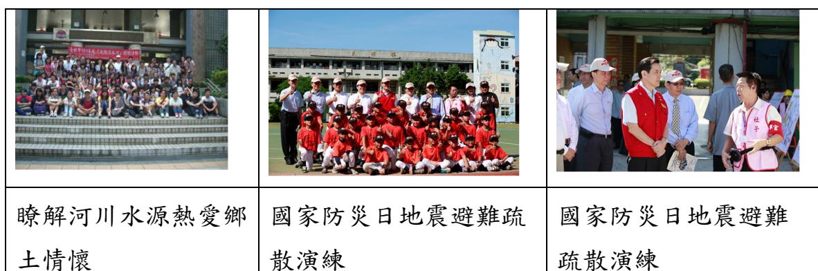
圖 3:國家防災日教育地震避難疏散演練

6. 推動雨水回收系統及建置透水性鋪面：持續推動雨水回收系統及透水性鋪面建置，本期完成萬福國小等 31 校，藉由生態工法及綠化，持續建構一個省水保水及綠化的永續校園環境，同時也結合教學課程，藉由學生或民眾與環境互動，落實環境教育的功能。