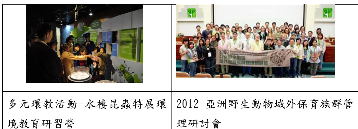
圖 4: 動物園展覽與研習活動

作為推動國內外動物園合作保育行動計畫，共同維持域外野生動物族群的存續經營，101 年度辦理野生動物域外保育族群管理系列國際會議。6 月辦理「2012 教育展示與物種存續研討會」，國內、歐美與東南亞地區動物園相關組織等，共有 35 個單位、約 150 餘人與會。9 月辦理「馬來長吻鱷族群管理與展示工作坊」，邀請美國、西班牙、香港、新加坡共 6 位專家學者來臺，內容以馬來長吻鱷族群管理與展示為主軸，涵蓋圈養繁殖、血統書管理和醫療等議題。與會者來自學術單位、教育單位、民間社團等，國內外共計 100 餘人參與。11 月辦理「2012 亞洲野生動物域外保育族群管理研討會」，分為族群管理訓練工作坊、族群管理及區域性物種保育計畫研討兩階段議程。藉由國際自然保育聯盟（IUCN）保育繁殖專家群（CBSG）指導之族群管理訓練課程，整合亞洲地區（日本、新加坡、香港、泰國、印尼）13 種受威脅性物種及臺灣本土保育類物種名單血統書評估與建置，凝聚亞洲區域性物種合作計畫共識；亞洲各重要動物園的代表也透過研討會議分享物種保育經驗及具體討論與臺灣地區目標物種的保育整合計畫。動物園以前瞻性的模式，從族群管理技術基礎建立到實際整合規劃，共同為全球野生動物保育及域外族群的永續而努力。