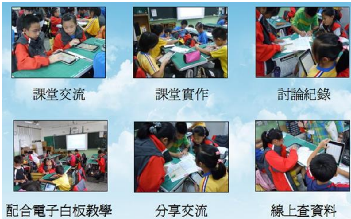
圖 1：臺北市行動學習實驗計畫辦理情形