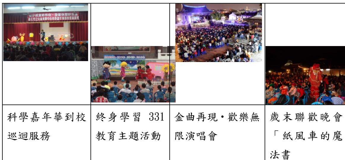
圖 6：臺北市立兒童育樂中心推廣活動