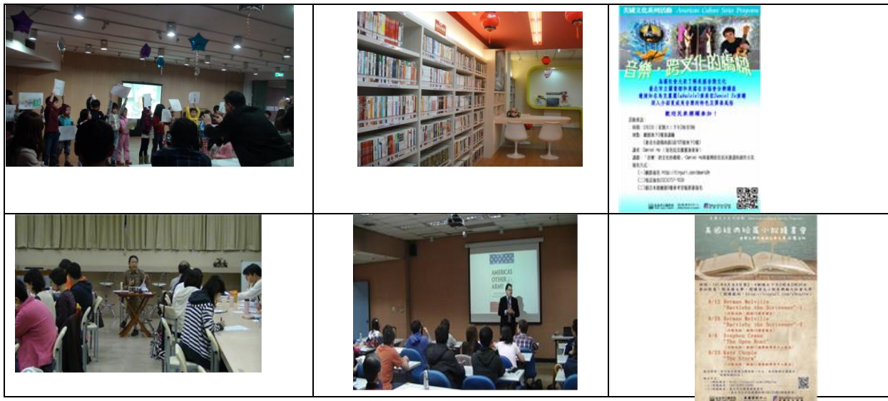
圖 5:臺北市立圖書館活動照片與海報文宣