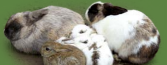
穴兔是各種家兔品種的祖先