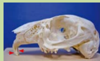
臺灣野兔有2對前後並排的上門齒