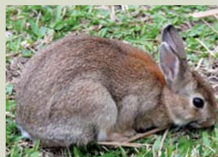
兔子是典型的草食性哺乳動物