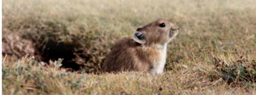
黑唇鼠兔可算是狡兔三窟的代表

提醒人隨時都要有周密的避禍之策，才不會陷入絕境，後人引申為做事留有餘地，進可攻，退可守。