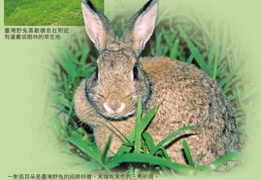
一對長耳朵是臺灣野兔的招牌特徵，末端有黑色的三角形斑。

臺灣目前普遍的農墾地及牧場草地，如今已是臺灣野兔賴以為生的重要生活環境，然而筆者在研究期間經常遇到人類不定期的整地、噴灑殺草劑等農耕措施，以及對野兔毫無限制的濫捕行為，經由現況調查的經驗顯示，臺灣野兔並不若以往那麼容易發現或目擊。瞭解本土物種的基本生物學資料，不僅可以健全臺灣的生物多樣性，也可作為未來物種保育及經營管理之參考。否則，由普遍分布到瀕臨絕種將是臺灣野兔不可避免的宿命。