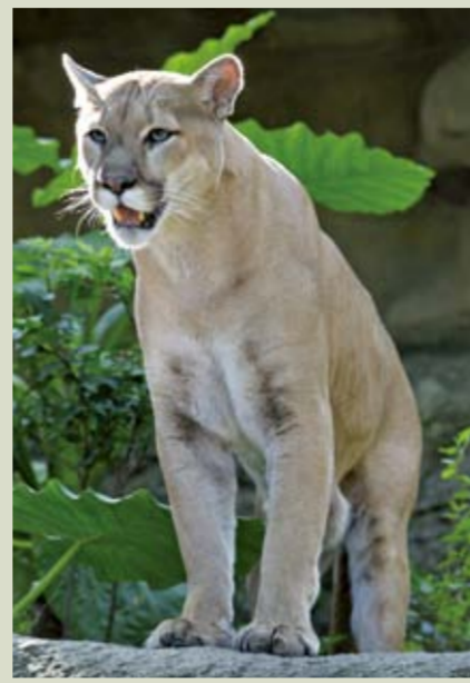
美洲獅是美洲地區野兔的主要天敵之一