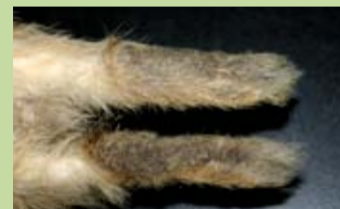
臺灣野兔的後腳掌及趾墊間有毛髮覆蓋