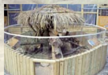
To兔樂園戶外活動場

雖然兔子經過了長時間人為的育種和改良，已變得適合一般人飼養，但是牠原有的野性與本能並未消失，透過適當的飼養環境和正確的餵食，你也可以讓家中的兔子生活的健康又有活力喔！現在，就讓我們一起來認識這個可愛又迷人的動物吧！