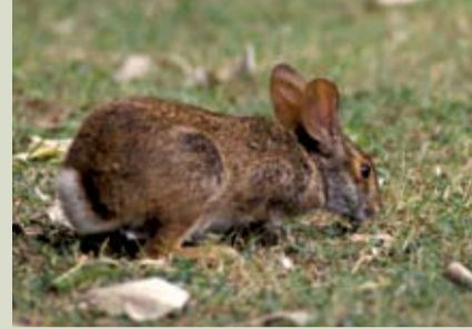
美東棉尾兔是北美洲最常見的兔子