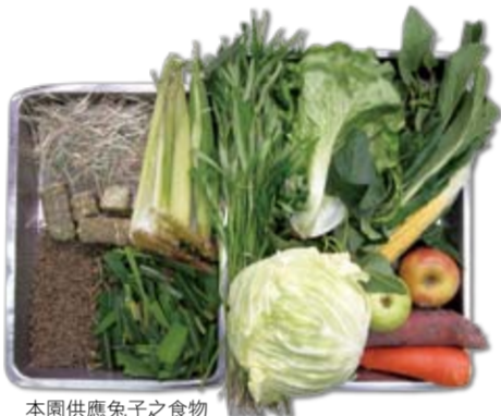
本園供應兔子之食物

因兔子屬於草食動物，營養來源主要是分解植物之營養及盲腸微生物發酵後之產物為主，因此本園飼養兔子所供應的食物包括：草料類為：切碎青牧草、乾草、草塊、玉米穗外葉等可提供粗糙之高纖食物，新鮮蔬菜有地瓜葉、空心菜、萵苣、油菜、甘藍菜及玉米等，根莖類包括地瓜及紅蘿蔔，並提供少量水果蘋果及芭樂，另外供應兔料及苜蓿草粒等以確保蛋白質及能量供應充足。其中青料及草料所佔比率約為百分之70至80，乾粒料所佔比率約為百分之20至30。兔子食物中所提供之主要營養有：纖維素、蛋白質、碳水化合物、維生素和礦物質；其中，最重要的是纖維素。