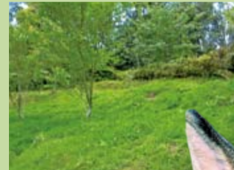
臺灣野兔喜歡棲息在附近有灌叢或樹林的草地

臺灣野兔長耳朵的末端有塊黑色的三角形斑，眼睛大而圓，顏色為黃褐色。相對於其他的野兔，臺灣野兔的體型較小，耳朵及尾巴亦為最短；成體的臺灣野兔體重僅1-2公斤、身長31-39公分、耳長6-7公分。