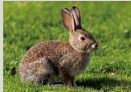
沙漠棉尾兔是美國西部乾燥地區的種類