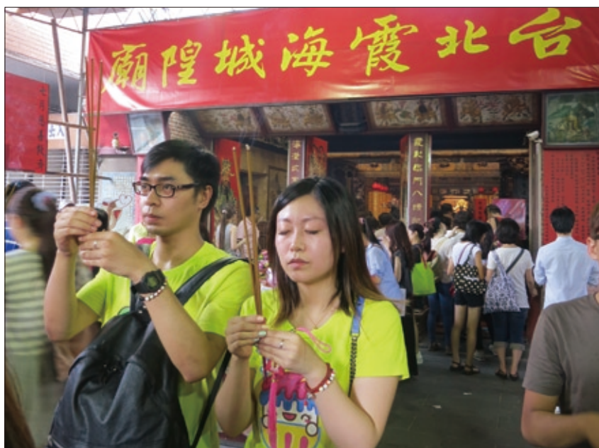
上海小情侶藉著七夕，特地到城隍廟還願，祈求甜蜜幸福一輩子。

提包，緊急告知站務人員後，發現包包被原封不動的送回車站，臺灣人的守法，以及處事效率之高，讓她永生難忘。