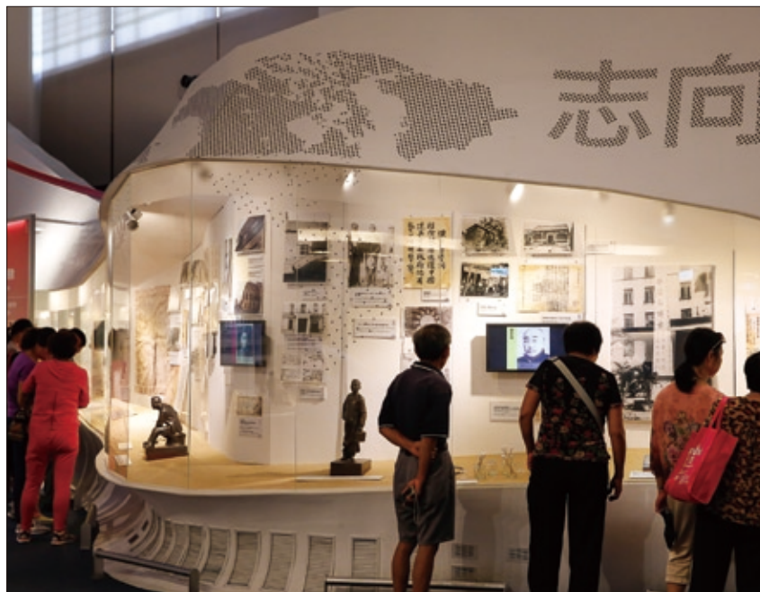
國父紀念館展示著國父革命建國相關的歷史文物，意義非凡。

寸土寸金的東區卻也扮演起同樣親近自然、展演藝術的城市公園角色，是臺北人運動休閒、生活漫步、生態觀察、參與藝術人文