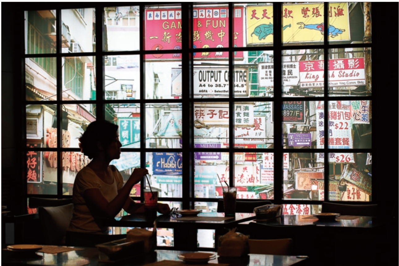
金鐘香港茶餐廳的裝潢與餐點，有著道地的廣東風味。

的去處之一。而對於近年蜂擁而至的大陸港澳觀光客來說，正因為兩岸三地對孫先生在政治歷史上的定位各自解讀不同，因此來臺灣一睹國父革命相關史蹟文物更顯出意義非凡，除了初識臺灣獨特的政治文化、歷史氛圍之外，也能在此一窺臺北人的生活種種，體驗沒有一絲絲政治味、日常的臺北風情。