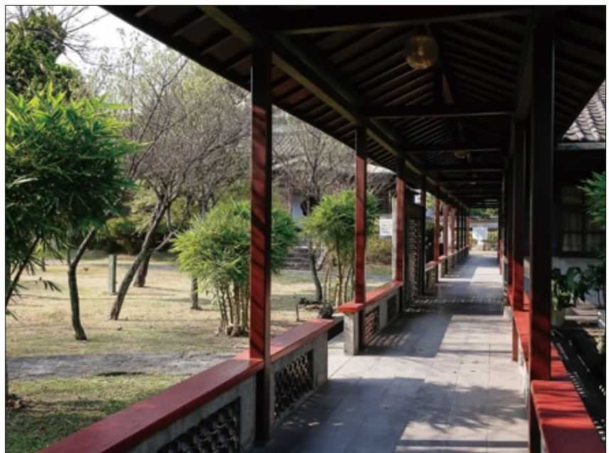
國父史蹟館屋外公園花木扶疏，營造出柳暗花明的造景巧思。

「屋敷」在日語中是高級住宅之意，當時「梅屋敷」是臺北相當高級的旅社，僅存的這間日式客房屋頂覆蓋著老式暗黑色瓦片，屋簷與雨淋板緊密結合，整體採坐北朝南、呈東西走向的長方形設計，總面積大約五十坪左右，房內的擺設保留了當年孫先生到訪時的原貌，屏風、茶几依舊在，牆上高掛著當年手書送給旅館主人人大和宗吉的「博愛」橫幅字畫，一旁則是孫先生於民國9年在舊金山《少年中國晨報》時使用過的辦公桌椅，走過那段風雨飄搖、動盪不安的大時代，如今這份安穩沉靜叫人好生珍惜。屋外公園也值得走走，涼亭、小丘布置精心、作工考究，營造步