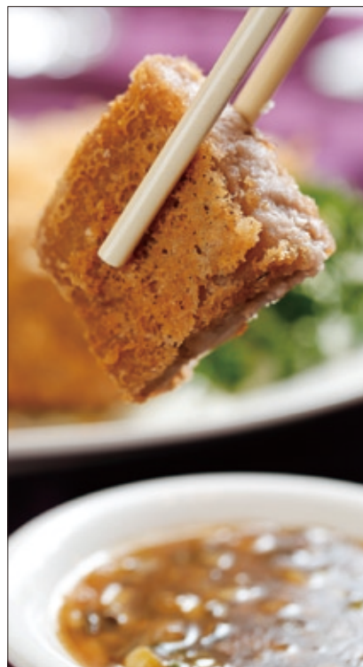
芋泥鴨先以全鴨過油去骨除腥，再裹上細緻芋泥，口感豐腴。

眾所皆知國父孫中山是政治家、革命先行者，但可別忘記他也是位出色的醫生，在忙碌之餘也十分注重養生，早在百年前便提倡原味蔬食理念，尤其對豆腐推崇備至。他的家鄉中國廣東省翠亨村是個依山傍海的小村莊，村民善吃海鮮，並擅長以鹽來醃漬海魚，這種醃漬鹹魚被美食家稱為「中國菜鹹鮮食材之最」。盛傳孫先生不僅愛豆腐，尤其喜愛以鹹魚烹調的豆腐料理。事實上，「鹹魚雞粒豆腐煲」也是全世界廣東館子常見的一道經典煲仔菜。