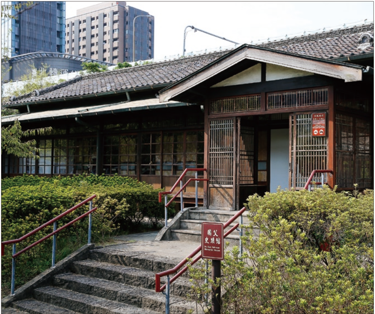
日據時期，這棟由日本人建造的日式旅館「梅屋敷」，是百年前臺北的高級旅社。

「屋敷」在日語中是高級住宅之意，當時「梅屋敷」是臺北相當高級的旅社，僅存的這間日式客房屋頂覆蓋著老式暗黑色瓦片，屋簷與雨淋板緊密結合，整體採坐北朝南、呈東西走向的長方形設計，總面積大約五十坪左右，房內的擺設保留了當年孫先生到訪時的原貌，屏風、茶几依舊在，牆上高掛著當年手書送給旅館主人人大和宗吉的「博愛」橫幅字畫，一旁則是孫先生於民國9年在舊金山《少年中國晨報》時使用過的辦公桌椅，走過那段風雨飄搖、動盪不安的大時代，如今這份安穩沉靜叫人好生珍惜。屋外公園也值得走走，涼亭、小丘布置精心、作工考究，營造步