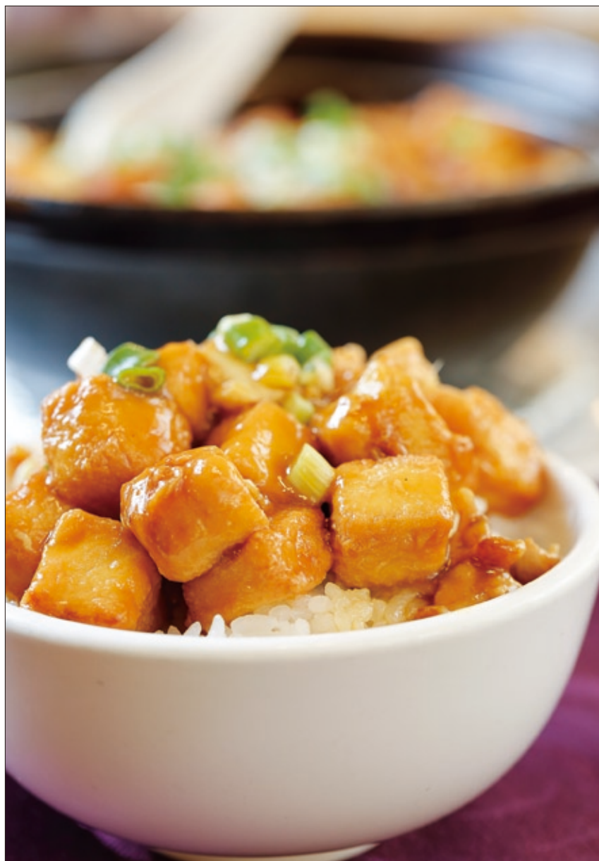
鹹魚雞粒豆腐煲香氣逼人，配起白飯，簡直人間美味。

國父史蹟館位於御成町（今中山北路、北平西路交叉口），原是日本人大和宗吉、藤井晤一郎經營的旅館「梅屋敷」的一幢客房。孫先生於民國2年來臺時曾在此下榻，居留僅短短數日，隨即趕往基隆港搭船赴日，繼續籌劃討袁大計。