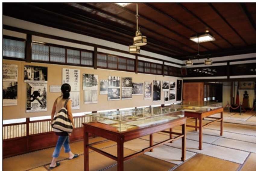
國父史蹟館內保留了孫中山先生當年造訪時的原貌。