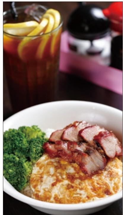
因電影一炮而紅的食神銷魂飯，厚實軟Q的甜叉燒實在好味。

追隨孫先生這位百年不敗的偶像吃喝玩耍，以國父之名的一日旅行一點也不嚴肅。何需等假期？現在就出發！