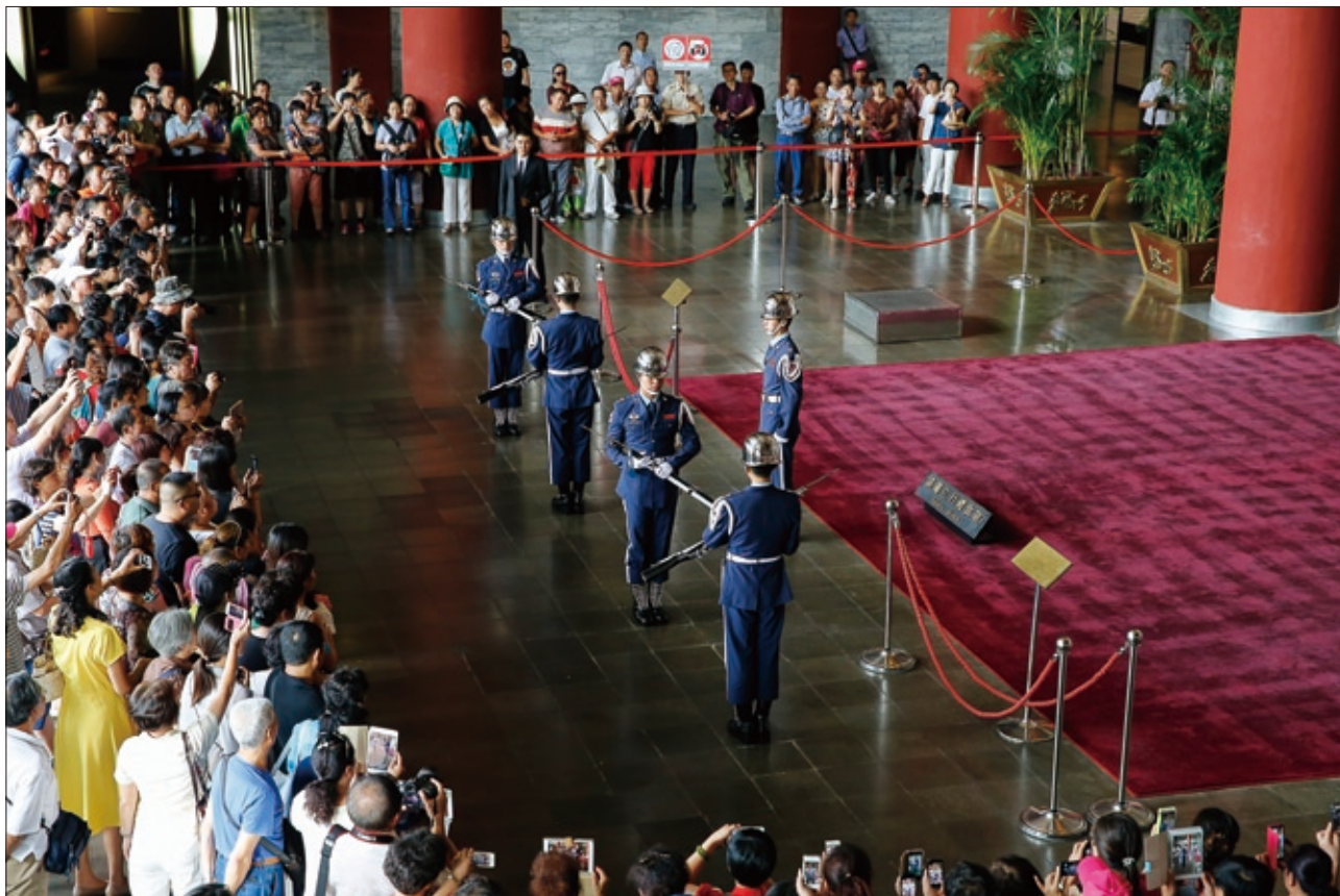
國父紀念館每到整點禮兵交接時，總是吸引大批遊客觀禮。

移景異、柳暗花明的造景巧思；花木扶疏，碧塘游魚，則充滿了名流旅店悠閒雅逸的生活韻味。