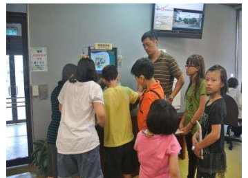
大同分館-讀者服務特色圖書館

大同分館榮獲 102 年教育部全國公共圖書館評鑑特色圖書館—讀者服務獎。大同分館營運規劃具體且有成效，由於服務讀者類型多元，為能提供讀者各項便利服務措施，分析在地讀者特性，規劃適切之服務與活動；並配合鄰近之臺北市立啟聰學校，蒐藏聽障相關書籍，且與學校合作辦理聽障閱讀推廣活動；另為服務高齡讀者，設置樂齡學習中心，規劃課程、採購大字書、運用長者志工，為各類讀者提供全方位的服務。