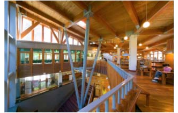
北投分館-建築空間特色圖書館

北投分館榮獲教育部全國公共圖書館評鑑特色圖書館—建築空間獎。此獎項除代表該館在營運績效的表現上維持一定的高水準外，其具指標性的鑽石級綠建築特色亦獲高度肯定。北投分館利用自然採光、高低窗設計，輔助構造物引導氣流；此外，利用斜屋頂草坡自然排水至雨水回收槽，以澆灌植栽及沖廁。而為了不遮蔽室外的綠意，書庫區的書架高度設計為 110 公分，在任何閱讀角落皆可透過大片開窗，享受生態環境豐富的北投公園。