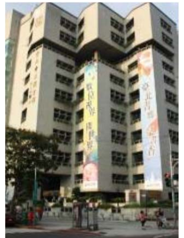
北市圖-年度圖書館暨數位服務特色圖書館

總館榮獲教育部全國公共圖書館評鑑特色圖書館—數位服務獎。因應數位化時代，廣徵電子資源，提供各項數位化服務，包含：電子資源整合查詢系統、數位典藏系統、兒童電子圖書館、數位影音借閱平臺、電子書服務等，讓讀者可於任何地方、任何時間，透過網路下載各種多媒體資料，方便獲取所需的數位資源。