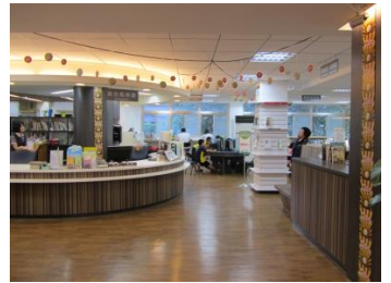
景美分館-閱讀推廣特色圖書館

景美分館榮獲教育部 102 年度全國公共圖書館評鑑特色圖書館—閱讀推廣獎。景美分館積極辦理各項多樣化推廣活動，以推展圖書館利用、提升社區閱讀風氣。景美分館為促進讀者善用圖書館，辦理包括圖書館利用教育、閱讀推廣及藝文等相關活動，另外，為加強社區參與度，邀請社區專業人士辦理講座，並將圖書推廣至學校，有效結合社區及學校資源，為讀者提供更多的加值服務。