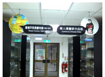
中崙分館-館藏資源特色圖書館

中崙分館榮獲教育部 102 年度全國公共圖書館評鑑特色圖書館—館藏資源獎。中崙分館以漫畫為特藏，目前約有 8 萬多冊，舉凡與漫畫相關之圖書、參考書、期刊、視聽資料、國立編譯館漫畫審查時期之臺灣本土漫畫著作等皆在典藏之列，每年約有 16 萬餘冊借閱量，居全館館藏特色圖書借閱量之冠。漫畫圖書皆落實分級閱覽制度，分為普遍級、輔導級及限制級，並依內容規劃 12 個主題區域陳列，更為推動漫畫教育，定期辦理漫畫研習課程、比賽活動、講座及讀書會等活動，不僅提供漫畫愛好者揮灑創意的園地，亦多元培育漫畫閱讀教育的種子。