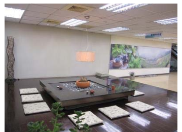
文山分館-品質管理特色圖書館

文山分館榮獲教育部 102 年度全國公共圖書館評鑑特色圖書館—品質管理獎。文山分館為維護並確保服務品質，將標準化作業充分落實於各項業務及服務中。以茶藝為特色館藏的文山分館，開館迄今，重視各年齡層的閱讀權利，每年皆積極爭取中央及社區資源推展各型態的閱讀活動，並廣泛結合志工、學校、民間團體等，促進多元的合作關係，「達成舒適、便利，資訊滿溢，認真、親切，讀者滿意」的品質承諾。