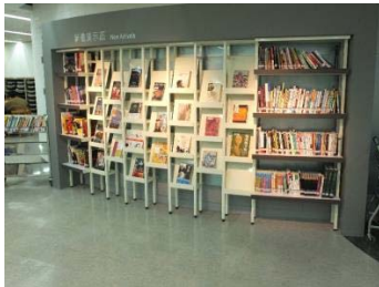
天母分館-年度圖書館

天母分館獲頒教育部 102 年全國公共圖書館評鑑—年度績優圖書館（分館組）。天母分館從社區出發，妥善結合社區資源辦理活動，並能依據區域讀者特性，規劃多元文化館藏及多樣化之閱讀推廣活動，並深入社區學校辦理班訪活動，提供學校學生職場體驗及社區服務等課程，更能善加利用各種公共與社群媒體推廣行銷，為圖書館社區化的具體展現。