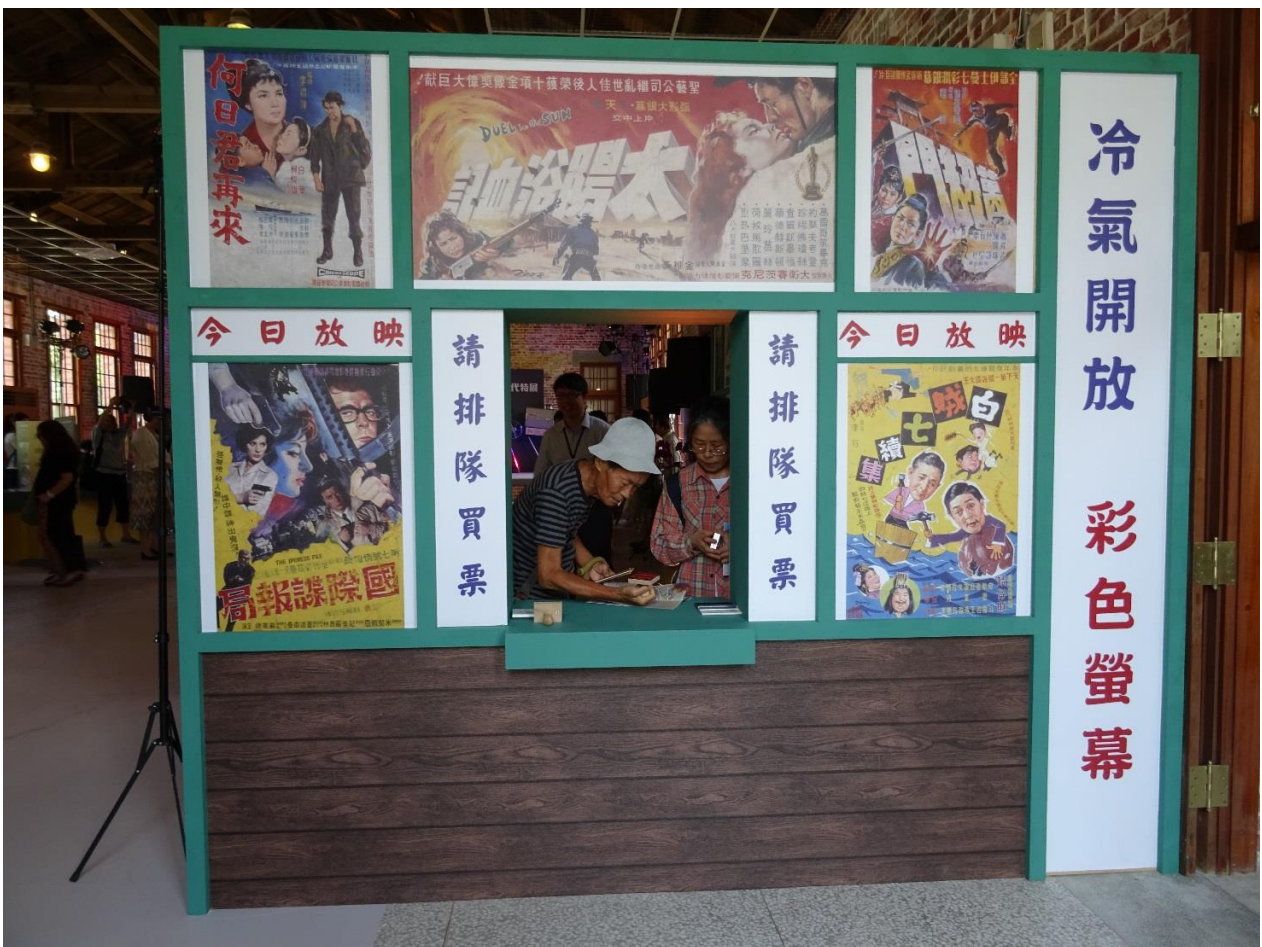
說明：展場搭設早期電影售票亭，吸引民眾來拍照蓋紀念章。