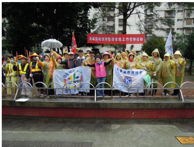
國家清潔週誓師大會現場

揚配、畫北1至於辦師下義指各行藉環為 同時除計臺2月4日所里誓飄保會後進望家， 圖/高掃執行，2月4日本各理空環大誓續希居先鋒， 來前護需之102年2月4日及辦天向宣繼，參加整擊力。 文圖/高掃執行，2月4日本各理空環大誓續希居先鋒， 的到年維之102年2月4日及辦天向宣繼，參加整擊力。 會節農曆清除；102年2月4日及辦天向宣繼，參加整擊力。 大會節農曆清除；102年2月4日及辦天向宣繼，參加整擊力。 大春年間物清；102年2月4日及辦天向宣繼，參加整擊力。 誓農102期棄1月2日至102年2月4日及辦天向宣繼，參加整擊力。 週年之春型102年前大掃除；102年2月4日及辦天向宣繼，參加整擊力。 潔102府暨大102年前大掃除；102年2月4日及辦天向宣繼，參加整擊力。 清政週眾定102年前大掃除；102年2月4日及辦天向宣繼，參加整擊力。 家接市潔民特農曆年2月8日與區級巷中，及穿著，完地點參加整擊力。 國迎北清應府「農曆年2月8日與區級巷中，及穿著，完地點參加整擊力。 為臺家因政為102年1月10日與區級巷中，及穿著，完地點參加整擊力。 合國及市日102年1月10日與區級巷中，及穿著，完地點參加整擊力。 102公大會兩及官隊環境拋境美化 102公大會兩及官隊環境拋境美化 102公大會兩及官隊環境拋境美化 102公大會兩及官隊環境拋境美化 102公大會兩及官隊環境拋境美化 102公大會兩及官隊環境拋境美化 102公大會兩及官隊環境拋境美化 102公大會兩及官隊環境拋境美化 102公大會兩及官隊環境拋境美化 102公大會兩及官隊環境拋境美化