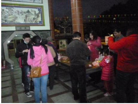
「歡喜保德 慶元宵燈謎晚會活動」