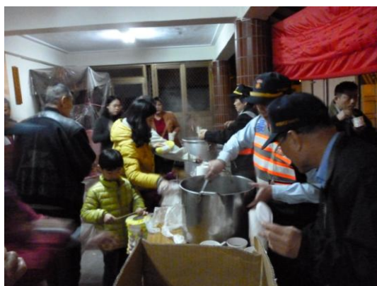
晚間7時開始，素食麵線及湯圓，現場民眾熱烈捧場

「摸彩，送獎品」造成了另一波活動的高潮，看到大家都手拿者摸彩券，個個有希望、人人沒把握的表情，再看到得獎者歡欣鼓舞上台領獎及兌換獎品的神情，那一種喜樂與滿足，更帶動了全場民眾的歡呼與鼓掌。「今夜的保德里元宵燈謎晚會---讚。」