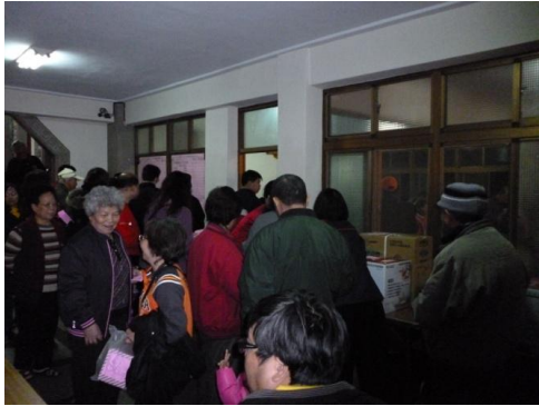
「猜燈謎，送燈籠」-掀起現場活動的高潮