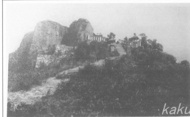
弘法大師祠（林芬郁（2015），《臺灣文化藏寶圖》，臺北：五南，頁 131。）