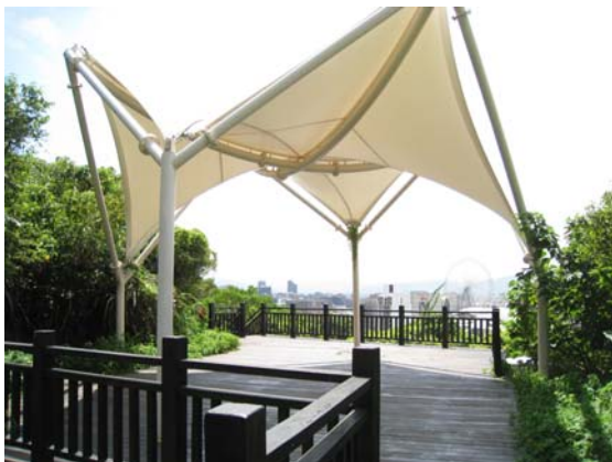
膜構涼亭(眺望摩天輪)