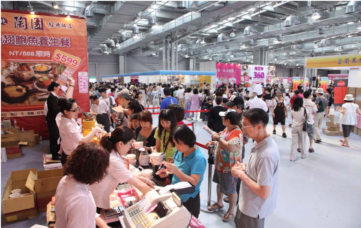
照片 3、爭豔館舉辦臺北美食展