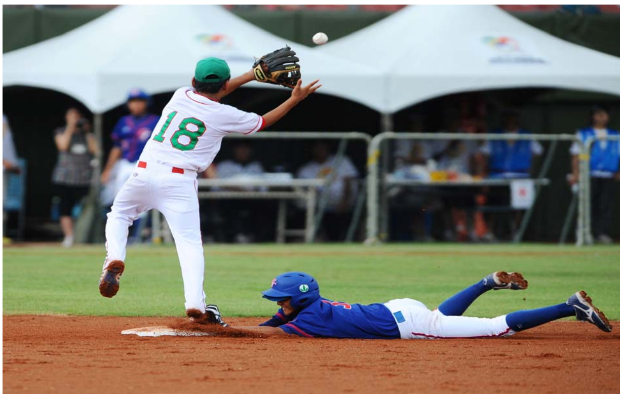
照片 17、球員賣力撲壘瞬間