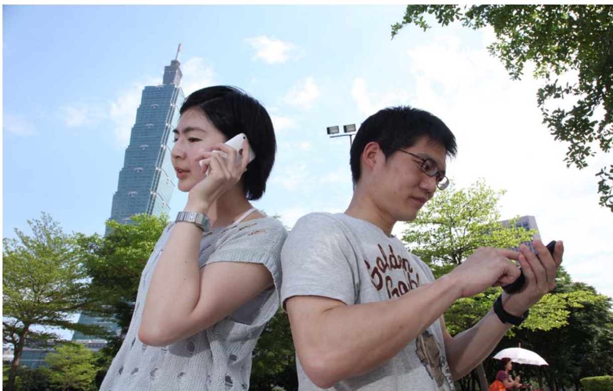
照片 12、免費無線上網使用情形