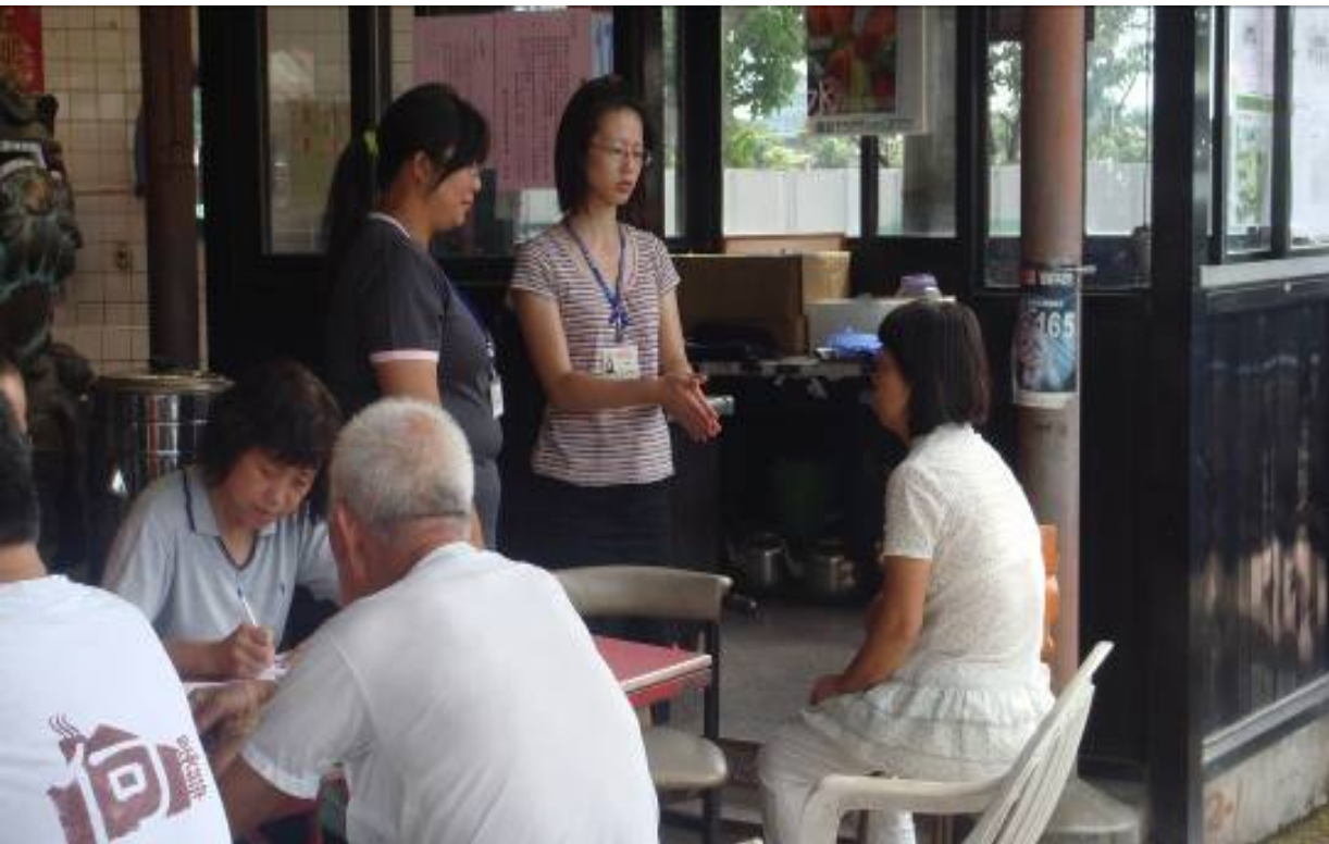
照片 6、派員至當地逐戶進行訪談釐清誤解提供資訊