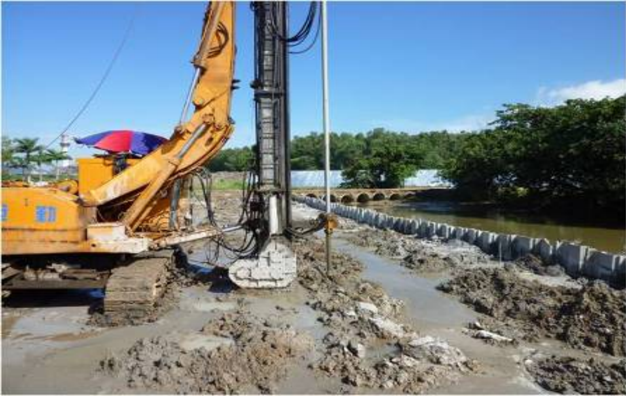
照片 5、第 1 期範圍整地填土工程一景