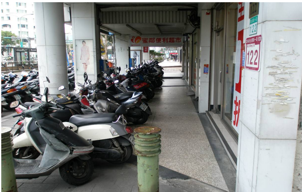
照片 10、新生南路一段 122 號改善前