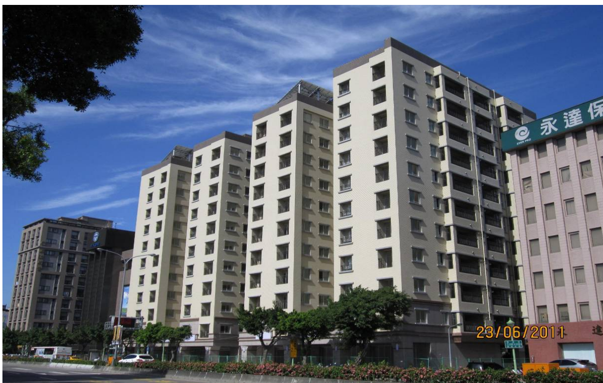
照片 1、全新完工的大龍峒公營住宅