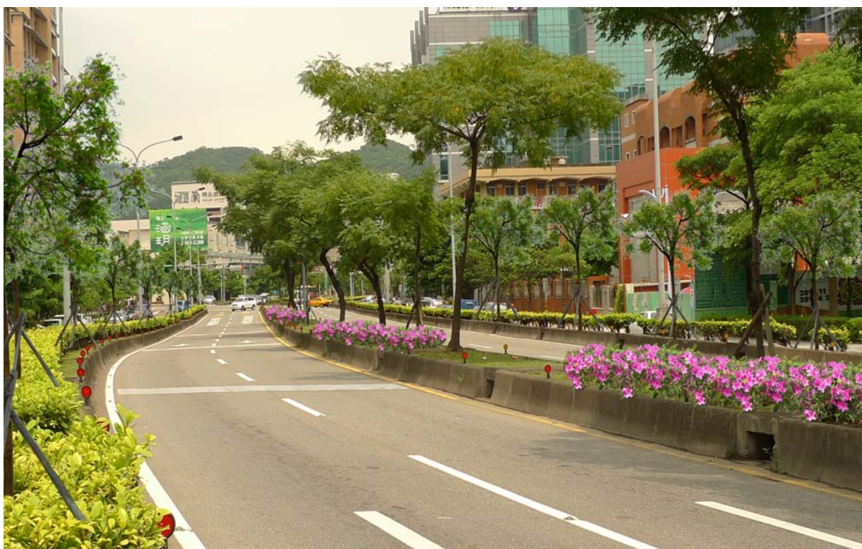
圖 1、堤頂大道完成林蔭大道工程後 2-3 年模擬圖