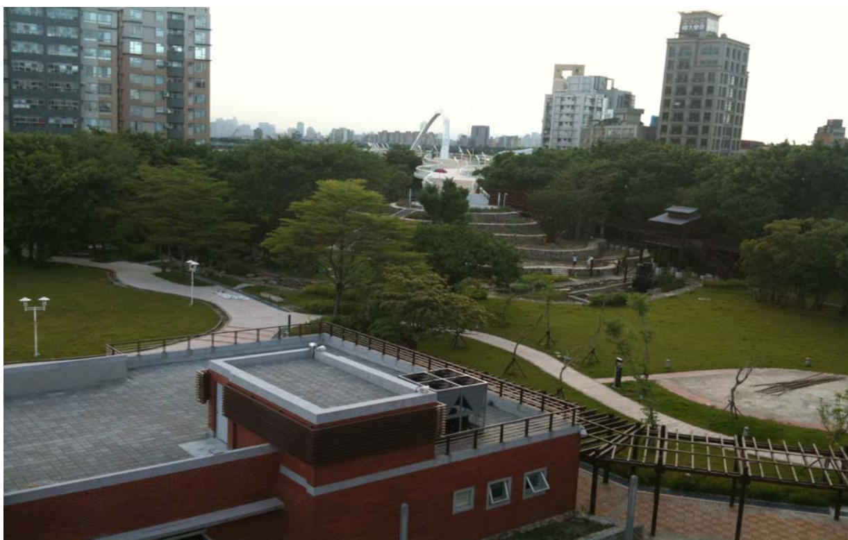
照片 8、新完工之本市客家文化主公園及跨堤平台廣場