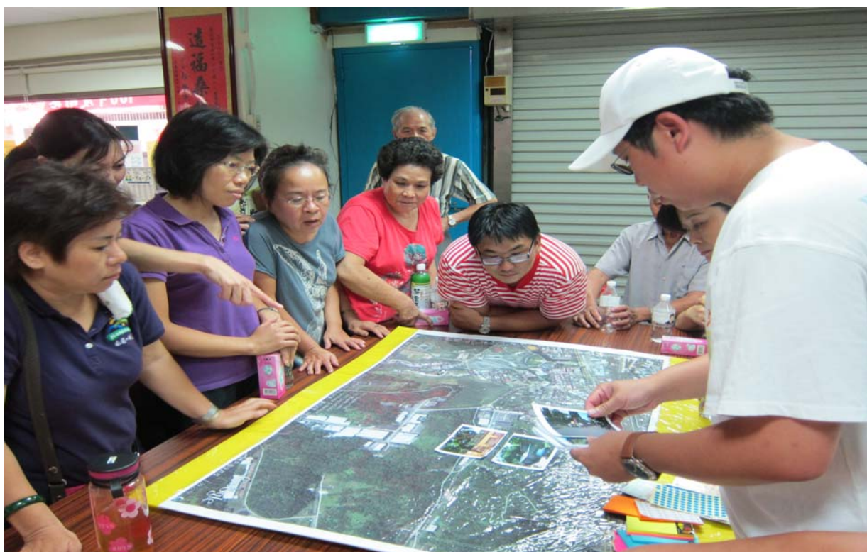
照片 14、推動社區防災工作，指導民眾進行社區環境診斷