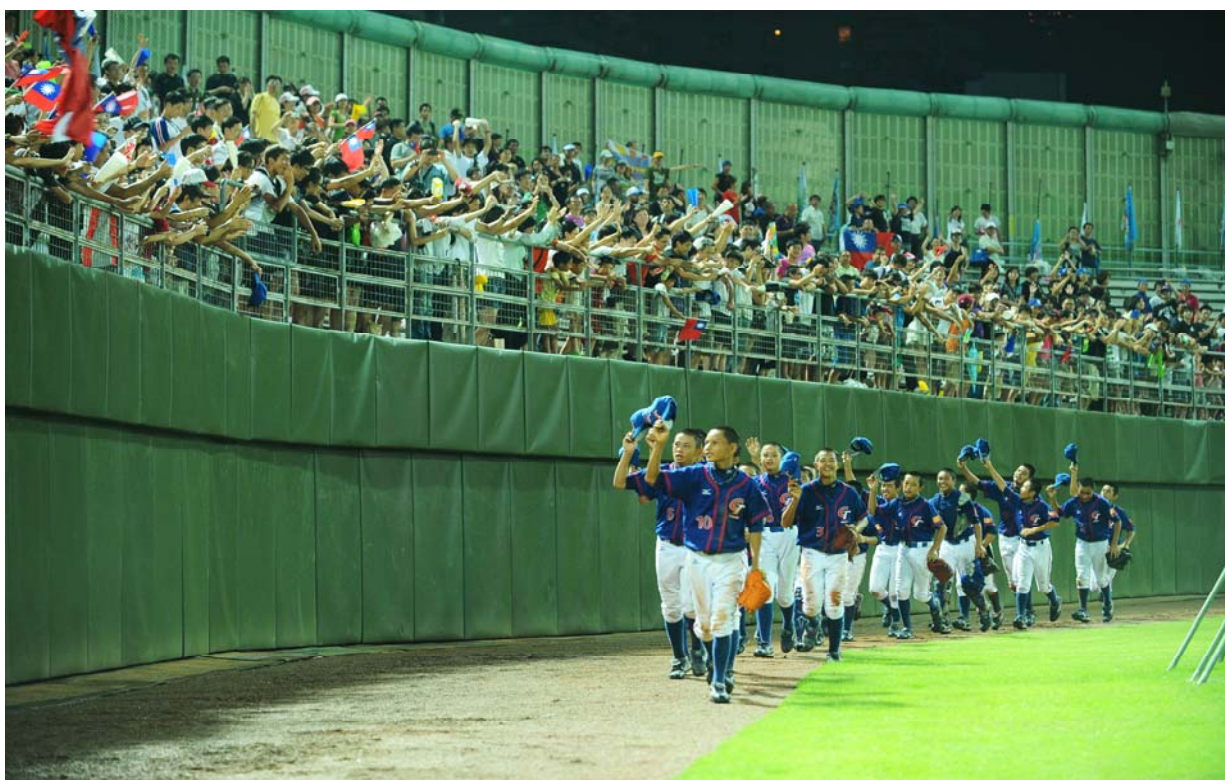
照片 16、中華小將向現場觀眾致謝