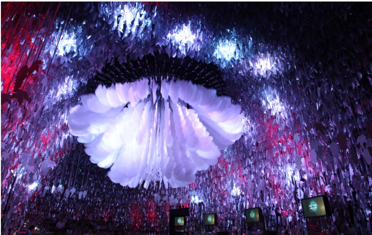
照片 4、夢想館展覽持續