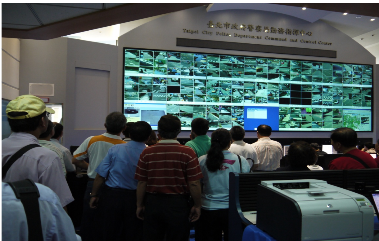
照片 13、里長及媒體實地參觀本市錄影監視器運作情形