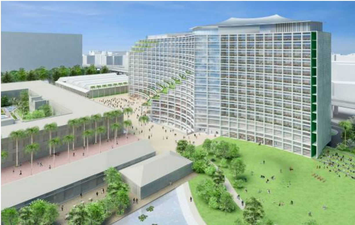
圖 2、松山文化創意園區文創產業資源基地示意圖