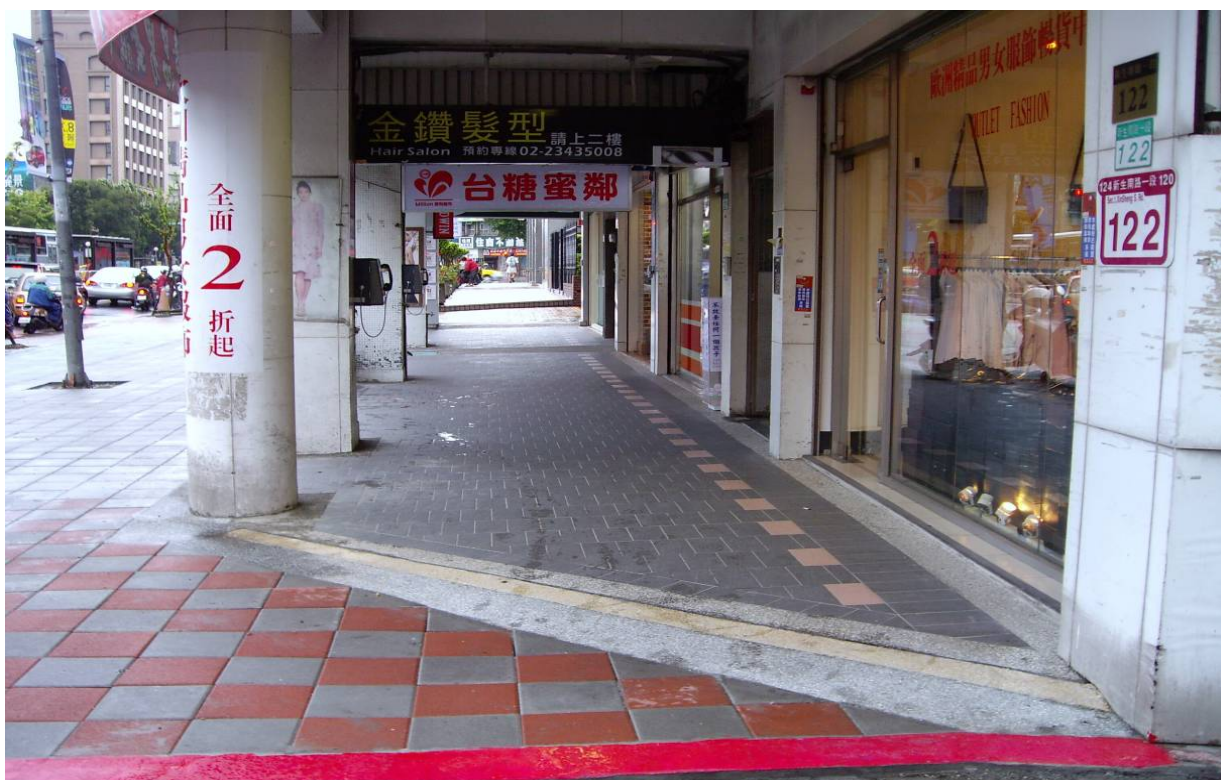
照片 11、新生南路一段 122 號改善後