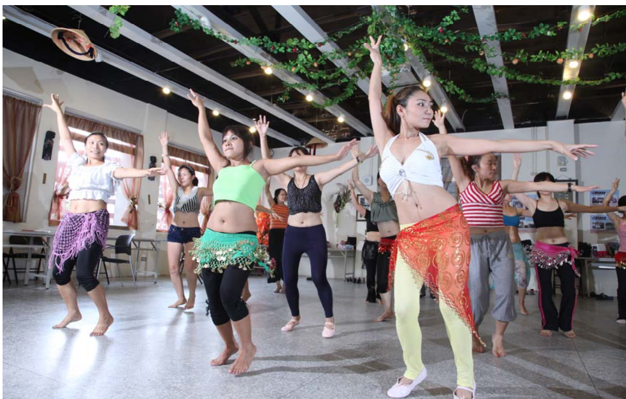
照片 9、新移民表演工作坊舞蹈班—萬華新移民會館