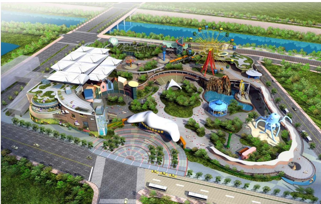
圖 5、臺北兒童新樂園鳥瞰示意圖