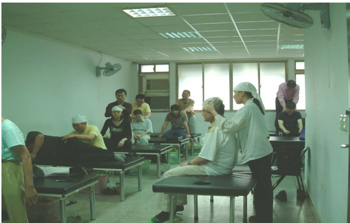
照片 7、100 年度視障丙級按摩職業訓練班