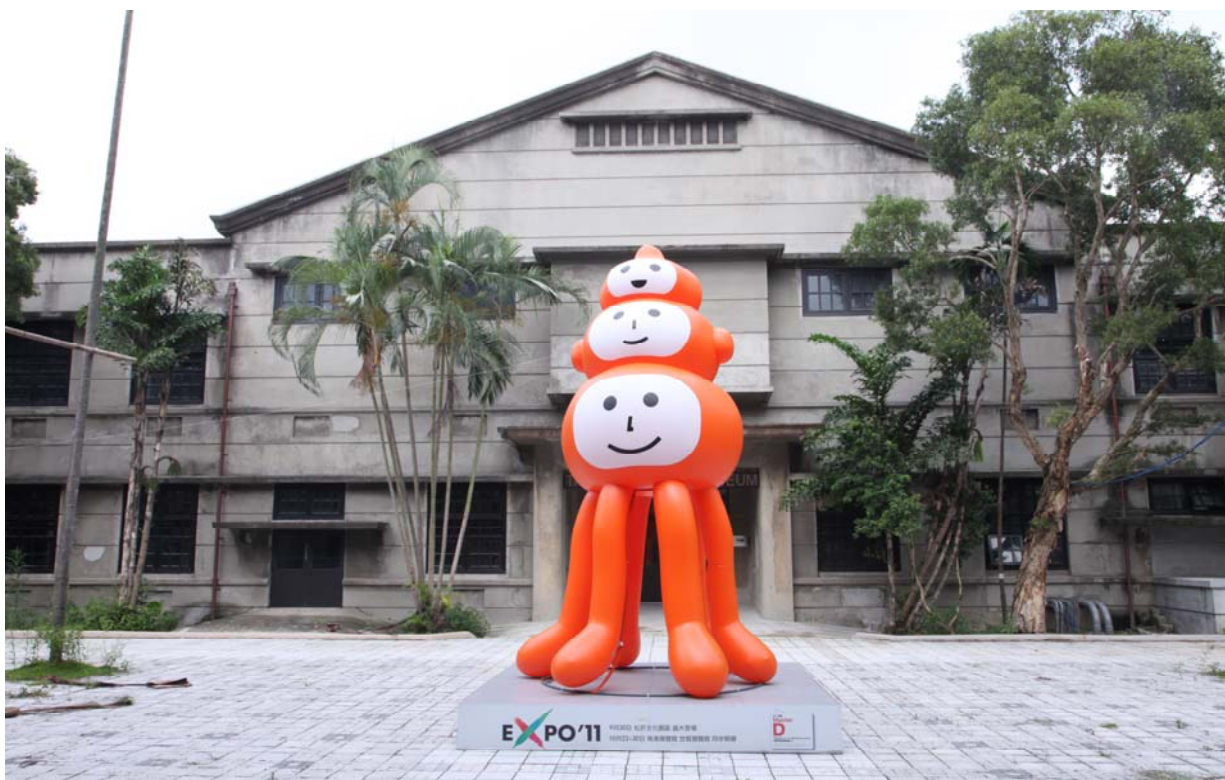
照片 15、2011 臺北設計大會吉祥物