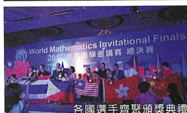
各國選手齊聚頒獎典禮