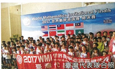
2017 WMI 世界數學邀請賽 臺灣代表隊合照