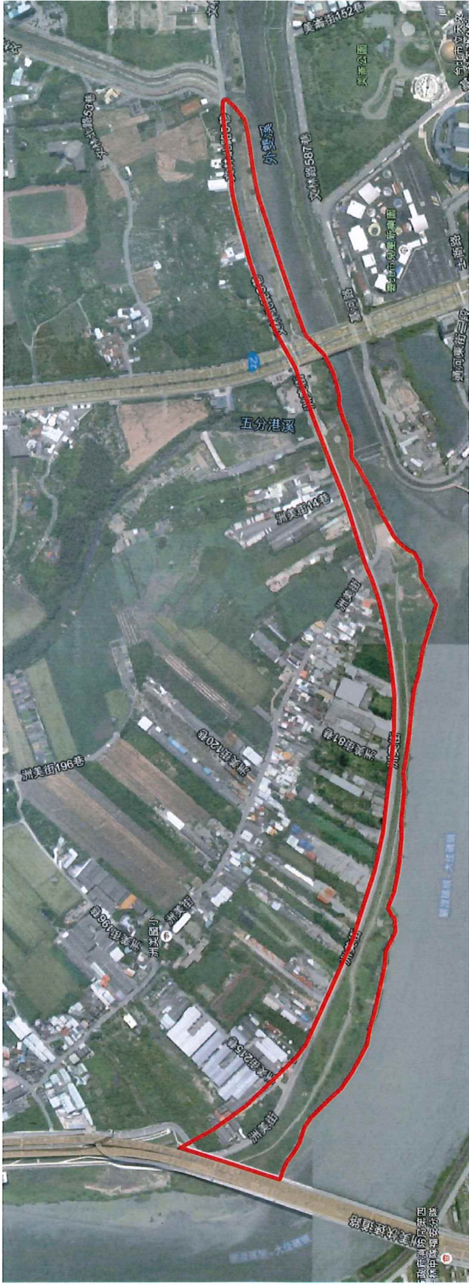
105 年度「北投洲美堤防外灘地整建工程」施工範圍圖