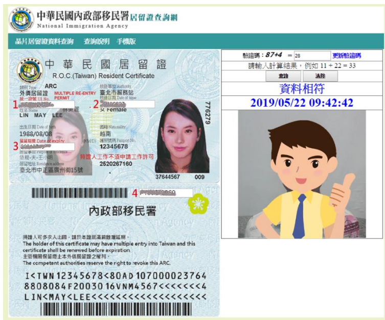
▲ 「合法居留證」查詢結果示意