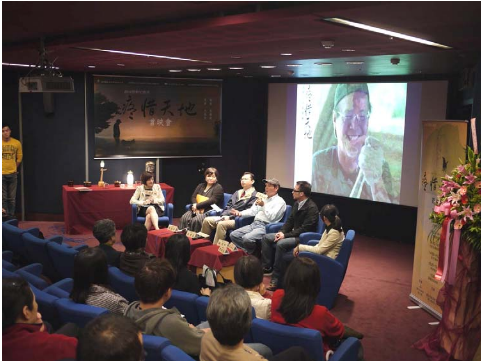
照片13：99.11.22 勞動紀錄片《疼惜天地》首映會

及各分館、聯合影音網、Youtube 等平台線上放映，並於電視頻道「年代印象」節目中安排播映。 (照片 13、14)