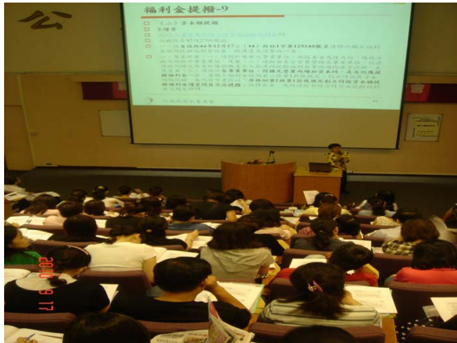
照片 5：99.9.17 「99 年度職工福利業務法令研習會」