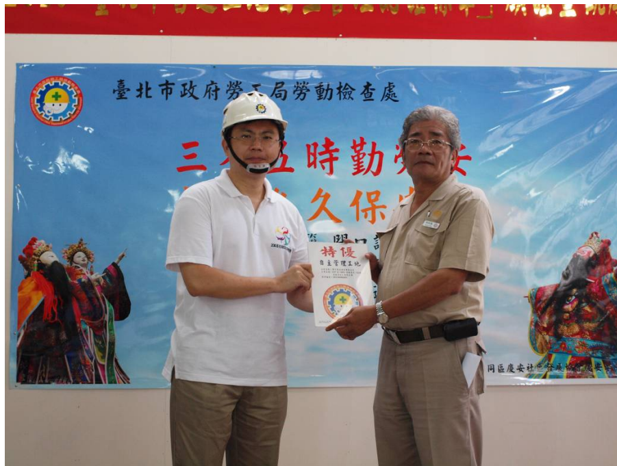
照片 1：99.9.30「臺北市營造工地自主管理認證標章」頒證暨觀摩會