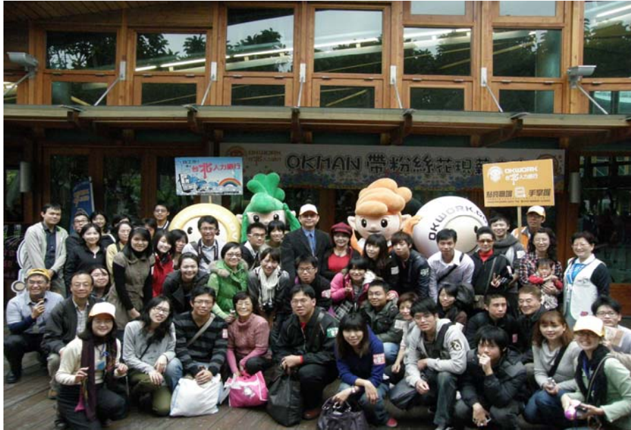
照片 3：『OKMAN 帶粉絲花現薪未來』網聚活動