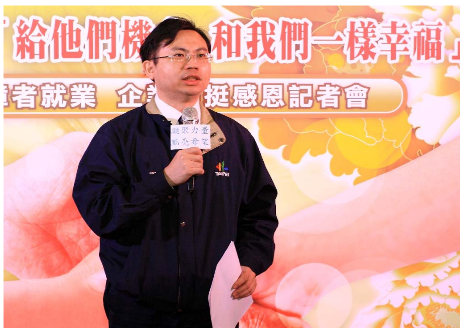
照片 10：99.12.9 促進身心障礙者就業企業相挺感恩記者會致謝詞

3、賡續提供企業進用身障者獎勵金，針對企業雇用就業困難度較高之身障者，辦理「頭家寶障獎勵雇用