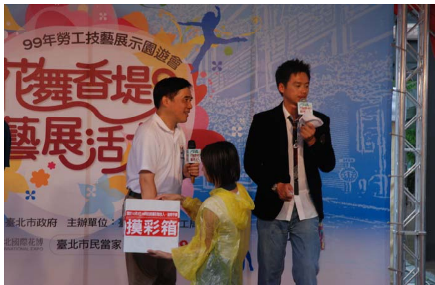
照片 6：99.10.3「99 年勞工技藝展示園遊會」郝市長抽出頭獎