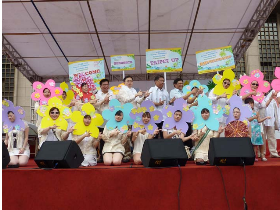
照片 11：「2010 臺北起菲，菲你茉屬」－臺北馬尼拉友好文化日