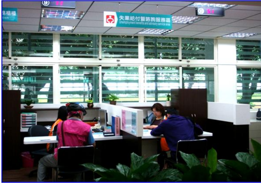
照片 2：就業服務處信義就業服務站之服務櫃檯採一對一包廂方式