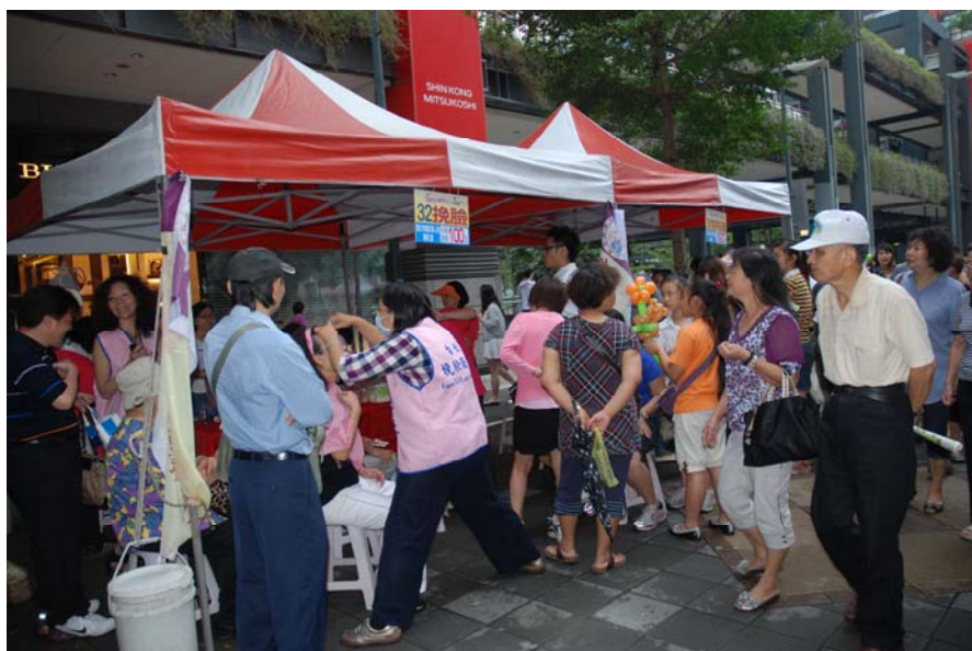
照片 7：99.10.3「99 年勞工技藝展示園遊會」市民朋友同樂