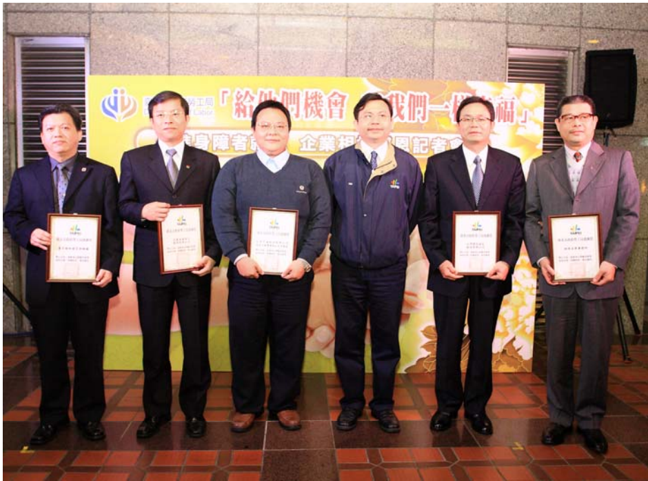
照片 9：99.12.9 促進身心障礙者就業企業相挺感恩記者會