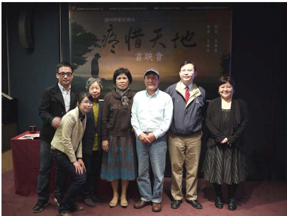
照片14：99.11.22 勞動紀錄片《疼惜天地》首映會