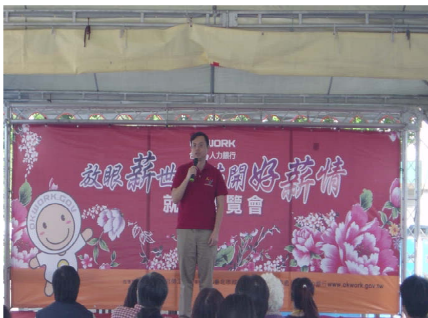
照片 12：99.12.4「放眼薪世界·花開好薪情」就業博覽會