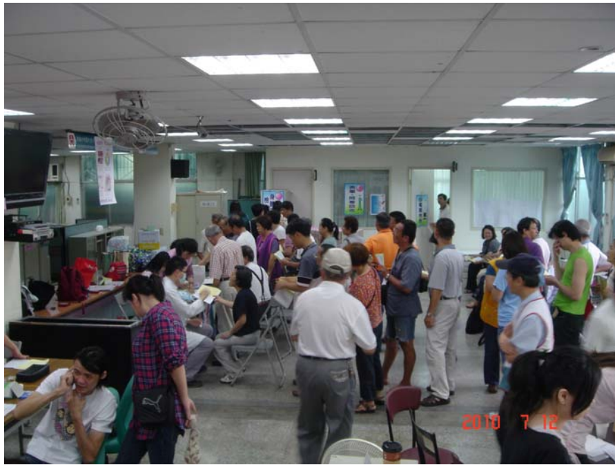
照片 8：99.7.12 「99 年度健康勞工鳳凰計畫」