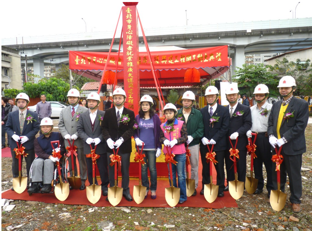
圖 17：101 年 2 月 15 日身心障礙者推廣大樓開工動土

為拓展身心障礙者就業場所及服務據點，正積極籌建本市身心障礙者就業大樓，經 98、99 年度之先置作業，藉由委託專案管理及監造設計廠商，已完成大樓設計及施工委託，並於 101 年 2 月 15 日開工，未來身心障礙者大樓將朝向提供庇護工場、就業輔具、身心障礙者藝文創作發表等功能進行內部設計，以提供身心障礙者開發多元就業潛能及提供專業精緻服務之空間。