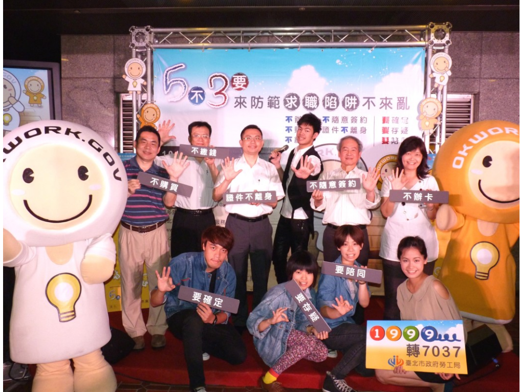
圖 20：101 年 6 月 18 日「求職防騙記者會」活動