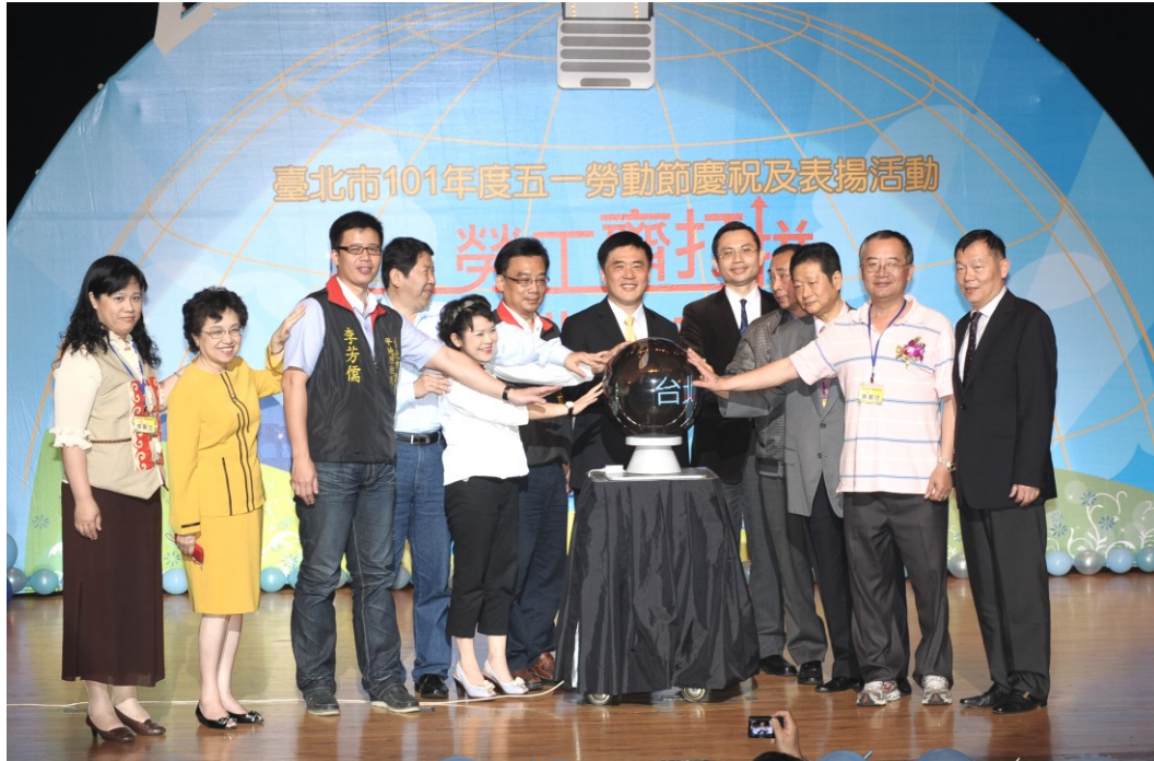
圖 9：101 年 4 月 20 日「臺北市 101 年度五一勞動節慶祝及表揚活動」啟動儀式

於會後舉辦勞工之夜餐敘。藉由本活動鼓勵本市勞工，發揚敬業精神與表達對勞工關懷與感謝之意。