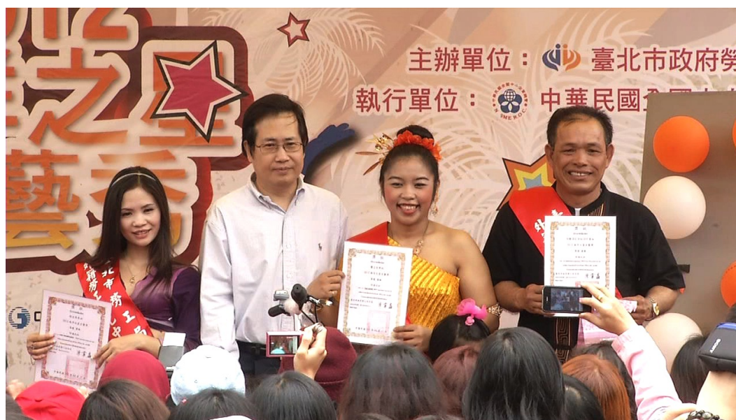
圖 18：101 年 4 月 15 日「2012 南洋之星才藝秀」活動