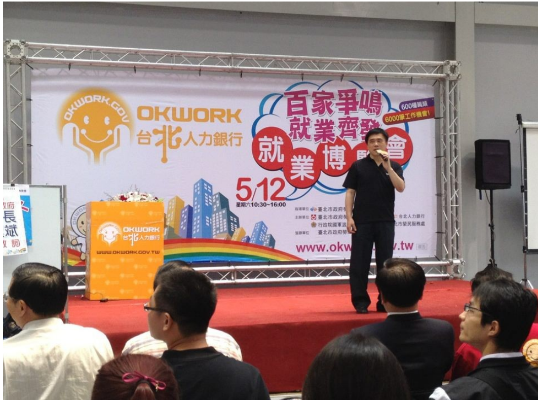
圖 22：101 年 5 月 12 日『OKWORK 百家爭鳴 就業齊發』就業博覽會