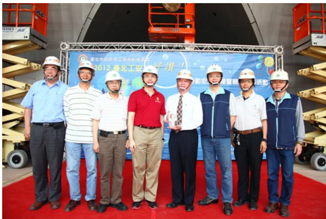
圖 12：101 年 5 月 5 日 2012「臺北工安好讚！」勞動安全表揚暨親子觀摩活動

影比賽」，主題為「勞動安全」，由參賽者運用攝影方式記錄工作影像，喚起社會大眾重視勞動安全，一起打造安全之作業環境，本期計 707 人次參加。