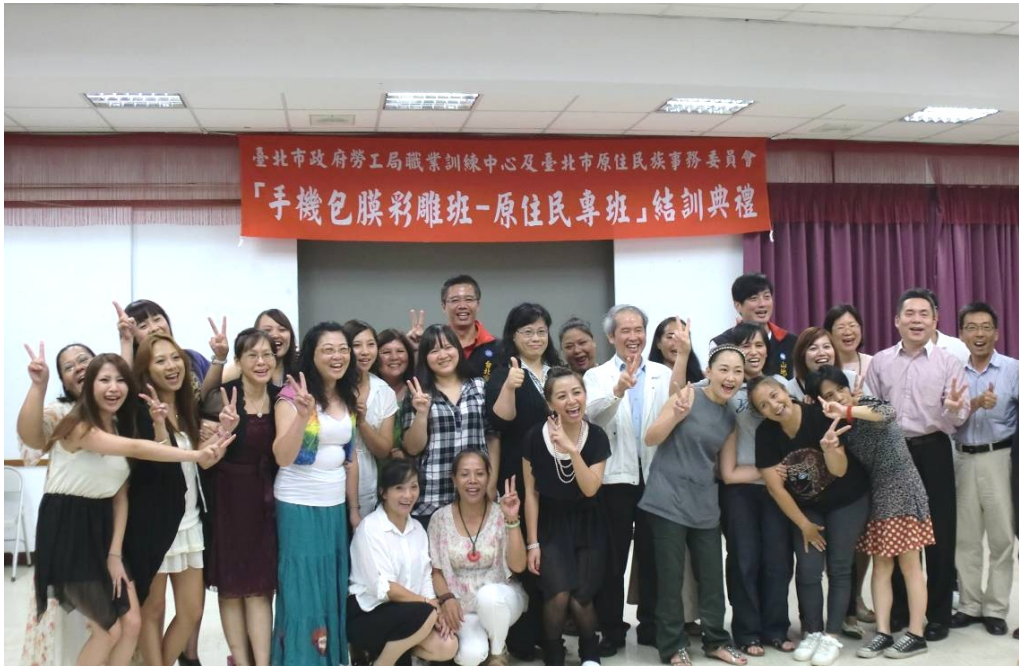
圖 4：「手機包膜彩雕班-原住民專班」結訓典禮合影留念

2、本局觀察就業市場動脈，創新職訓課程，針對手機包膜市場商機首開「手機包膜彩雕班」課程，與企業及相關工會進行產訓合作，表現優良的受訓學員可優先進入合作企業或相關工會工作。