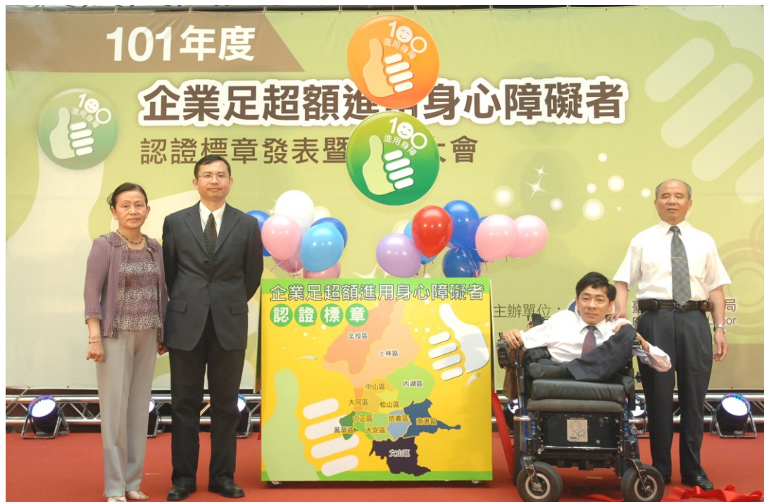
圖1：101年5月25日企業足超額進用身心障礙認證標章發表暨表揚大會

等與甲等，做為企業榮耀之表徵。首波表揚活動業於101年5月25日舉行授證大會，計有61家企業榮獲甲等認證標章，共提供1,401位身心障礙者就業機會，佔全體員工進用比例1.25%，足以證明身心障礙者的專業能力備受企業肯定。