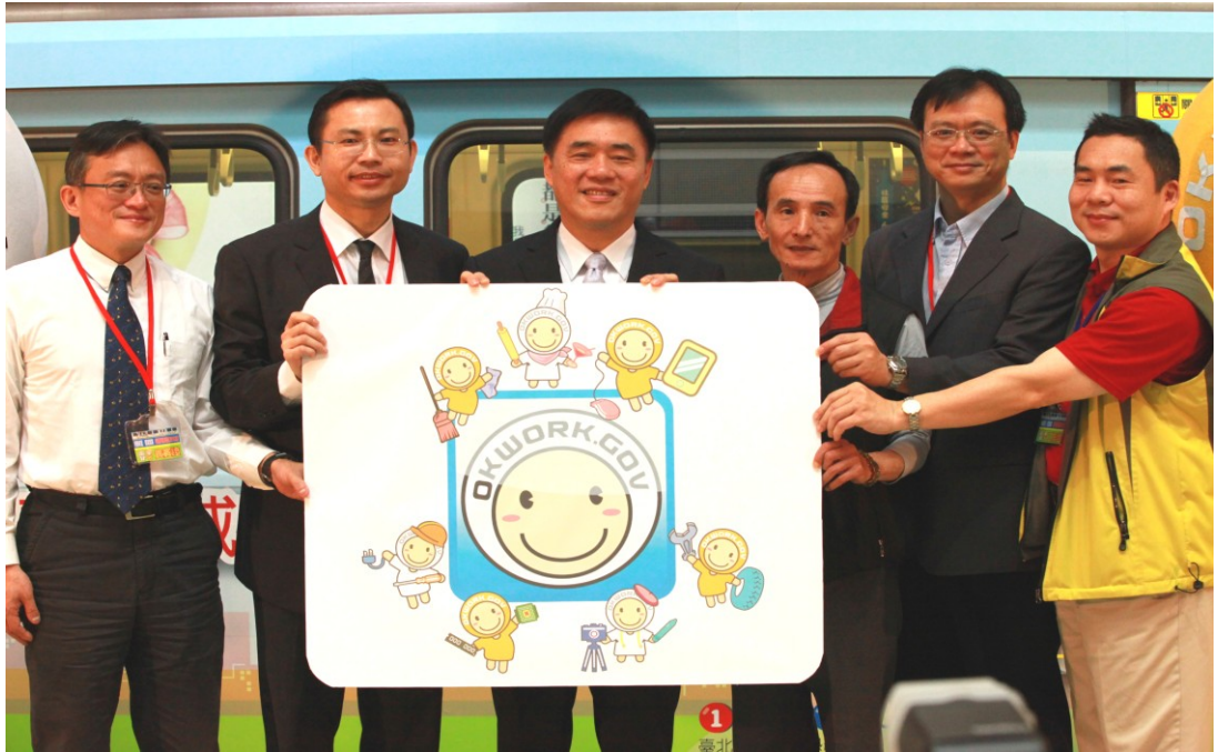
圖 5：101 年 4 月 19 日「穩定就業彩繪列車」啟航記者會

列車」，透過川流不息的列車穿梭及活潑亮麗的吸睛主題，讓更多有就業、職訓需求的市民，更能掌握勞工權益相關資訊，並主動照顧勞工朋友，陪同渡過全球金融危機所帶來的經濟難關。