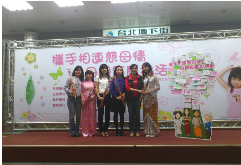
圖 19：101 年 5 月 6 日攜手相連慈母情-母親節慶祝活動