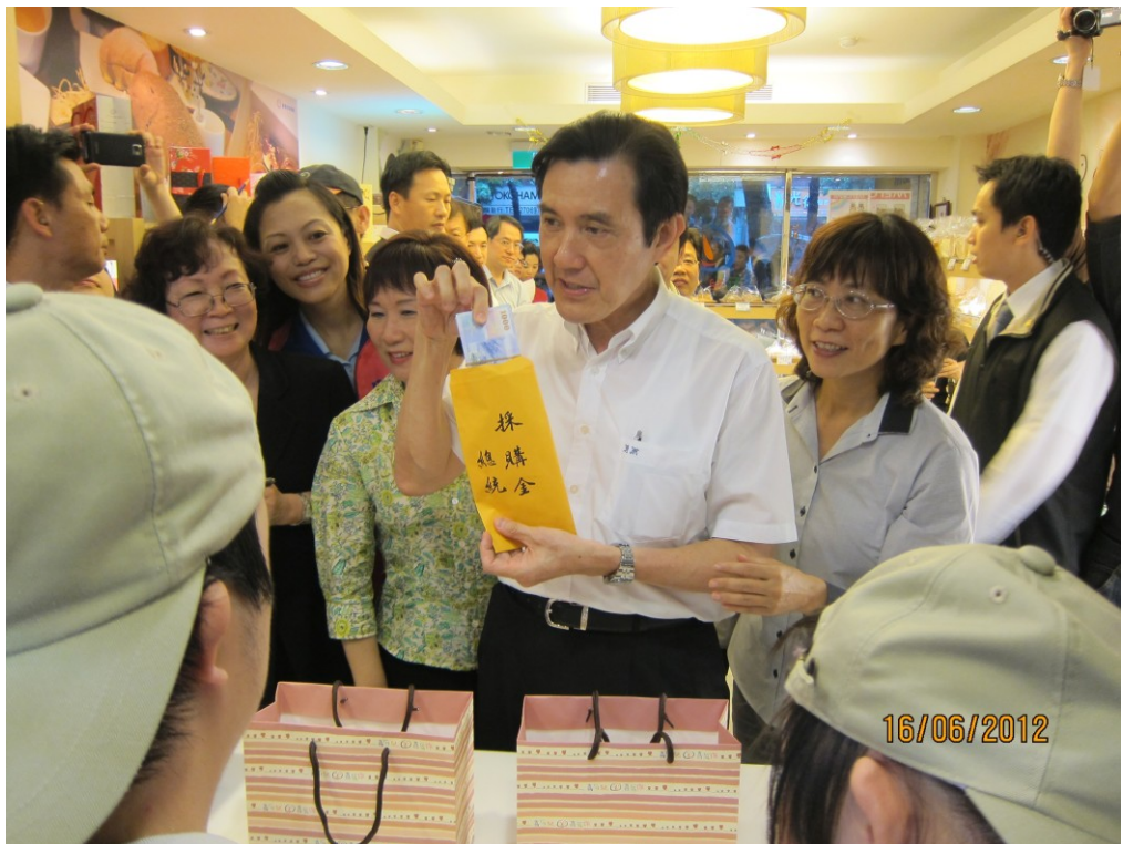
圖 15：101 年 6 月 16 日總統親訪喜憨兒烘焙屋採購產品