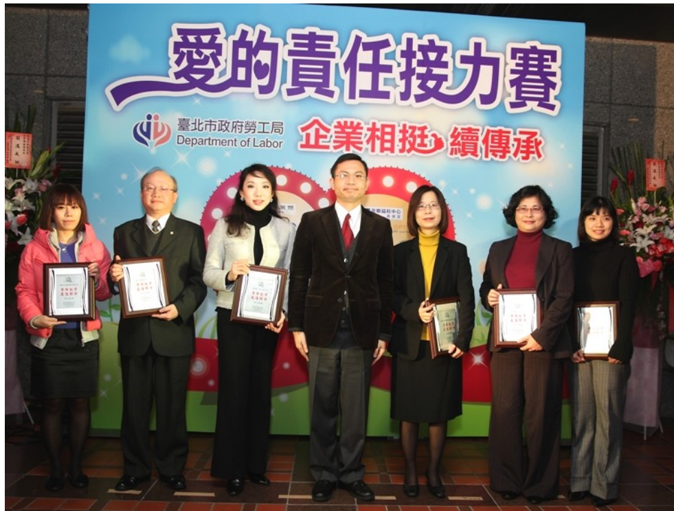
圖 14：101 年 1 月 5 日「愛的責任接力賽，企業相挺續傳承」