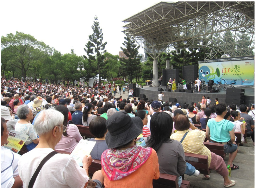
圖 7：101 年 6 月 9 日「臺北好 YOUNG-活力百工」勞動文化活動-「百工·樂」臺北大安森林公園露天音樂臺戶外音樂會

2、6月9日假臺北大安森林公園露天音樂臺，音樂會首先是 LIFE 樂團暖場演出，接著年輕活潑的 Focal Plus 人聲樂團、再由熱情奔放的咻樂風樂團以及最後壓軸由各行各業愛樂人士組成的臺北市民交響樂團室內樂團等聯手帶來最有創意的夏日音樂會！現場演出民眾最熟悉的國語金曲、臺灣民謠、爵士老歌以及歷久彌新的電影配樂。現場有本局就業服務處台北人力銀行及本局勞工教育中心分別設置攤位，為民眾提供相關諮詢服務，本音樂會計有 3,000 多名市民朋友共襄盛舉。