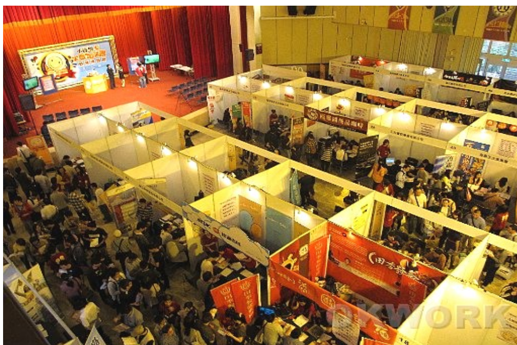
圖 21：101 年 3 月 17 日「小資男女求職加油讚」就業博覽會