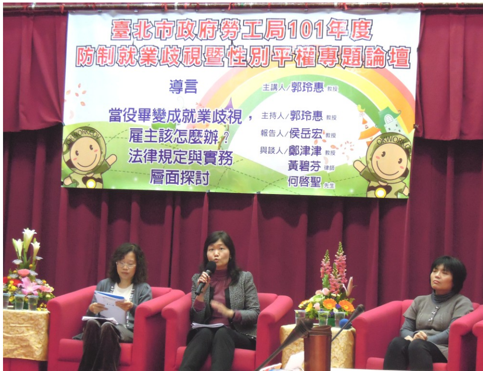
圖 8：101 年 2 月 24 日「役畢＝就業歧視？」專題論壇