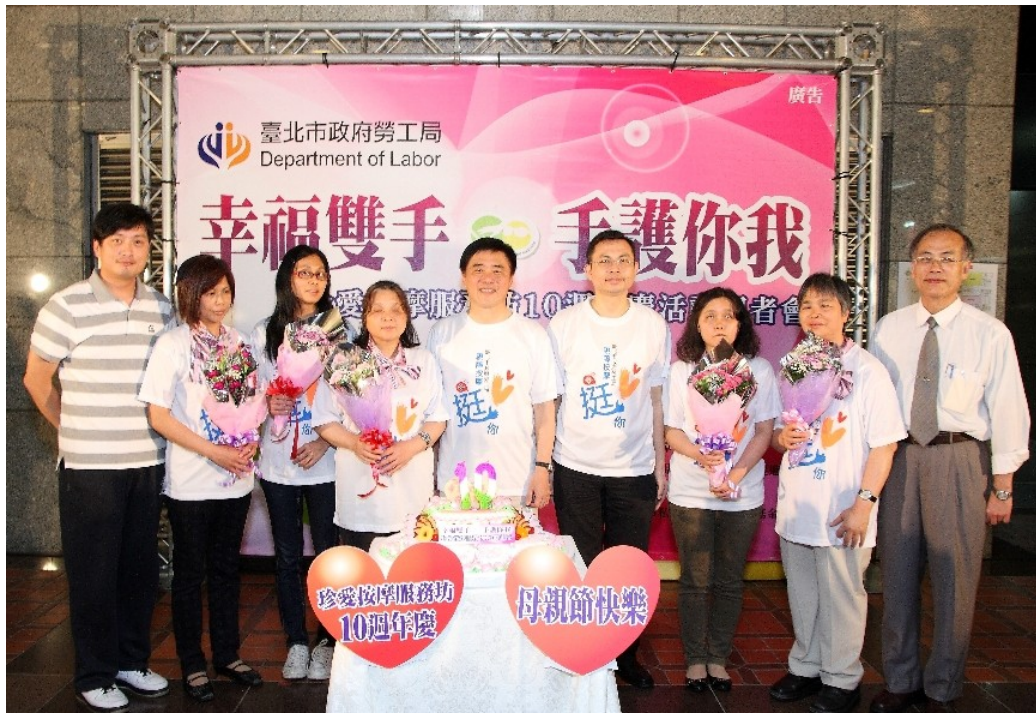
圖 16：101 年 5 月 10 日「幸福雙手·手護你我」珍愛按摩服務坊 10 週年慶活動