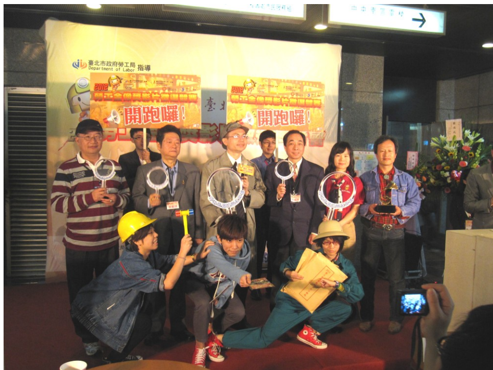
圖 23：101 年 3 月 19 日「2012 勞工金像獎」開跑記者會