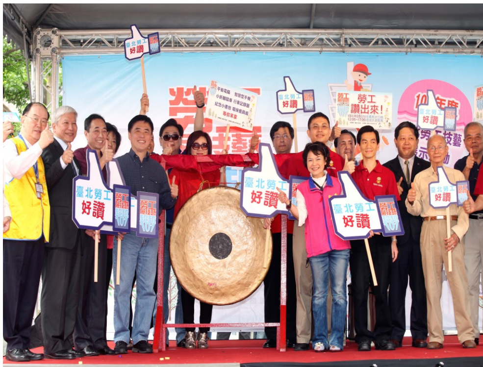
圖 11：101 年 4 月 28 日「臺北市 101 年度勞工技藝展示活動」開幕儀式