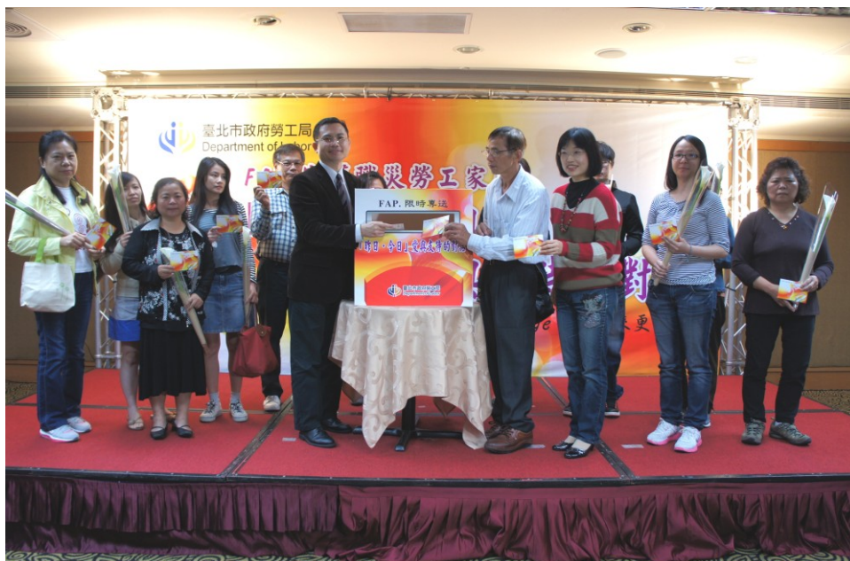
圖 2：101 年 5 月 4 日「昨日·今日」愛與支持的對話-守護 職災勞工家庭座談會