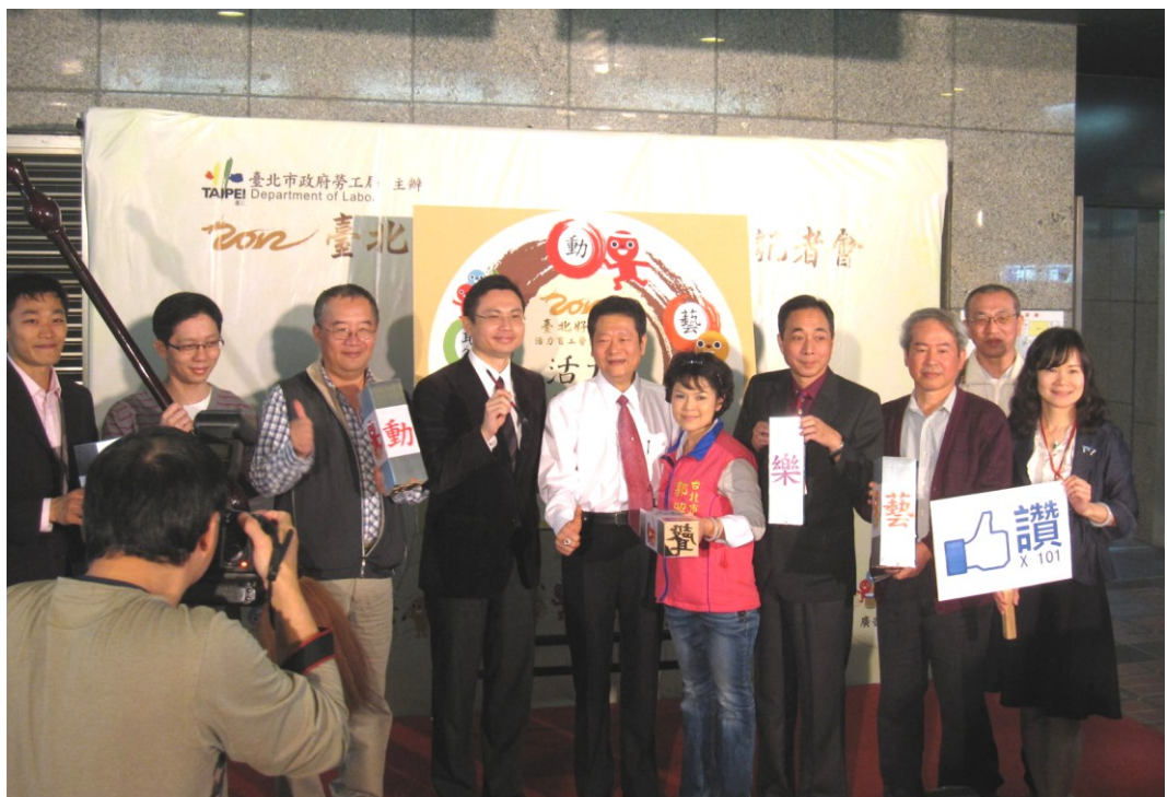
圖 6：101 年 4 月 23 日「臺北好 YOUNG-活力百工」勞動文化活動記者會