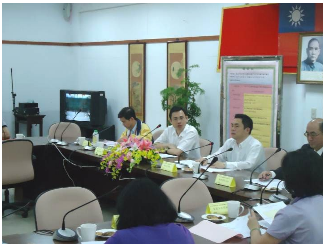
圖 3：101 年 4 月 25 日「照顧服務」領域產官學座談會

為貼近產業發展趨勢、掌握就業市場需求，本局職業訓練中心自 3 月 30 日起，陸續針對資通訊、工業技術、服務業等訓練領域舉辦座談會，廣邀業界領袖、學界專家等共同座談，透過對話及經驗分享的方式，強化職業訓練的功能與成效。