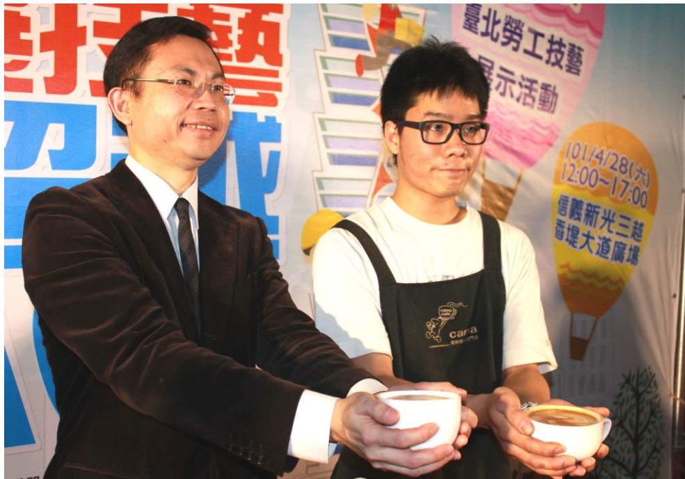
圖 10：101 年 4 月 26 日勞工技藝展示活動記者會

各產業、職業工會會員及其眷屬約 2,500 人參加，在歡愉的氣氛下一同慶祝五一勞動節。