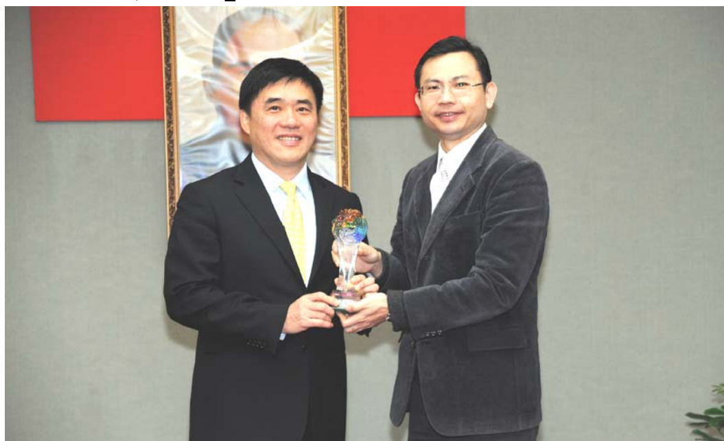
照片 11：本府榮獲行政院勞委會 100 年度勞工行政主管機關推動性別工作平等業務績效評鑑市長局長獻獎合照

4、本局榮獲行政院勞工委員會「100 年度勞工行政主管機關推動性別工作平等業務績效評鑑」「第一級區第一名」殊榮！