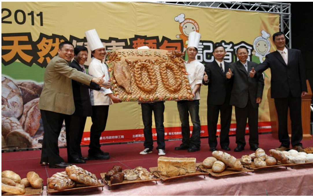
照片 20：2011 天然健康麵包記者會