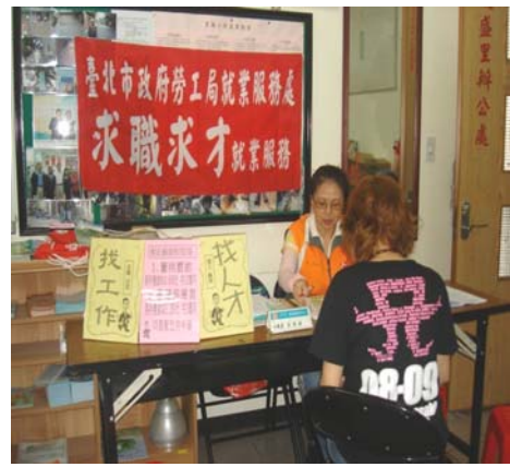
里辦公處駐點服務