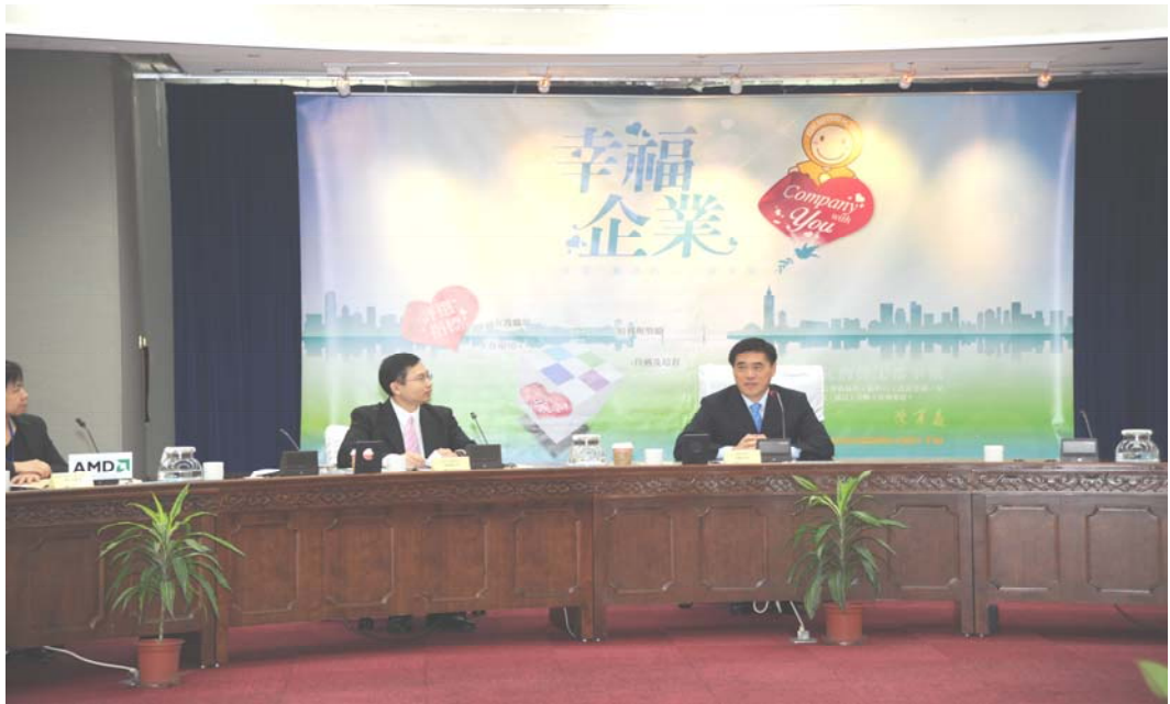
照片 2：「《幸福企業》專刊發表會暨 2011 幸福企業學院成立茶會」剪影

為使「幸福企業獎」的理念與作法影響更多本市的事業單位，成立「幸福企業學院」，於 100 年 10 月 5 日辦理授勳儀式，由市長親自蒞臨頒發榮獲本局 100 年度幸福企業獎之 23 家企業代表會員勳章，期以集合更多標竿企業供事業單位參考學習，一同打造幸福職場。