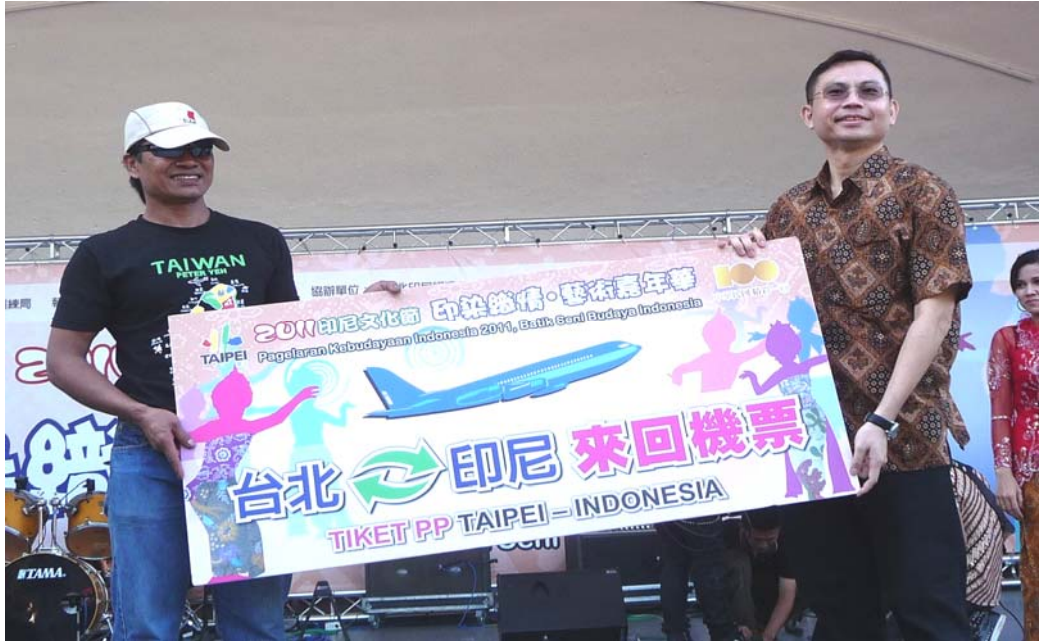
照片 15：「2011 印尼文化節-印染織情·藝術嘉年華」-局長頒發機票大獎