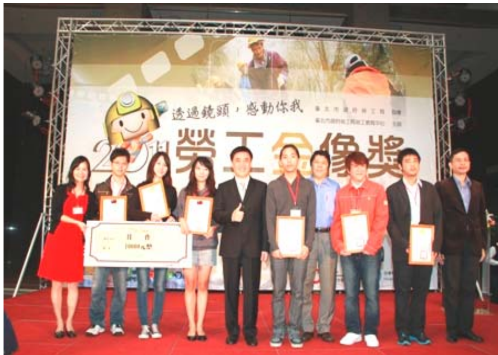
照片21：「2011勞工金像獎」頒獎典禮

為彰顯勞工對國家社會的貢獻，本局勞工教育中心辦理「勞工金像獎」短片徵選活動，透過勞動者的視角，運用攝影機記錄工作與生活影像，藉以保存、發揚勞動文化，喚起社會大眾關心勞工權益。100 年 11 月 2 日假沈葆楨廳舉辦「2011 勞工金像獎」頒獎典禮；得獎短片分別在非凡電視頻道、臺北市立圖書館總館及各分館、勞工局網站、新聞局 TAVIS 網站、Youtube 等平台推廣放映。