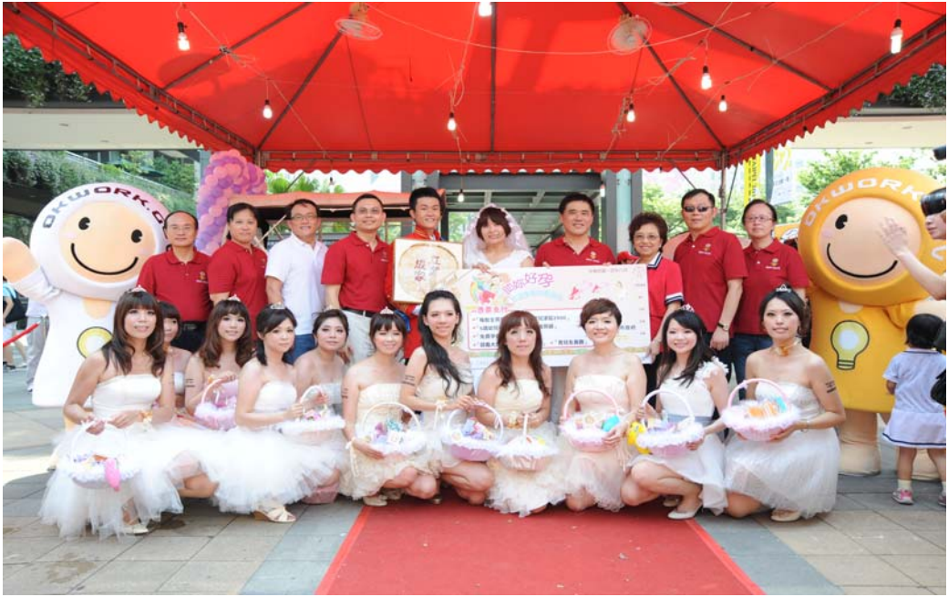
照片 18：OKWORK 立業成家好ㄍㄨㄛ、連連活動—台北人力銀行園遊會暨現場徵才活動