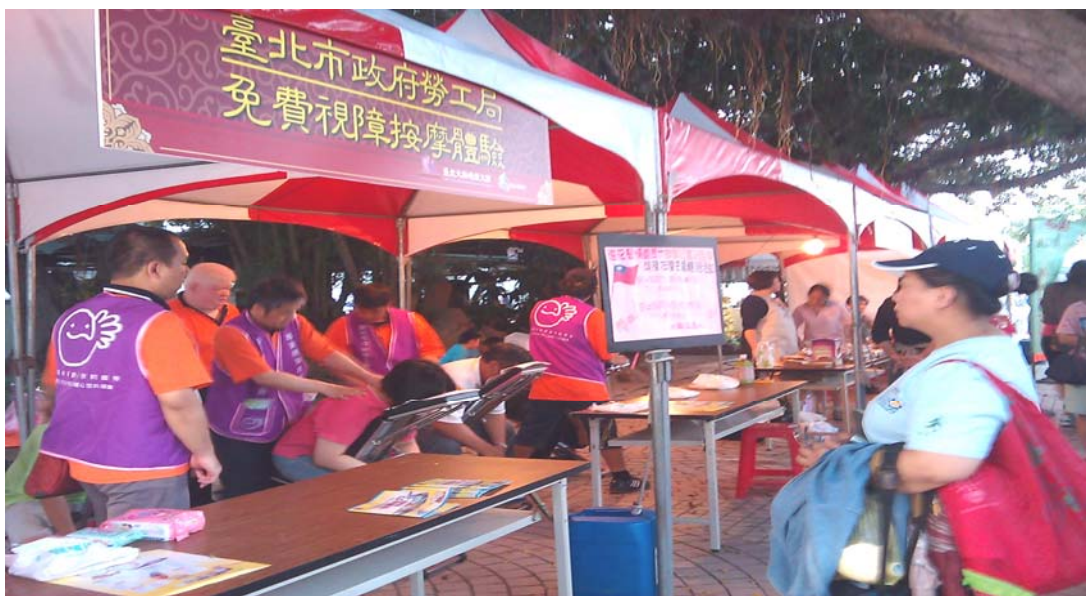
照片 14:「按摩舒壓·鄰里關懷」視障按摩社區化宣導活動

主動結合本府各局處資源，提供視障者設置按摩小站，100年11月已於臺鐵臺北車站一樓設置按摩小站，現有33位按摩師就業。並為開拓潛在消費族群，辦理視障按摩推廣活動，本期共計辦理25場次，提供服務之視障按摩師266位，按摩服務人數2,619人次。