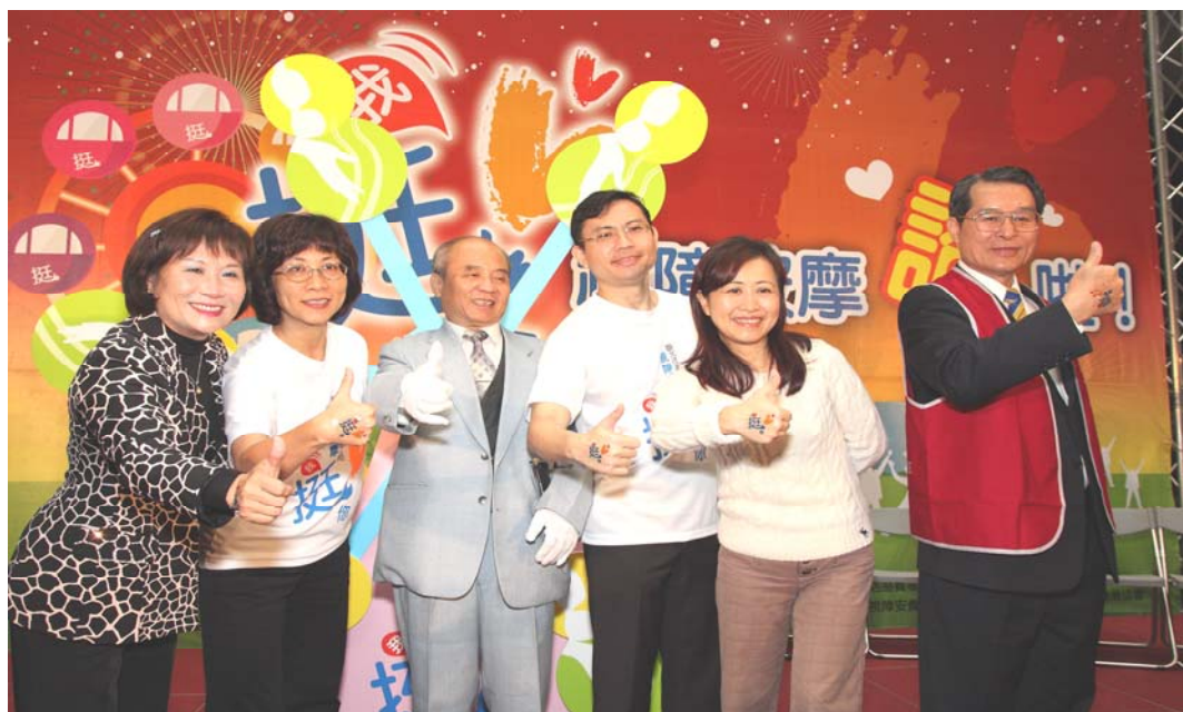
照片 5:建國百年百位按摩師宣誓活動