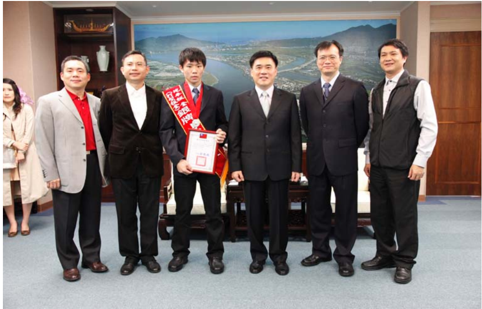
照片 19：第 41 屆國際技能競賽獲獎選手頒獎活動