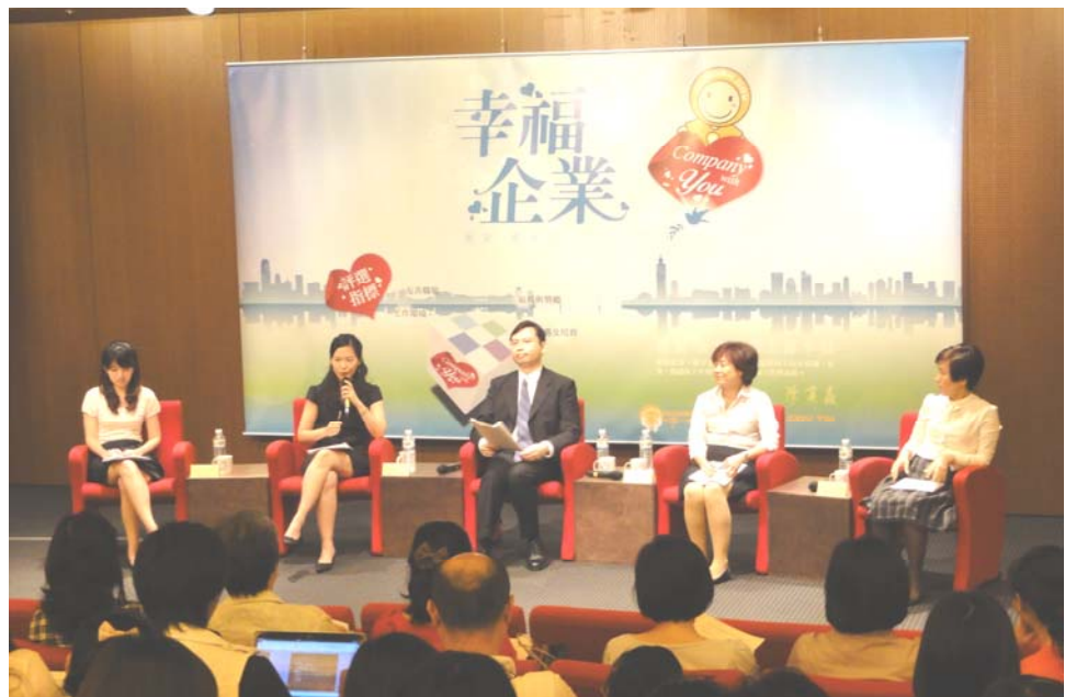
照片 1：「100 年我心目中幸福企業的想像」論壇剪影

為配合 6 月畢業季，提供社會新鮮人求職參考，使企業重視員工職場幸福感，並肩負企業的社會責任，本局於 100 年 7 月 7 日在誠品信義店 6 樓視聽室舉辦「臺北市政府勞工局 100 年我心目中幸福企業的想像」論壇，邀請人力銀行代表，以及此次獲得 3 星級幸福企業的三家企業代表-明基電通股份有限公司、信義房屋仲介股份有限公司與台灣陶氏化學股份有限公司，分享營造幸福職場的經驗。