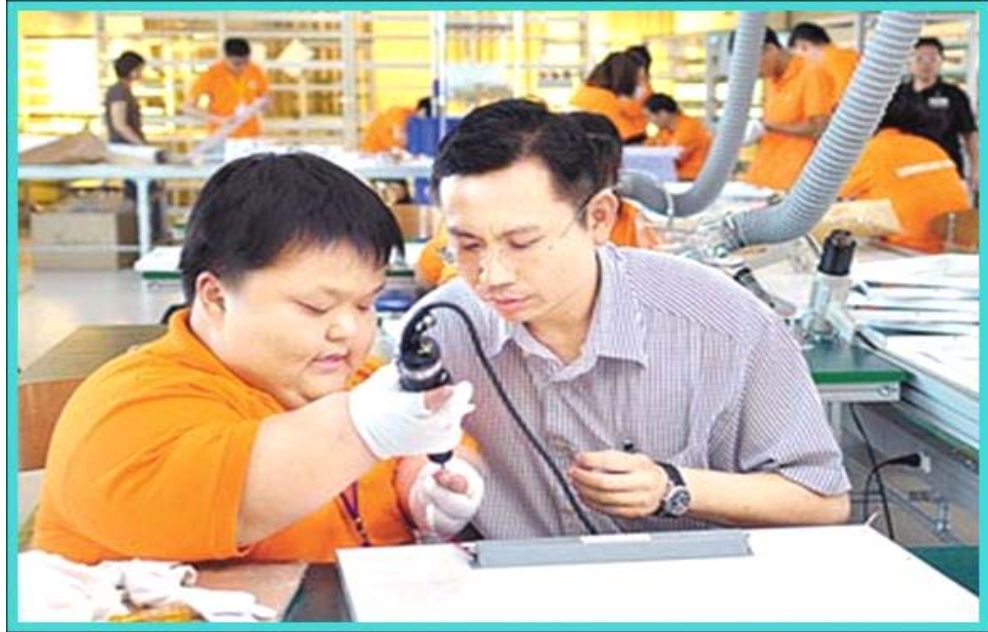
照片 7:鼓勵企業大量僱用身心障礙者