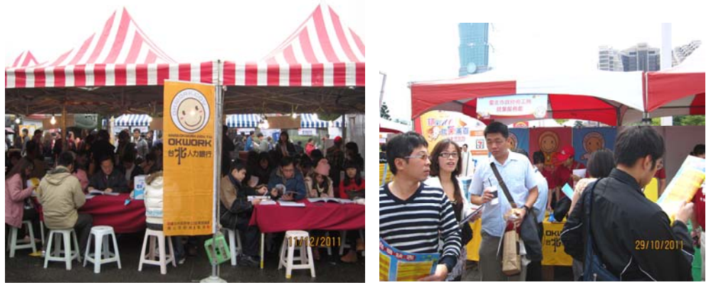
照片 17:台北人力銀行辦理就業博覽會