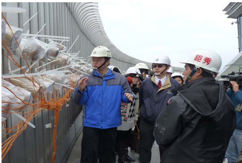
照片 10：101 大樓煙火裝設作業勞動檢查