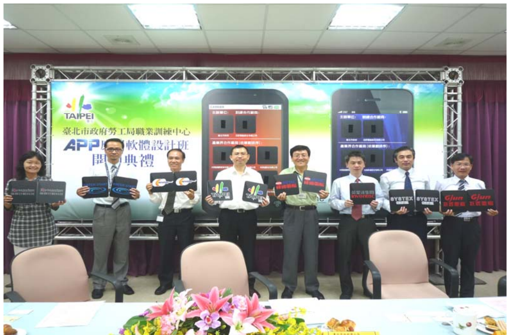
照片 8:APP 開訓典禮