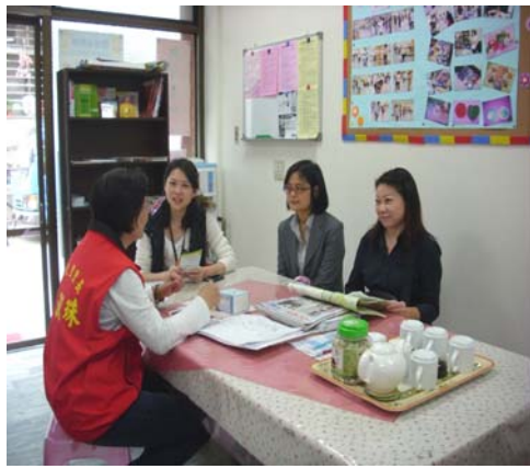
拜訪各個區里長辦公室及議員服務處