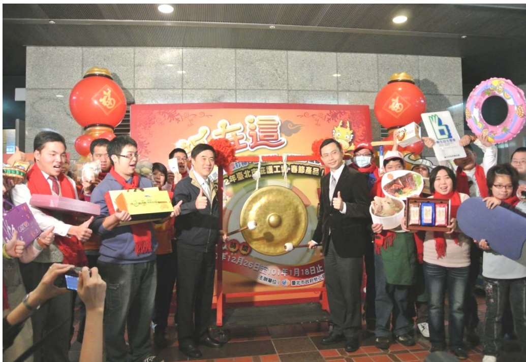
照片 12：「龍在這」庇護工場春節活動

理「臺北市府支持訂購庇護工場產品競賽活動」，創造 701 萬 1,570 元營業額（4~8 月份）。100 年度補助臺北市身心障礙福利機構團體、醫院等 37 個單位，辦理身心障礙者就業促進服務方案，共計 45 案，服務 773 人；另委託 9 家民間團體、機構辦理職業訓練共 25 案，提供服務 297 人。其中開辦「視障者電話值機服務人員養成訓練班」屬視障者就業的創新職種。