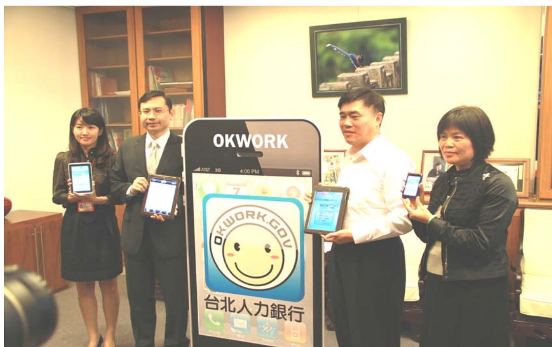
照片 16：台北人力銀行 APP 上線記者會