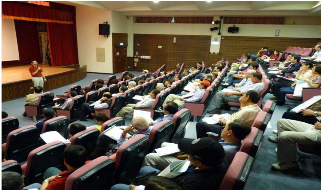
照片 9：100 年度與工會有約座談會活動剪影

為廣徵勞工意見，瞭解工會需求，於 100 年 10 月 13 日及 10 月 17 日假翡翠水庫舉辦基層勞工座談會，二場次共計 162 人參加，會中所聽取之建言將作為本局未來施政措施之參據。