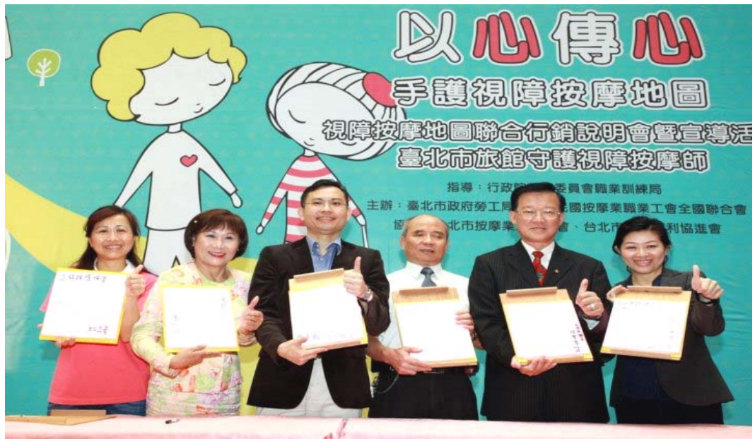
照片 4:以心傳心，手護視障按摩地圖暨臺北市旅館業攜手守護視障按摩師