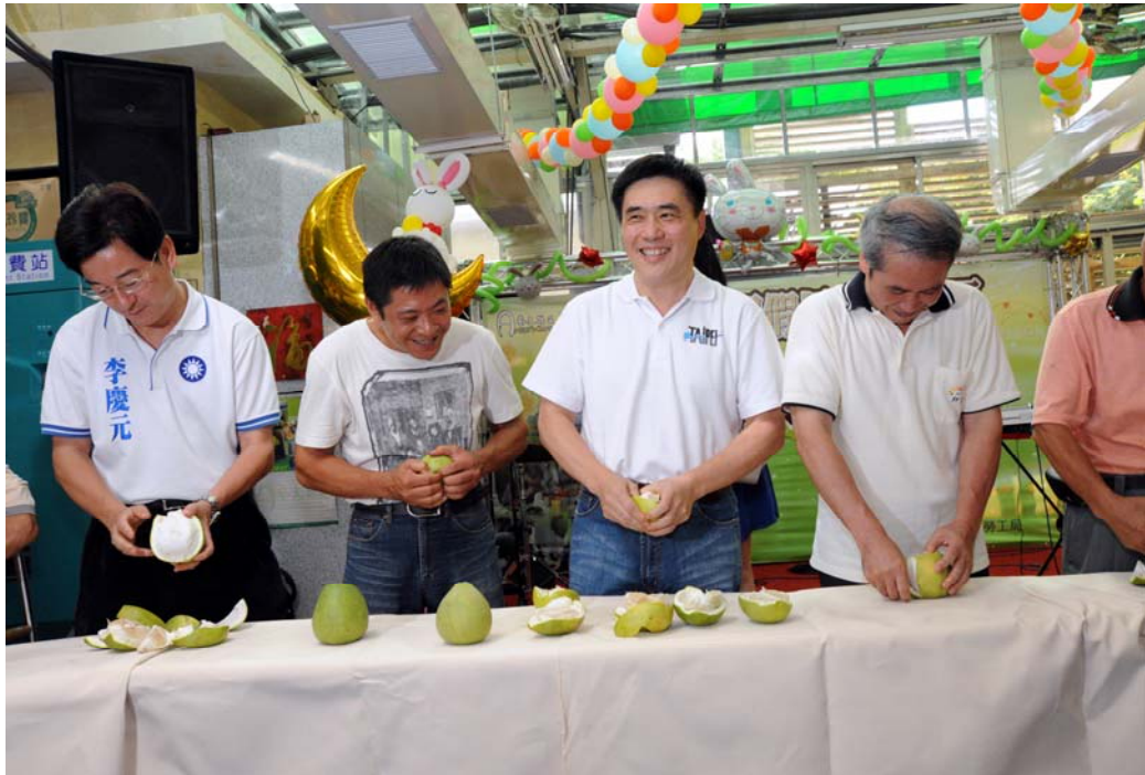
照片 3:臺北市建國假日藝文特區中秋節特別活動 (宣布免收租金及回饋金)