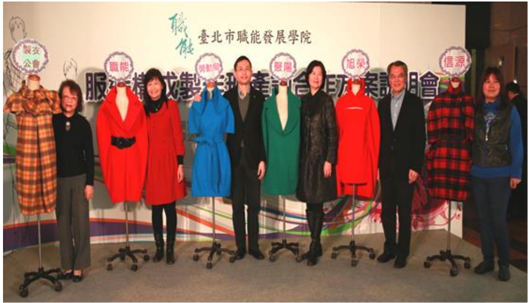
照片 21：服裝構成製作班產訓合作方案說明會