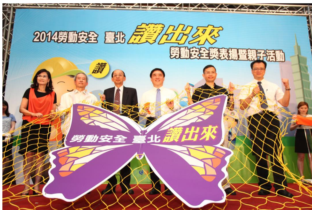
照片 8：臺北市勞動安全獎表揚暨親子活動

及勞工朋友等計 300 餘人共襄盛舉。活動除頒發臺北市勞動安全獎外，另安排工安活動攤位體驗、親子互動攤位、勞安行動劇表演及親子勞安裝備走秀。另為彰顯勞動安全之重要性，配合本活動特別舉辦「2014 臺北市勞動安全攝影比賽」，得獎者除接受郝市長頒獎外，作品並於現場公開展覽。