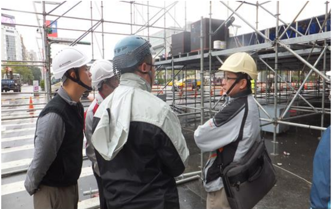
照片 16：103 年臺北市跨年晚會舞臺搭設檢查