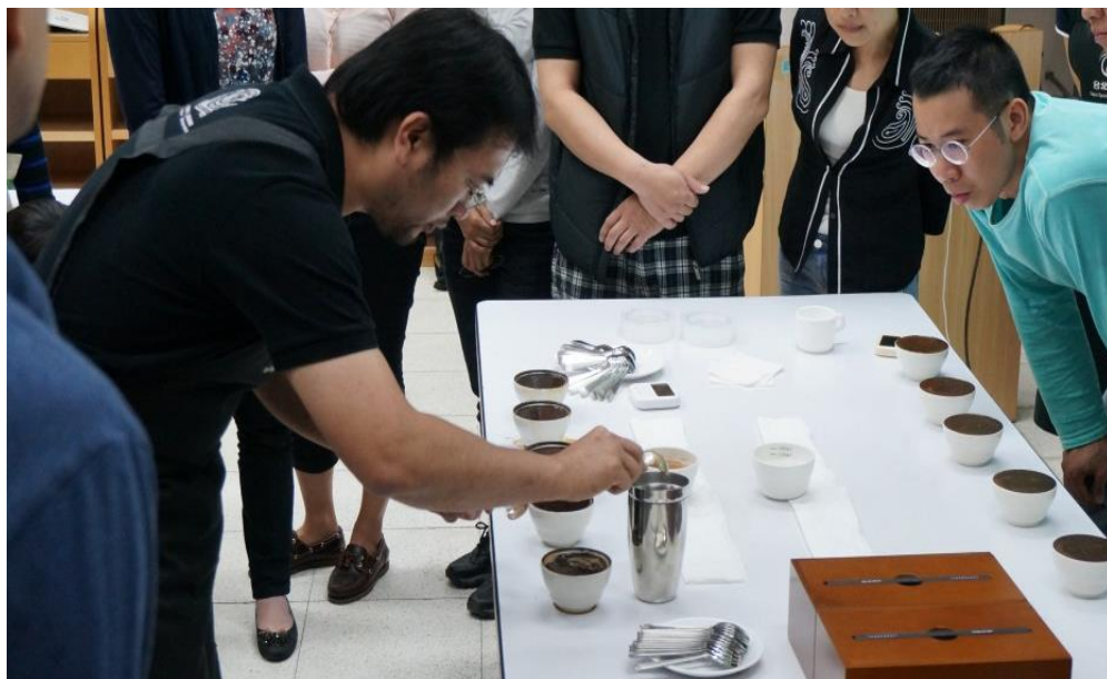
照片 10：「精品咖啡師班」課程紀錄

為發展本市城市特色，培育創新特殊職能類別，妥適辦理特殊職能開發活動，特訂定「特殊職能開發活動要點」。推出精品咖啡師評定，積極拜會與邀集相關專家學者，於 3 月 3 日辦理座談會，凝聚評定指標共識及評定規劃等事宜，另「精品咖啡師」職能進修 120 小時課程於 4 月 1 日開訓，計 29 人參訓，6 月 10 日結訓。