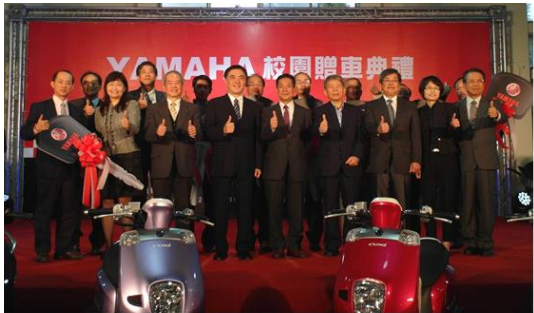
照片 22：103 年 3 月 12 日機車捐贈儀式

台灣山葉機車工業股份有限公司以實際行動支持本市發展職能培育，於 3 月 12 日捐贈 5 輛重型機車，強化本市職能發展學院教學設備，提升學員學習成效，促使職能培育多元發展、更能貼近產業需求，並藉由技職教育培養優秀技職人才，再造經濟成長。