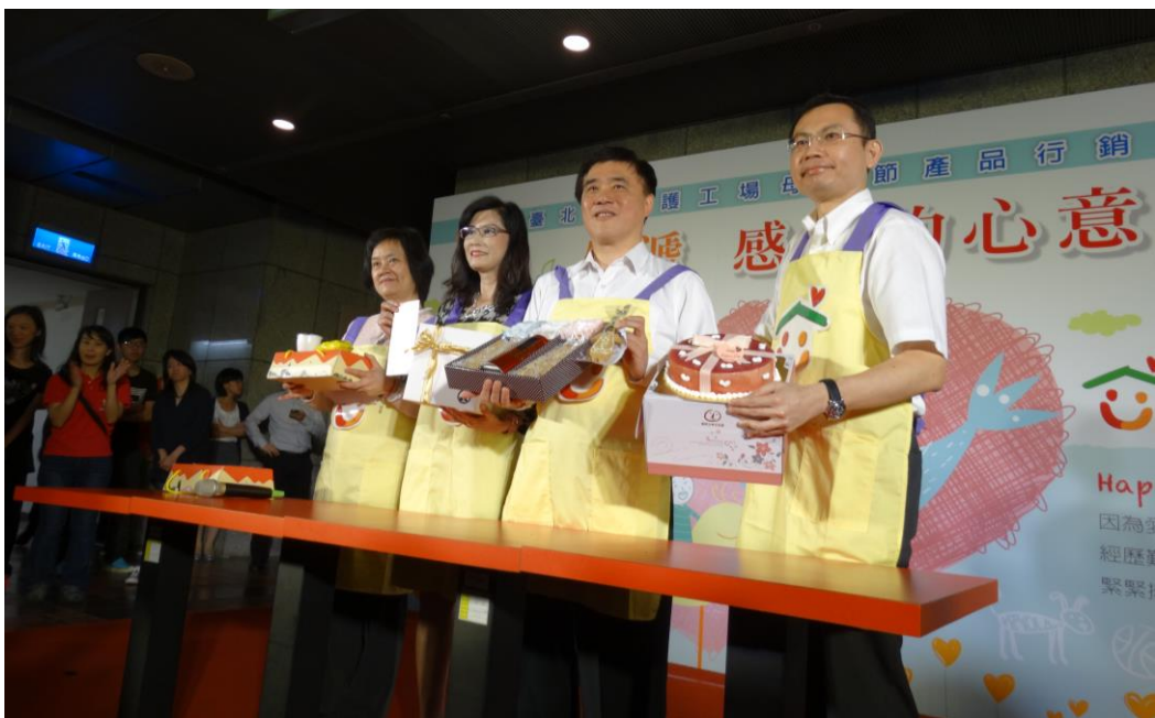
照片 18：「庇護工場母親節產品宣導記者會」