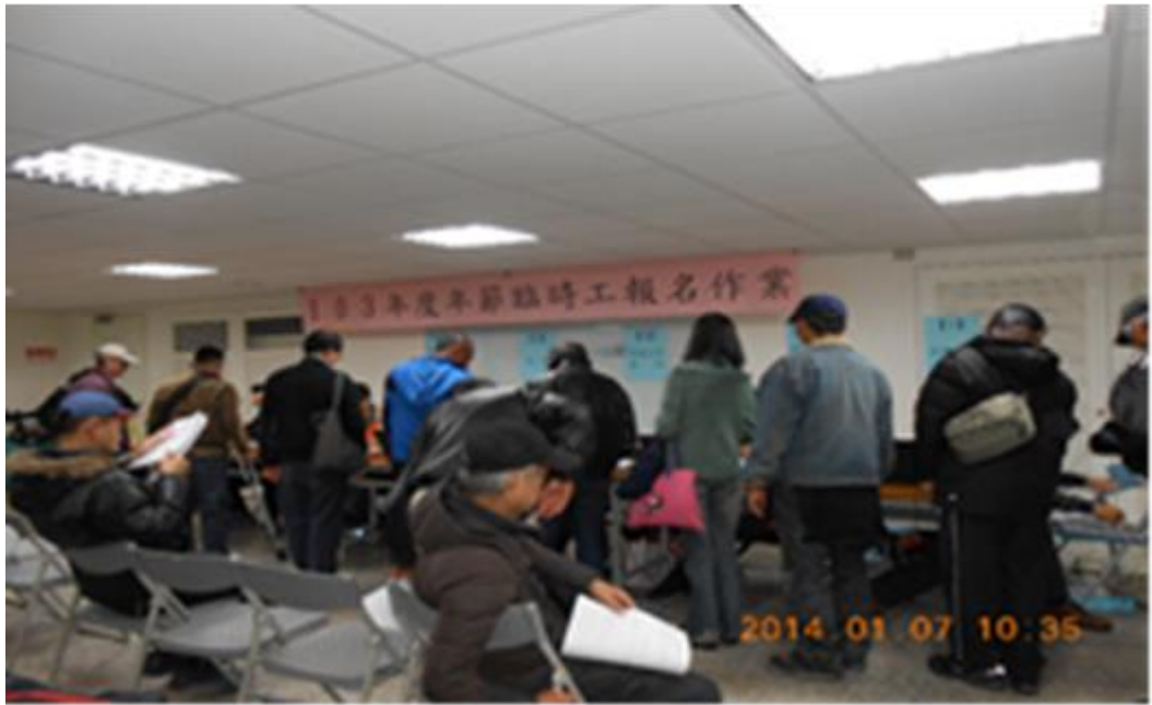
照片 15：103 年 1 月 7 日年節臨工報名作業

「臺北市遊民安置輔導自治條例」於 103 年修正通過後，將對遊民關懷觸角擴大至對弱勢族群之關懷與照顧，對於年節臨工專案之推動，今年度名額從 200 人增至 400 人，透過提高職缺數協助更多經濟弱勢民眾，同時藉此臨時工作增進遊民工作意願，為重返職場預作準備。實際上工人數計 251 人。進行後續就業服務與關懷追蹤，計 63 人就業，就業率 25.1%。預計於中秋節辦理第 2 梯次派工事宜。