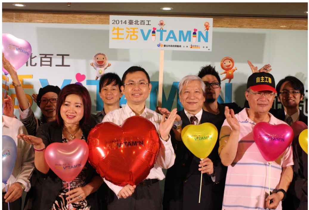
照片 5：2014 臺北百工—生活維他命：心靈 UP 勞動文化活動」開跑記者會