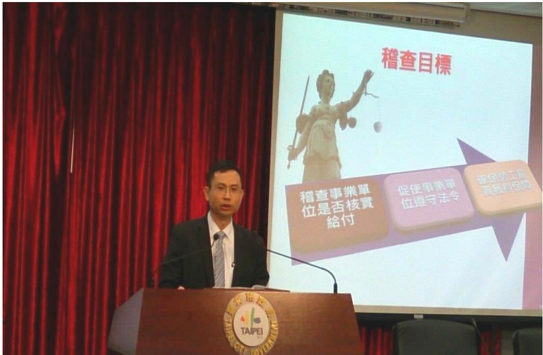
照片 1：啟動「安薪」專案-勞動檢查記者會