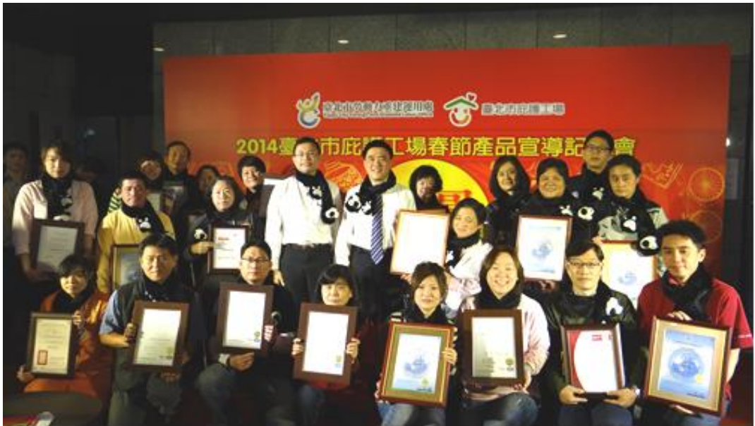
照片 17：「臺北市庇護工場春節宣導記者會」