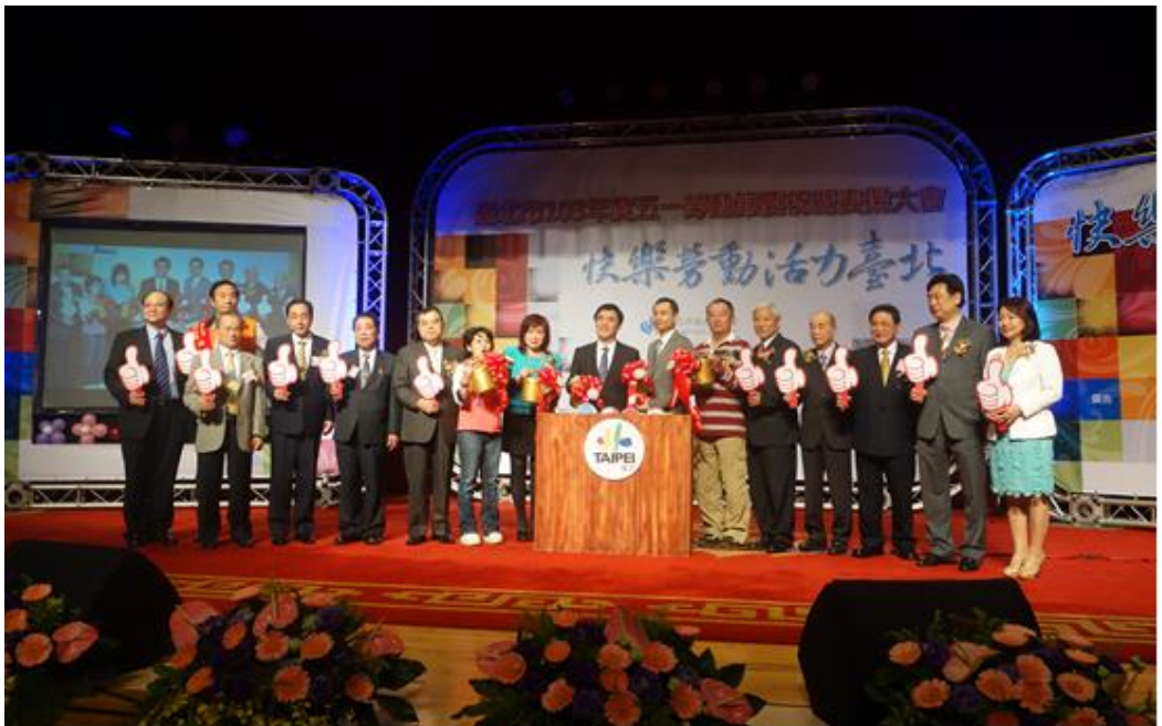
照片 7：臺北市 103 年度五一勞動節慶祝暨表揚大會

工會、優秀工會會務人員、優秀勞工、協辦健康勞工鳳凰計畫之工會及醫院等 5 個獎項，共計 375 個得獎者及單位，會中安排表演節目及摸彩，並於會後舉辦勞工之夜餐敘，藉由本活動鼓勵本市勞工發揚敬業精神與表達對勞工關懷與感謝之意。