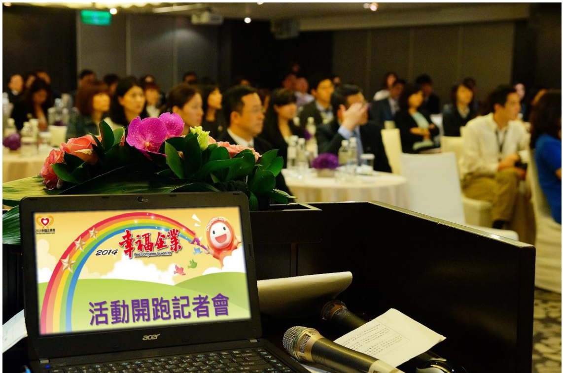
照片 13：2014 第四屆幸福企業獎活動開跑記者會暨幸福企業學院見面會

為延續與傳承幸福企業精神，於 5 月 5 日假臺北晶華酒店 4 樓，舉辦「2014 第四屆幸福企業獎活動開跑記者會暨幸福企業學院見面會-『幸福學堂，傳承分享』」活動，邀請第三屆獲「幸福企業獎」之「台灣微軟股份有限公司」與企業代表，分享優質企業幸福秘訣，探討成功企業應如何照顧員工、打造幸福工作環境，視員工為打拼夥伴，同心協力與企業共創經濟成長。