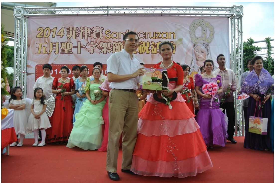
照片 20：「2014 菲律賓聖十字架節慶祝活動—Santacruzán」活動