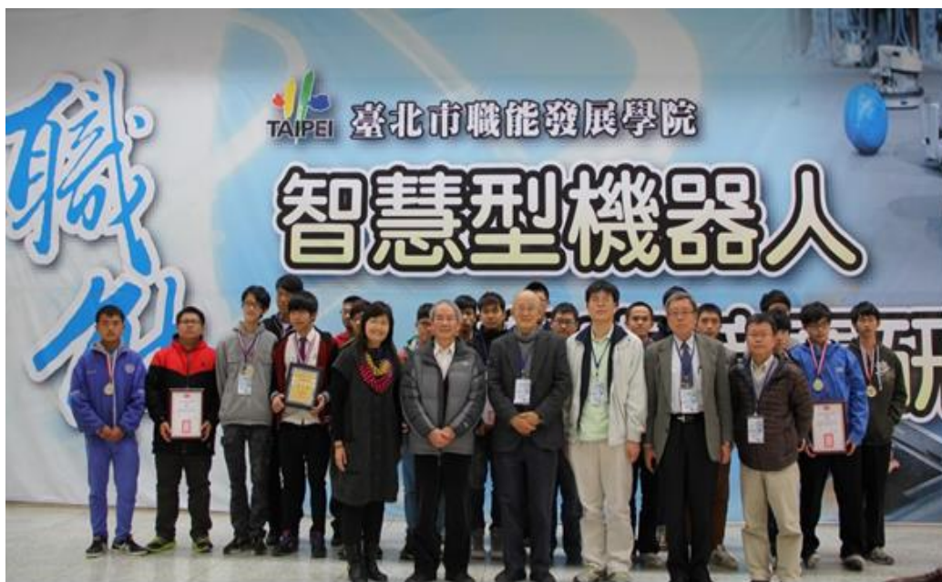
照片 23：103 年 3 月 21 日智慧型機器人觀摩競賽 研習

盃「智慧型機器人觀摩競賽研習」，藉由實作指導及競賽研習，培養學員創新思考能力，建構多元適性學習目標以提升教學品質，計有來自花蓮、蘇澳、宜蘭、臺北、苗栗等 17 支學校隊伍熱情參與。