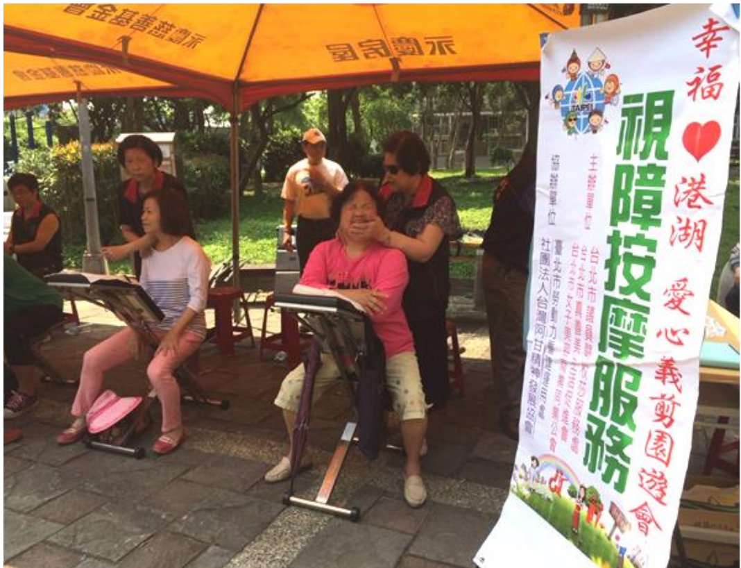
照片 19：「愛心義剪園遊會視障按摩推廣活動」