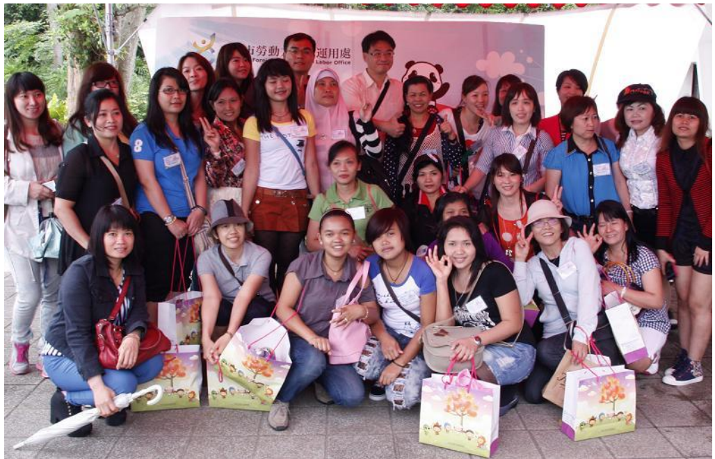
照片 6：外勞雇主『熊』麻吉—有『圓』來相會」活動

為增進外勞朋友以及雇主之間的良性互動，本市勞動力重建運用處於4月20日假臺北市立動物園，舉辦「外勞雇主『熊』麻吉—有『圓』來相會」活動，提供外勞朋友們假日活動去處，帶領大家親自體驗可愛貓熊旋風。