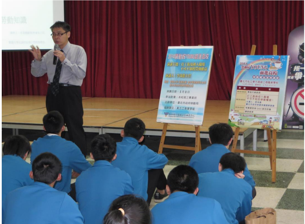
照片 2：「勞動好 YOUNG 前進高校」勞動權益講座

計入畢業學分（2 學分），提供大學生學習具實用性之勞動法令，受益人數為 34 人。