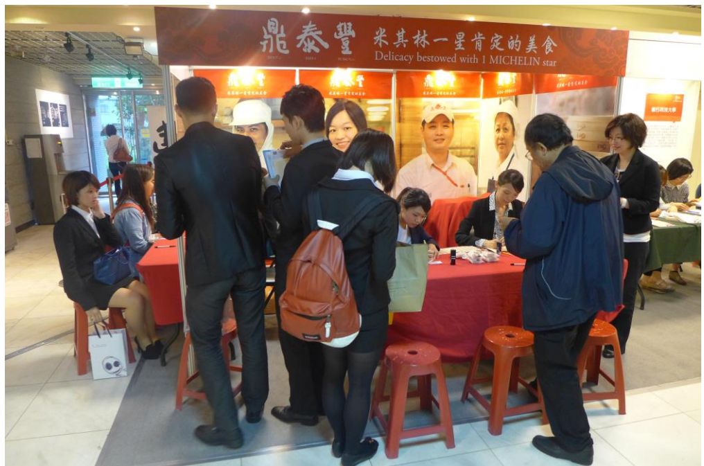
照片 9：學而實習之 2014 職場體驗實習博覽會

為協助青年朋友提升就業能力，本市就業服務處臺北青年職涯發展中心(TYS)於5月3日舉辦全國首創以「職場體驗實習」為主題的「學而實習之 2014 職場體驗實習博覽會」。此次實習博覽會邀請台灣微軟、台新金控、鼎泰豐、三井日本料理及雄獅旅行社等 49 家企業與學校參與，共有 1,291 名同學參加，在學青年可直接與企業進行面試媒合，為國內青年職涯發展開啟嶄新紀元！