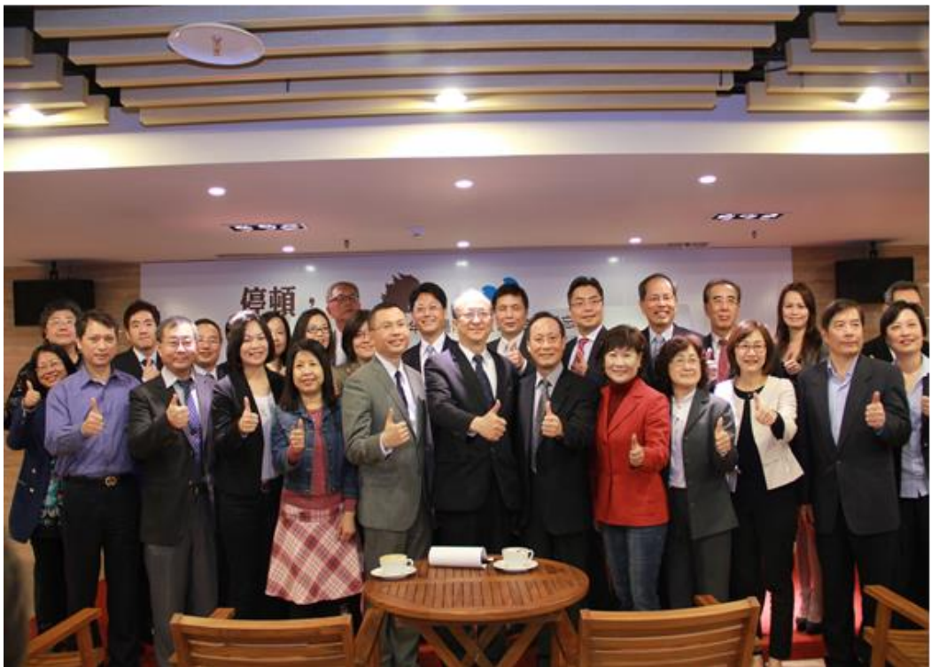
照片 3：103 年 3 月 24 日臺北青年職涯發展中心開幕

升就業競爭力。截至 6 月底完成職業適性測驗計 822 人，進行青年個別諮商計 255 人；辦理職涯 Tour 執行計 30 場次，參加學生計 1,115 位；舉辦就業相關講座計 10 場，參加人數計 1,090 人，核心業務總服務人次計 6,679 人次。