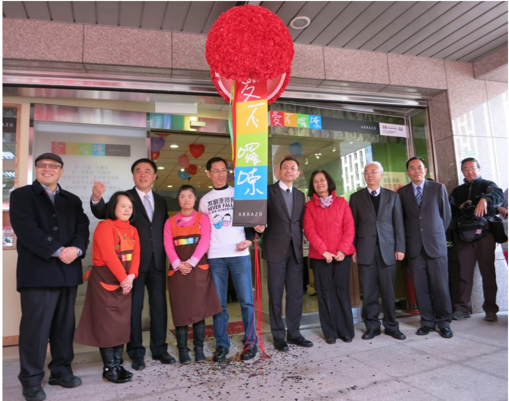
照片 12：「愛不囉嗦庇護工場」開幕