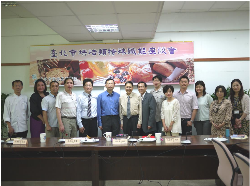
照片 11：臺北市烘焙類特殊職能座談會

於 4 月 28 日假本市職能發展學院行政大樓 3 樓會議室舉行，會中邀請烘焙相關領域專家學者及業界代表，就本市可發展之烘焙類特殊職能項目及需具備之技能指標進行探討並提供意見，以作為未來辦理烘焙類特殊職能開發活動之參考。