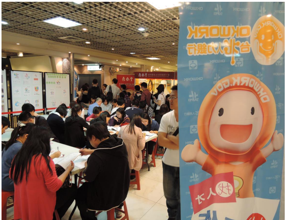
照片 14：103 年 3 月 29 日「OKWORK！馬上加薪」 就業博覽會