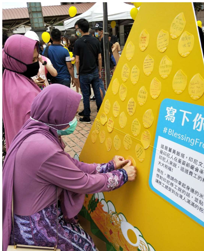
照片 1：東南亞故事派對系列活動-印尼開齋節 留言祝福活動