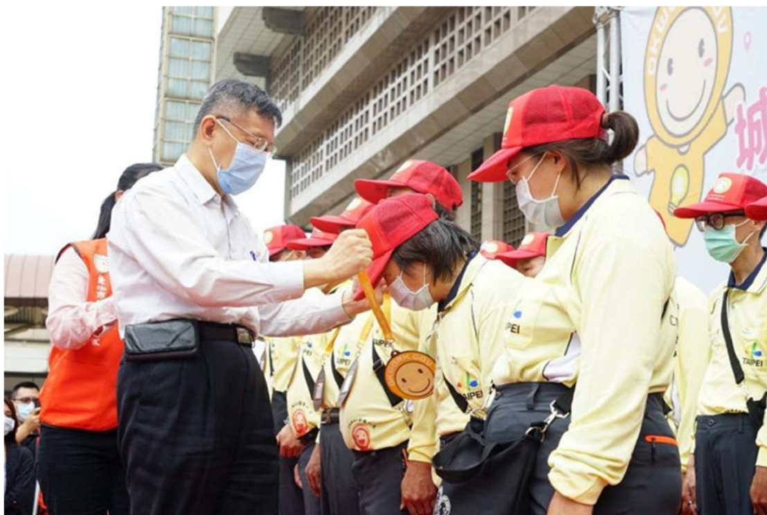
照片 10：城市引導員授證授牌暨宣誓啟動儀式