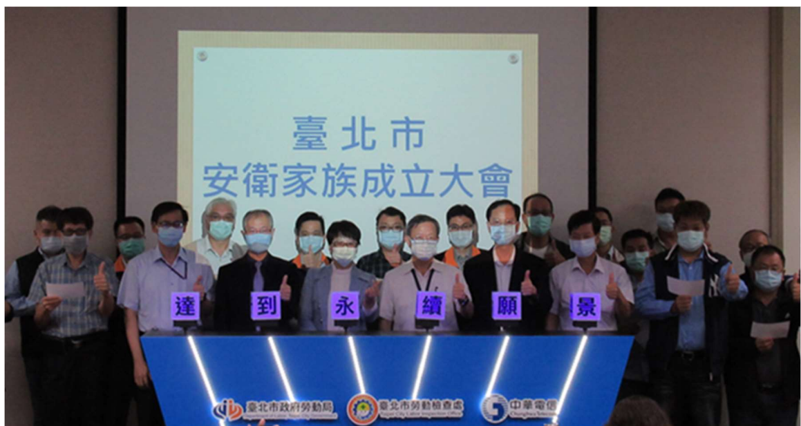
照片 12：臺北市網通永續安衛家族成立大會儀式啟動

本局於 109 年 5 月 28 日成立「臺北市網通永續安衛家族」，同時與 1 家核心企業及 19 家家族成員辦理運作會議及經營者與主管集合訓練，本安衛家族是結合地方政府與中小企業共同推動職業安全衛生活動，目的希望藉由家族成員以經驗分享與互助合作模式，共同改善工作環境，並提升自主管理能力。