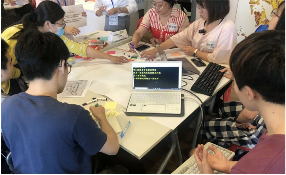
照片 11：《Let' s Chat》混搭公民咖啡館