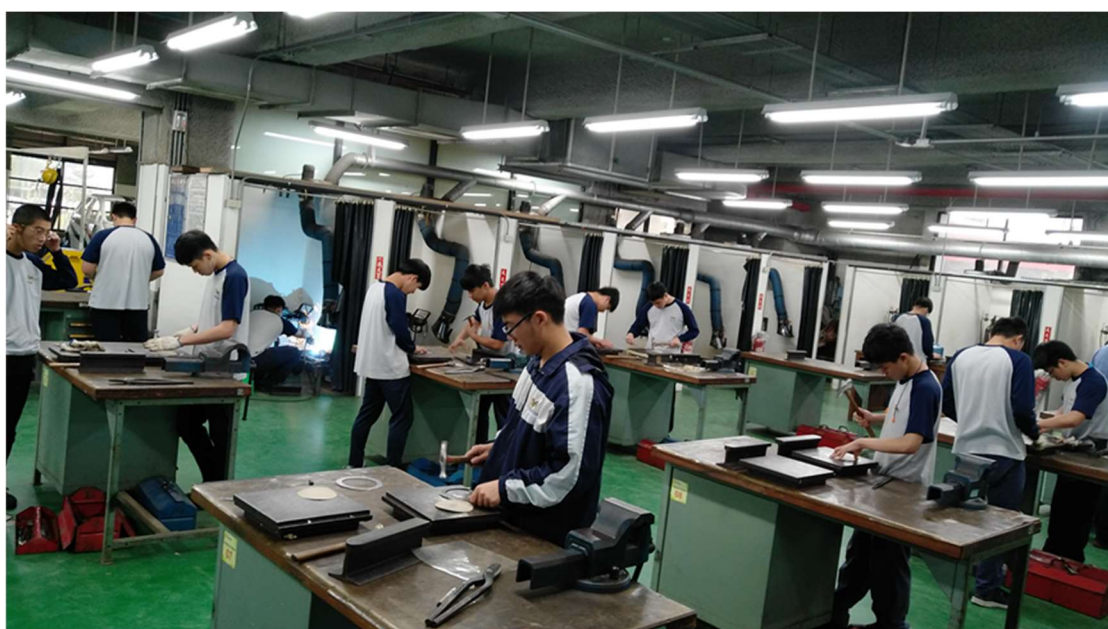
照片 5：「汽車板噴修護班」上課情形

(3) 與臺北市私立惇敘高級工商職業學校合辦之「汽車板噴修護班」，於 3 月 3 日開訓，6 月 12 日結訓，訓練時數 456 小時，培育人數 20 人。