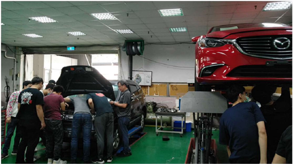
照片 6：「車輛維修產學訓專班」上課情形