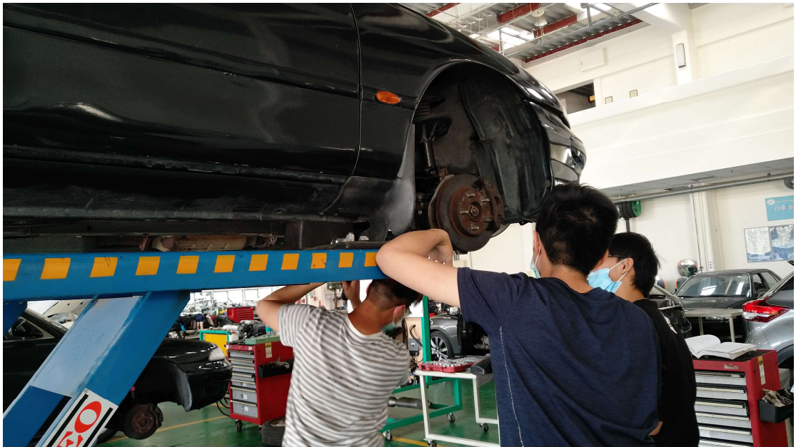
照片 3：「汽車實習學分班」上課情形