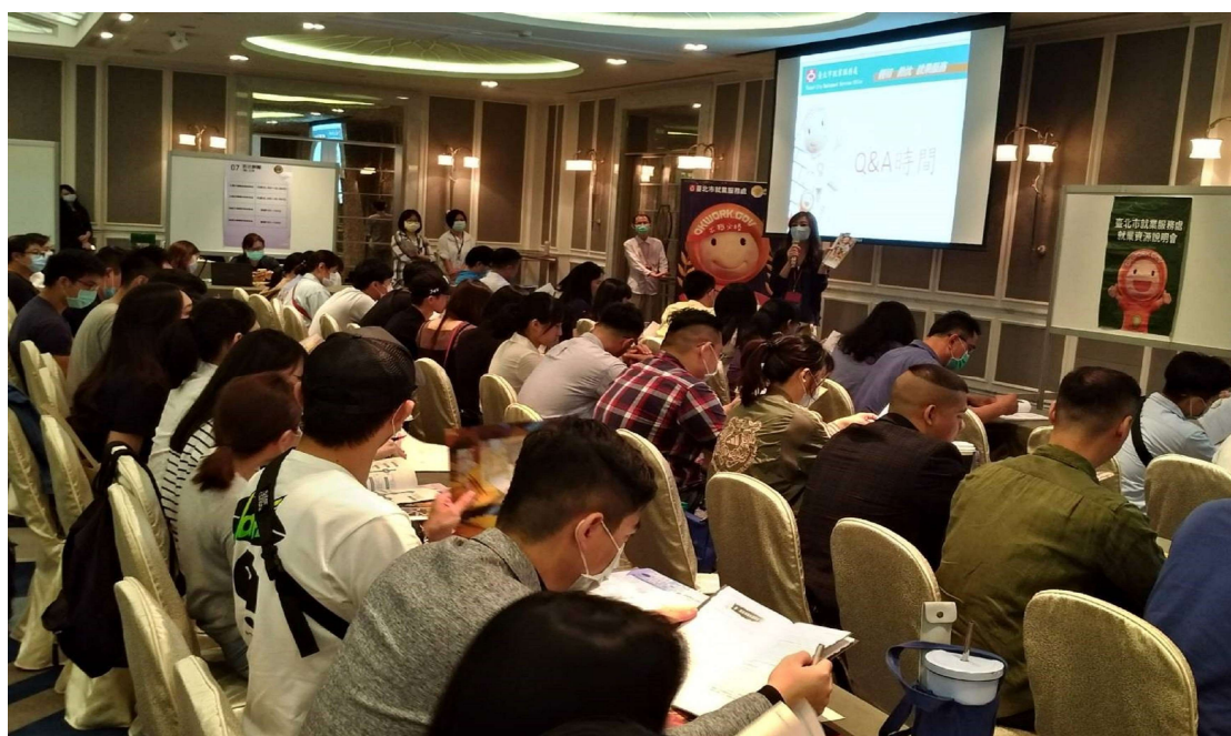
照片 9：文華東方酒店員工專案媒合會

(C) 109 年 6 月 15 日辦理文華東方酒店員工專案媒合會，共 30 家企業，釋出 111 筆職類，1,049 個工作機會，當日共 55 人面試，初步媒合 46 人，初媒率 83.6%。