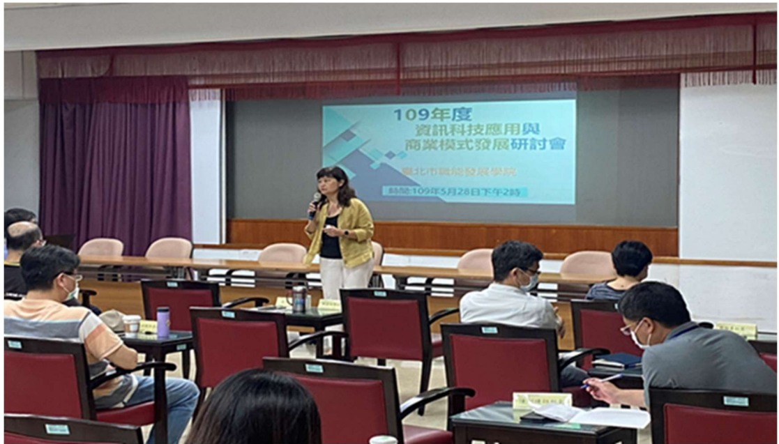
照片 7：資訊科技應用與商業模式發展研討會