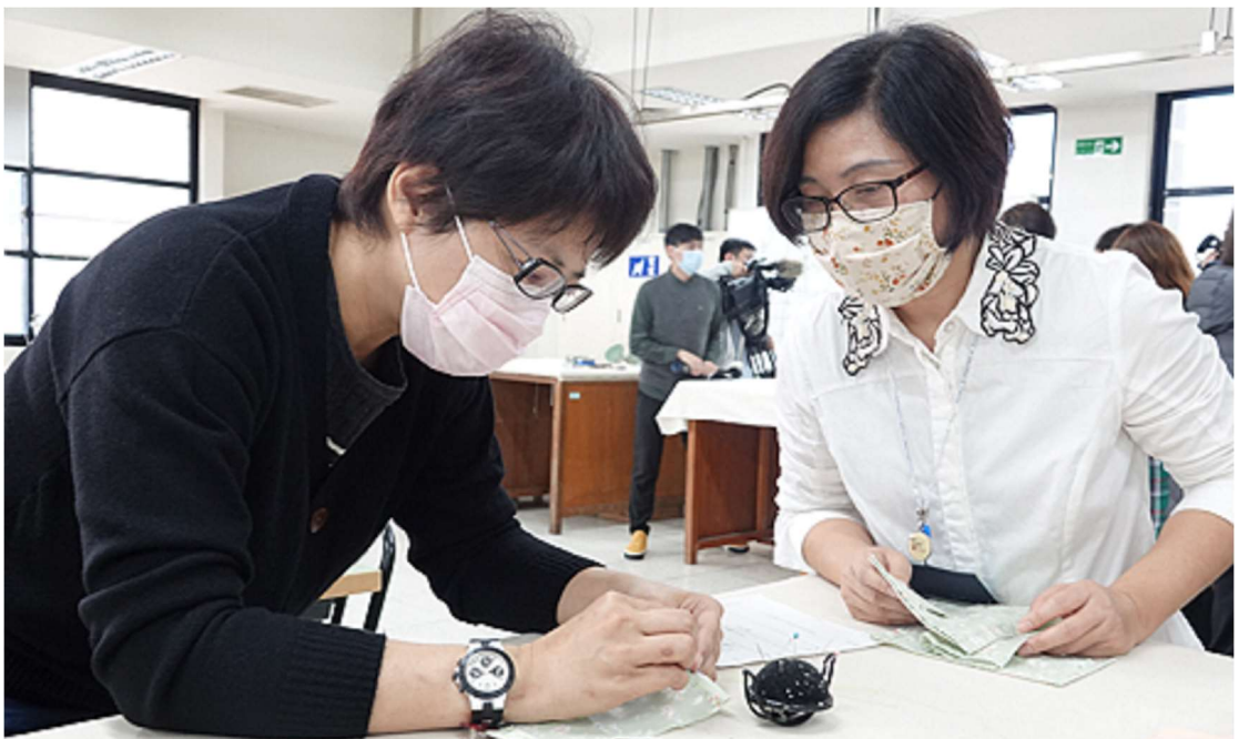
照片 8：「DIY 口罩保護套」課程製作口罩保護套