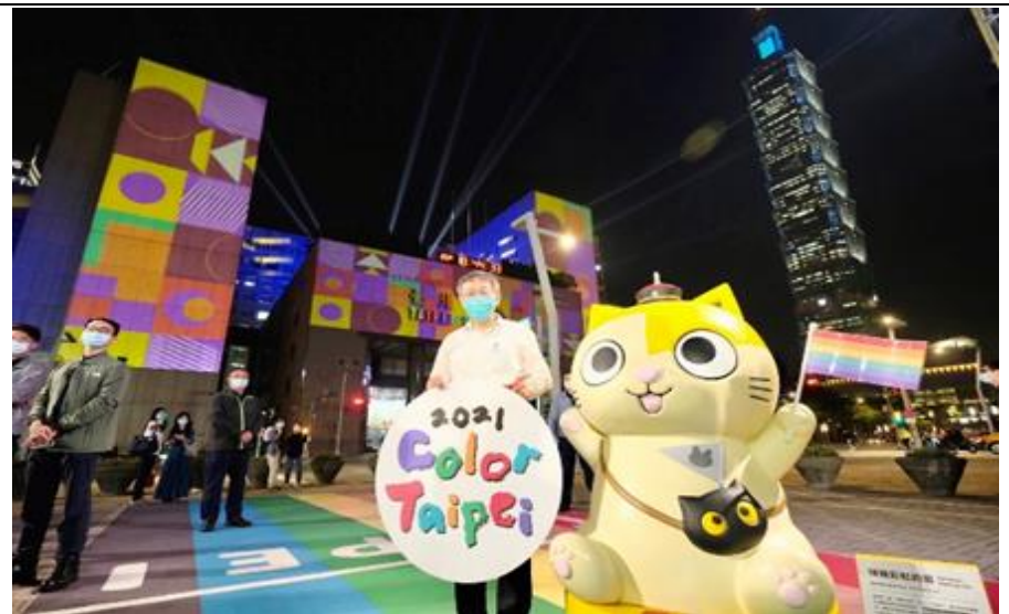
於市府前舉辦彩虹光雕秀(共10天)