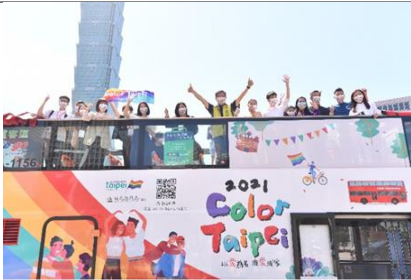
推出彩虹觀巴，共計30趟車次