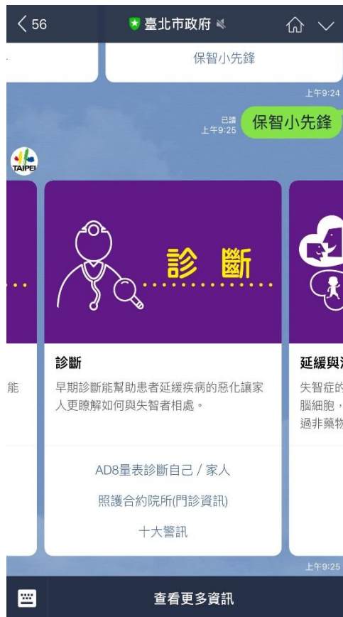
圖 2：失智症診斷量表