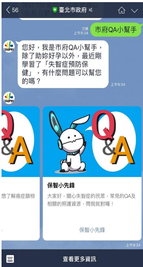
圖 1：「保智小先鋒」QA 小幫手