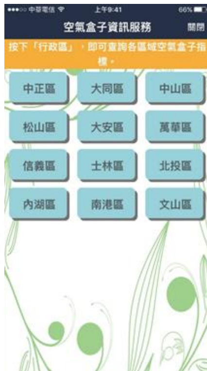
「空氣盒子資訊」服務訂閱首頁

政府資訊一般透過官方網站張貼，被動等待民眾連至網站觀看，訊息的觸擊率與即時性往往有所侷限。現在我們有了創新的服務，特別著重提供個人化與即時性的服務，讓民眾透過 LINE 通訊軟體，直接取得自己需要或有興趣的資訊，不必再從一堆資訊中辛苦找尋；只要訂閱這些服務，就可以定時收到周邊的空氣品質資訊，讓民眾知道是否適合出門，或是要採取哪些措施；而停班停課、開放紅黃線停車等有時效性的資訊，也能即時通知民眾，不再需要苦守電視盯著跑馬燈等待訊息。這樣的服務一推出，短短兩周就突破萬人訂閱使用，顯見這樣貼心便利的服務是民眾所需，讓民眾省下許多尋找資訊的力氣，並能即時得到第一手最新資訊。只要加入臺北市政府官方 LINE 帳號，就可以享有這樣的服務，歡迎大家踴躍使用。