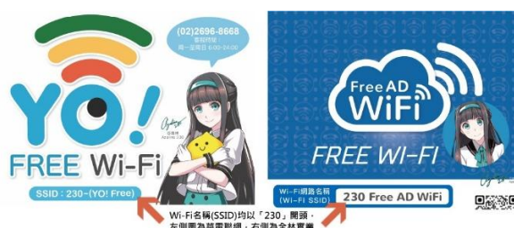
請認明「230」開頭的兩個 SSID 名稱。