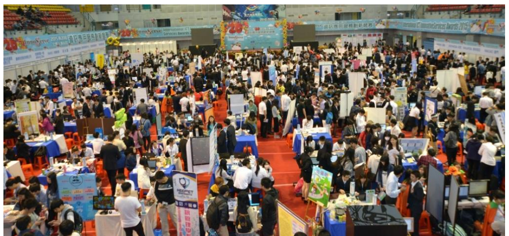
去(2015)年第 20 屆全國大專校院資訊應用服務創新競賽活動現場盛況

臺北市政府自 100 年起開始投入資料開放政策之推動，列為亞洲第二、臺灣第一推動政府資料開放(Open Data)的城市。為推廣 Open Data 加值運用及促進資通訊軟體發展，臺北市政府資訊局已經連續四年參與資訊應用創新競賽，並設立「臺北生活好智慧創新應用組」競賽獎項，鼓勵學子發揮創意，齊心創造新的應用服務，讓臺北市成為更便利的智慧城市；歡迎競賽隊伍使用「臺北市政府資料開放平台」( http://data.taipei )上的資料集，發揮混搭創意，開創讓市民生活更智慧更便利的服務。活動詳情請至本競賽活動網站查詢： http://innoserve.tca.org.tw/ 。