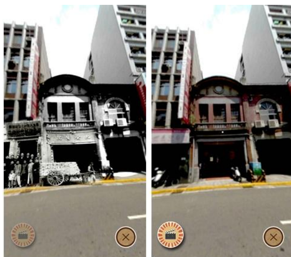
大安醫院舊址重現畫面