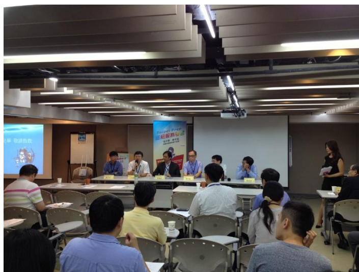
經驗分享、意見交流會場