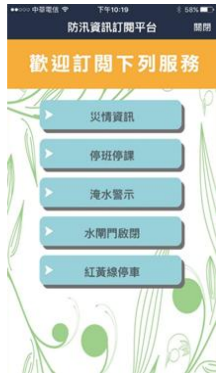
「防汛資訊訂閱平台」首頁