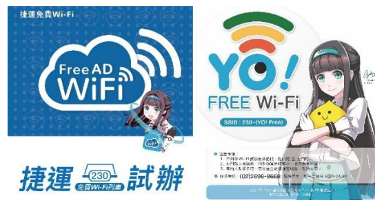
8 車站與 2 列車內皆會張貼「230」(圖中少女)海報，代表試辦點位。

自去(104)年推動「臺北無線網路聯盟」，整合政府與民間的免費 Wi-Fi 熱點，吸引 13 家民間業者加盟，在不支出公務預算的原則下擴增至約 3,000 處熱點。此次捷運 Wi-Fi 試辦案，本局與捷運公司將會持續追蹤試辦期間服務使用的情況，不僅作為市府在推動 Wi-Fi 業務的寶貴意見，也達到讓旅客體驗悠遊臺北的便利。