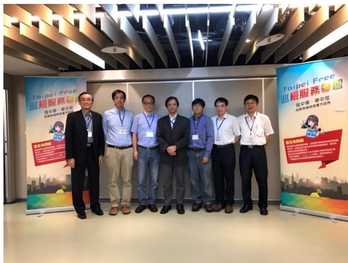
合作院校指導老師合影

各校試辦的成果與意見，都是作為本局未來推動無線網路服務重要的參考方向，相對於學生而言，從對於無線網路的理論認知轉換到親身體驗實際走動的測試，為臺北市無線網路課程寫下新篇章！有興趣的學校，也可以主動和本局連絡。