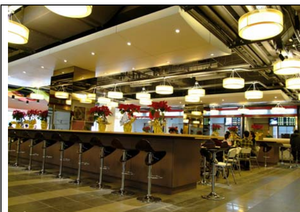
華山市場 2 樓