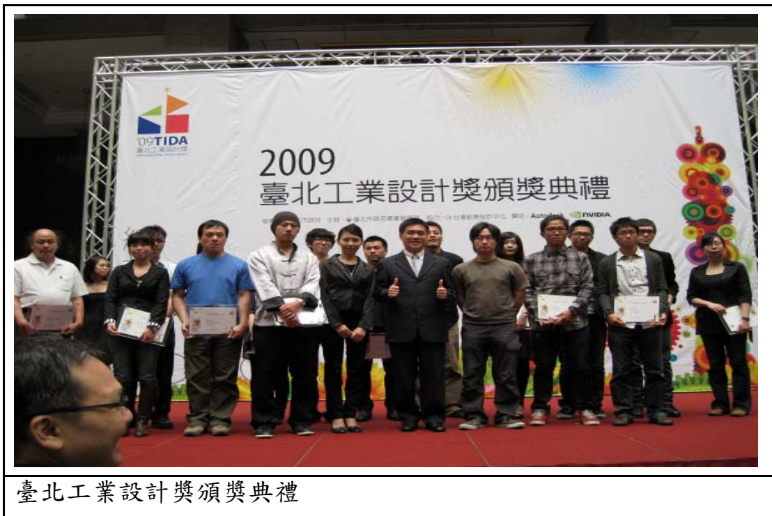
臺北工業設計獎頒獎典禮

賡續辦理 2009 臺北工業設計獎，並配合「2010 臺北國際花卉博覽會」舉辦以「綻放」為競賽主題，共有 943 件報名，較 97 年同期增加 295 件。