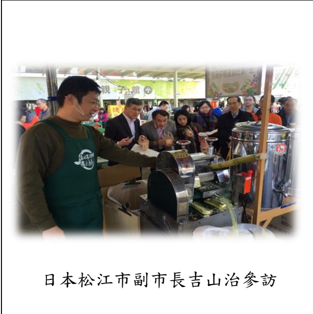
日本松江市副市長吉山治參訪