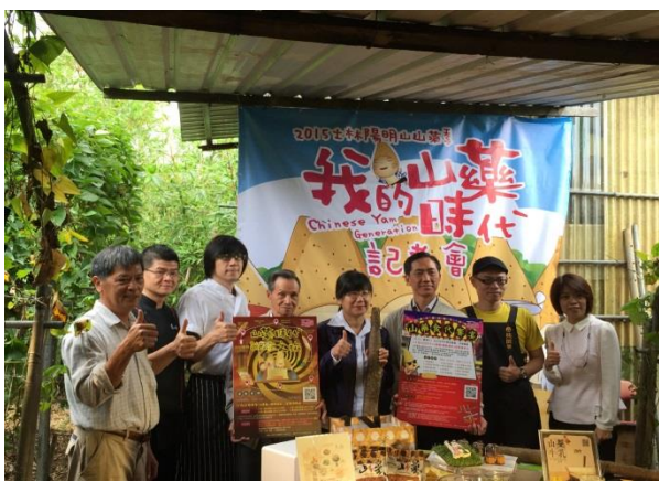
士林山藥季開幕記者會