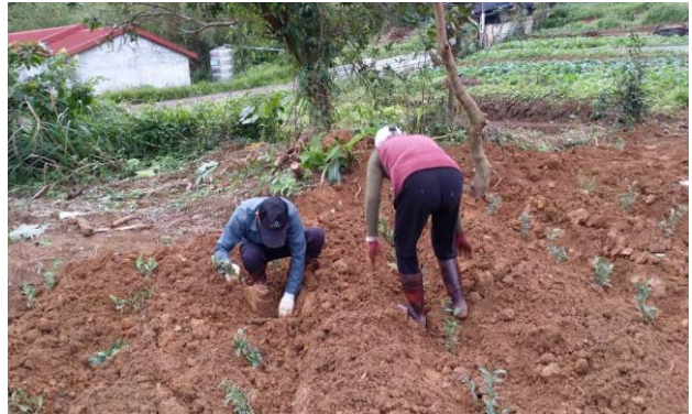
閒置農地活化(木柵地區)