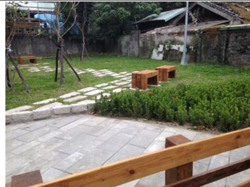
錦泰里基地-施作後