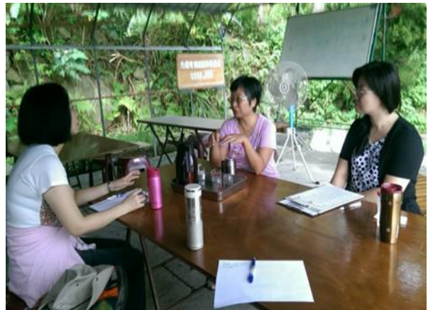
技術團隊實地輔導農戶