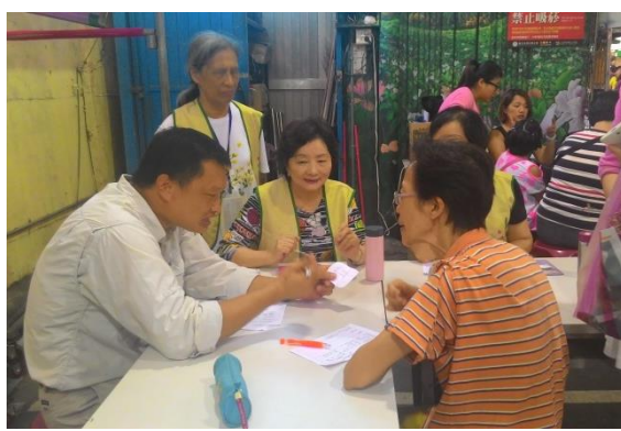
假日花市植物診所