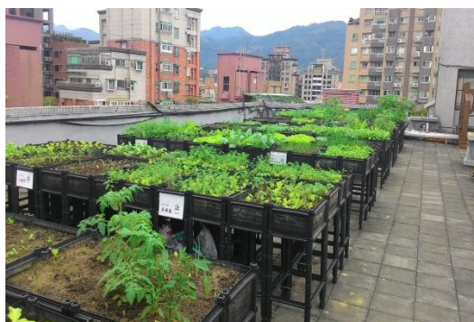
文山自費老人安養中心屋頂菜園