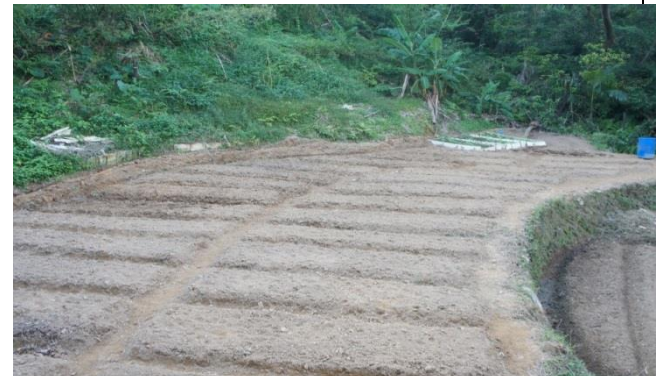
閒置農地活化(松山地區)