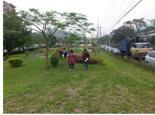
石潭里基地-施作後