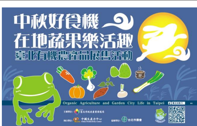
建國假日花市展售活動

104 年度辦理有機農產品展售會活動，共計 1 場次，約 3,000 人次市民參與，營業額約為 10 萬元，除教導市民認識有機農耕對於健康、生態環境的助益，行銷本市有機產業，也提供市民休閒活動空間、體驗有機農業生活。