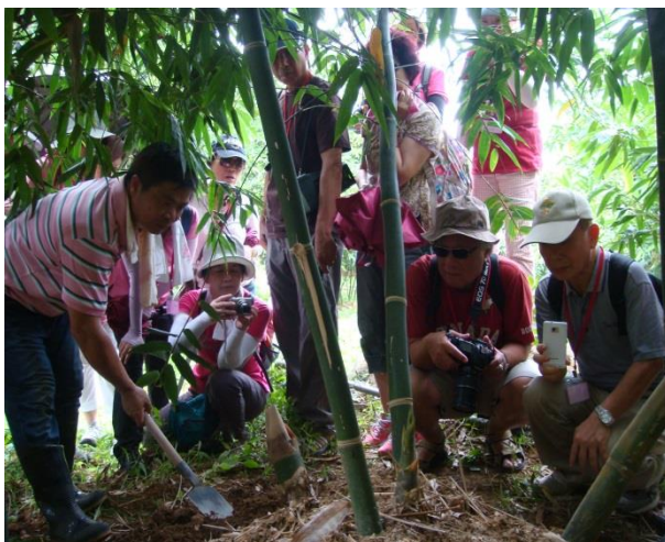
士林綠竹筍農園體驗活動