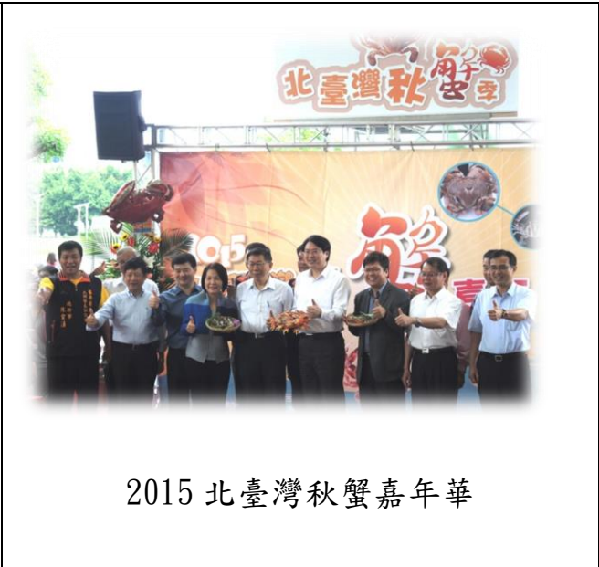
2015 北臺灣秋蟹嘉年華