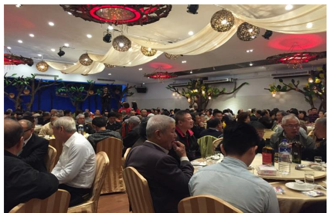
士林山藥饗宴活動