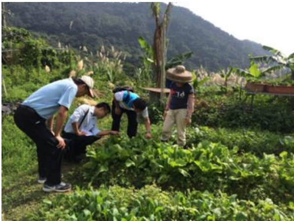
技術團隊實地輔導農戶

104 年「有機農業專業技術顧問團隊」實地輔導農戶，輔導期程長達 10 個月以上，累積輔導農民次數達 83 次。有機農業推廣輔導工作及培訓有機專業人才，舉辦系列有機農業培訓課程，共 26 小時，298 人次農民參加。