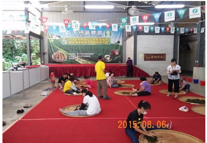
木柵紅茶製作教學