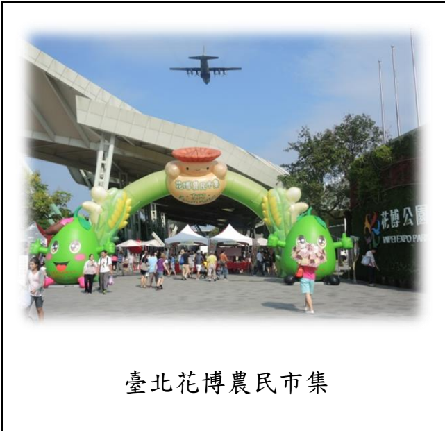
臺北花博農民市集