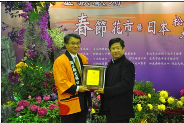
2015 春節花市日本松江、大根島牡丹花展本 局林局長與日本松江市副市長合照