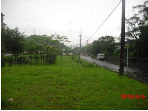
石潭里基地-施作前