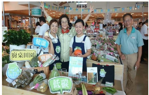
有機農產品展售會