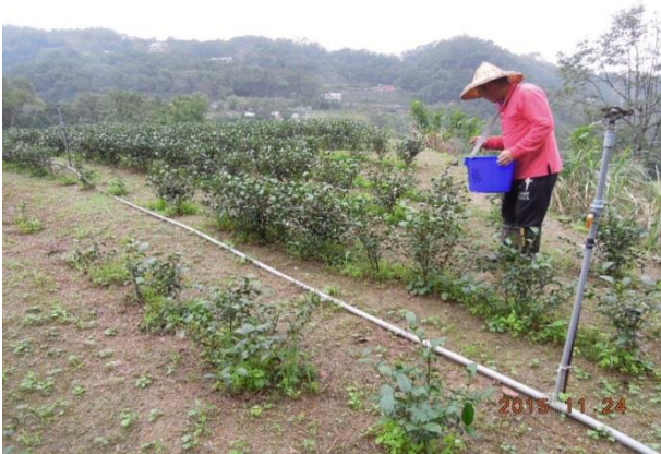
閒置農地活化(木柵地區)