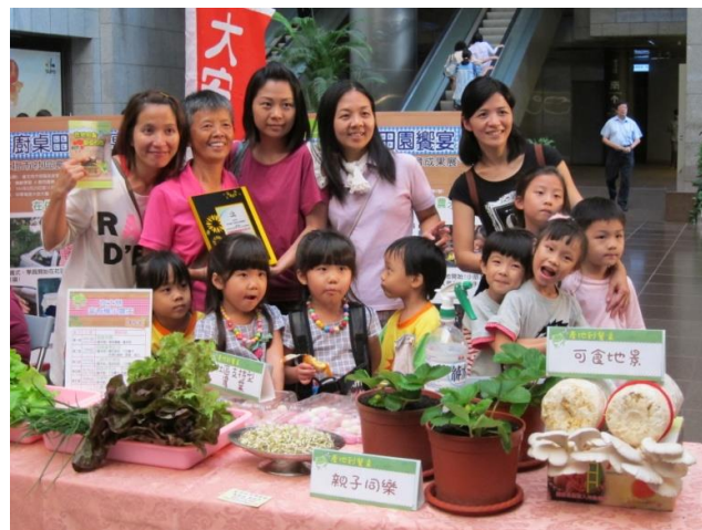
社區支持型農業推動