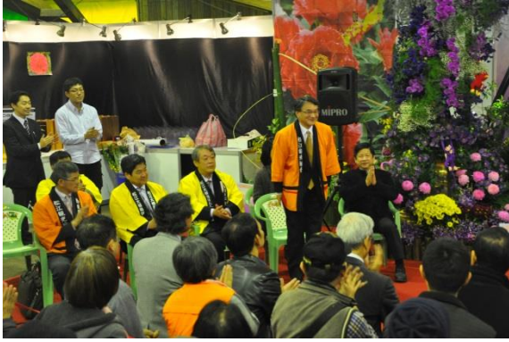
建國假日花市 33 週年慶活動開幕式