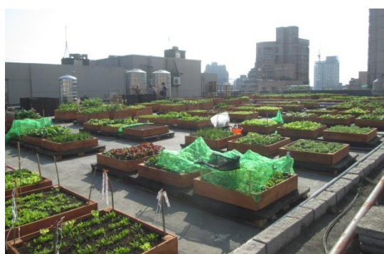
北投區行政中心屋頂菜園