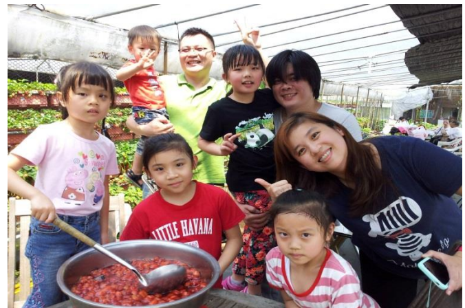
內湖草莓季觀摩活動