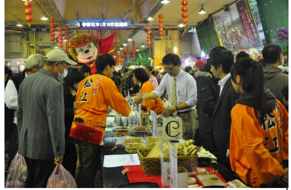
建國假日花市 33 週年慶活動