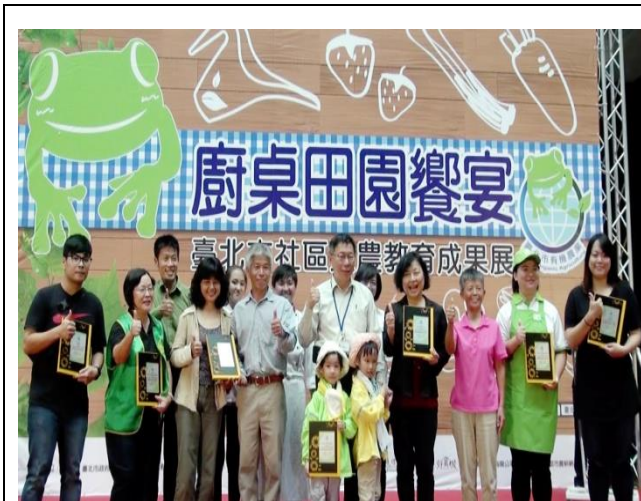
推動社區支持型農業