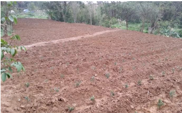
閒置農地活化(南港地區)