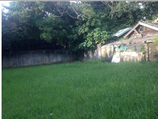
錦泰里基地-施作前