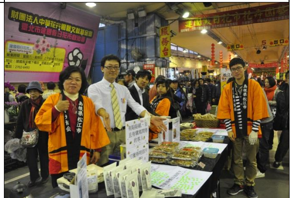
2015 春節花市日本松江、大根島 牡丹花展