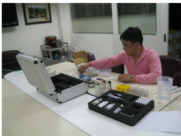
農藥殘留快速檢驗站工作人員檢驗 農產品農藥殘留

本局抽查本市市售標章農產品，104 年抽查有機農產品 1,042 件(標示檢查 727 件，品質檢查 315 件)，合格率 98.27%(18 件不合格)；抽查 CAS 優良農產品 97 件(標示檢查 57 件，品質檢查 40 件)，合格率 100%；抽查產銷履歷農產品 133 件(標示檢查 72 件，品質檢查 61 件)，合格率 100%，對於不合格案件已依法查處，共計罰鍰 72 萬元整。