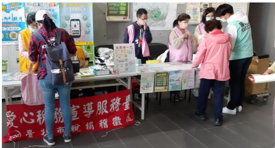
說明：元宵節活動-稅捐處及國稅局稅務宣導