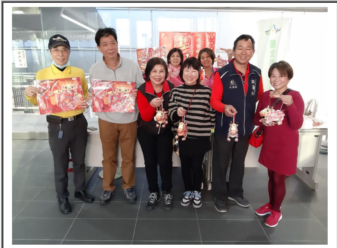
說明：元宵節活動-贈送小提燈與民同樂