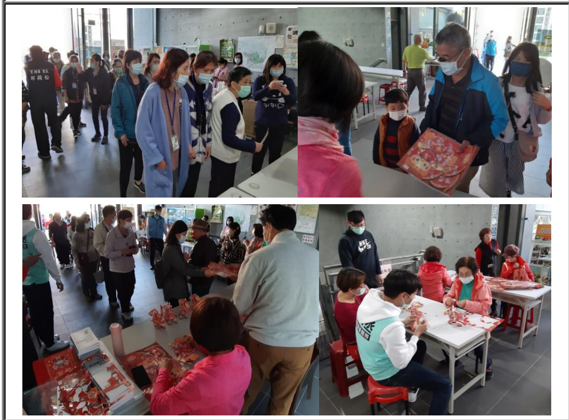
說明：元宵節活動-里民排隊領取小提燈