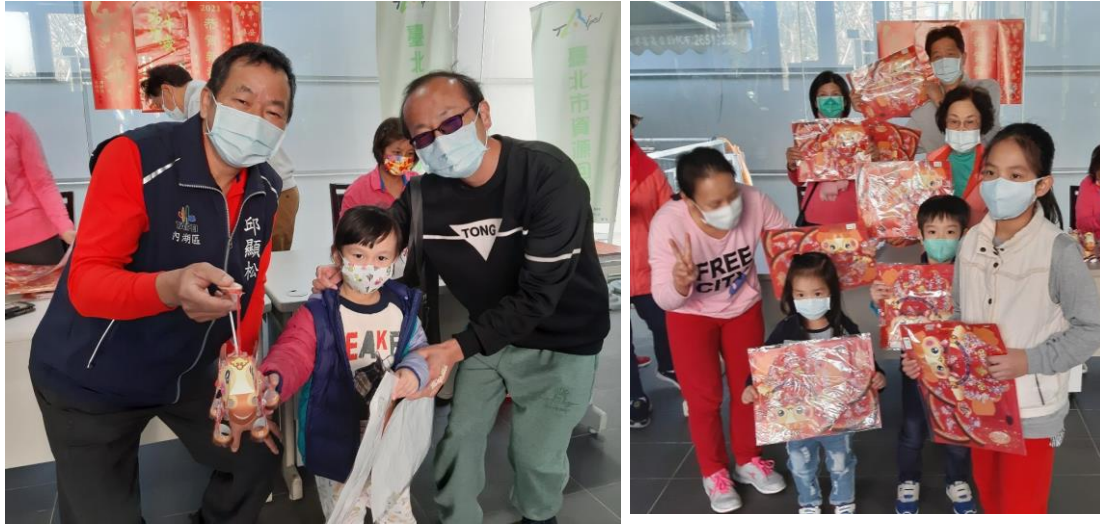
說明：元宵節活動-里長發放小提燈