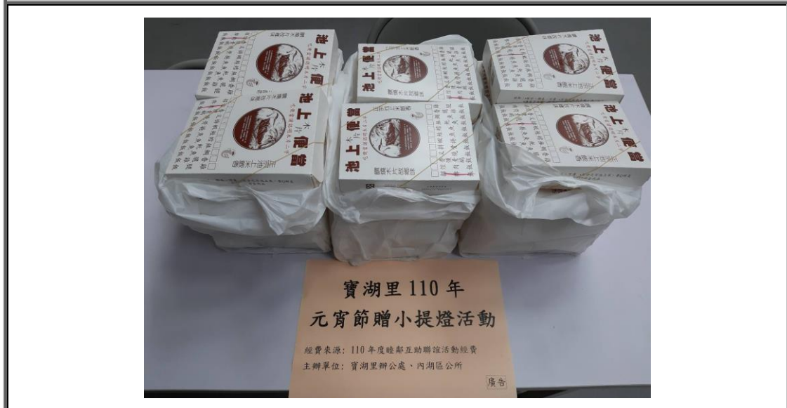
說明：元宵節活動-工作人員便當