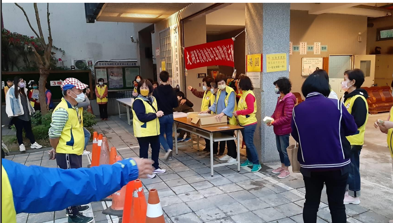
說明：發放里民燈籠及湯圓