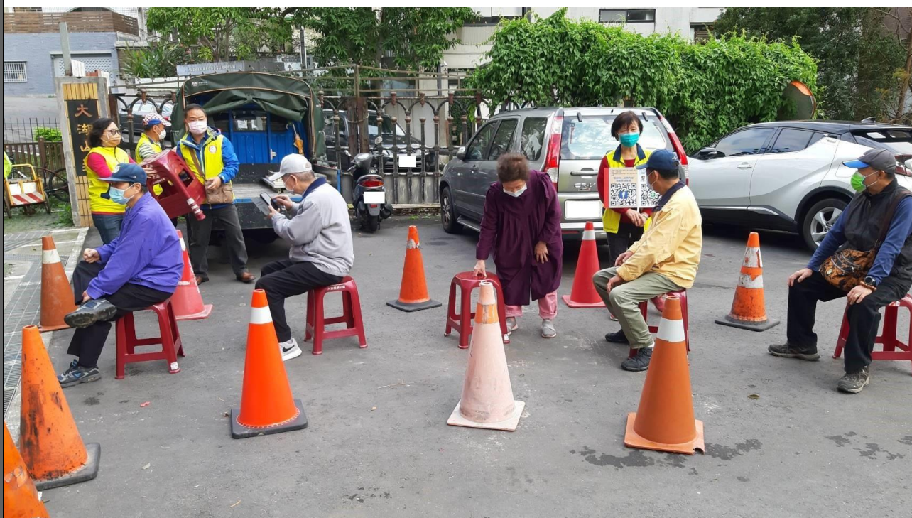
說明：里民排隊等候燈籠及湯圓發放