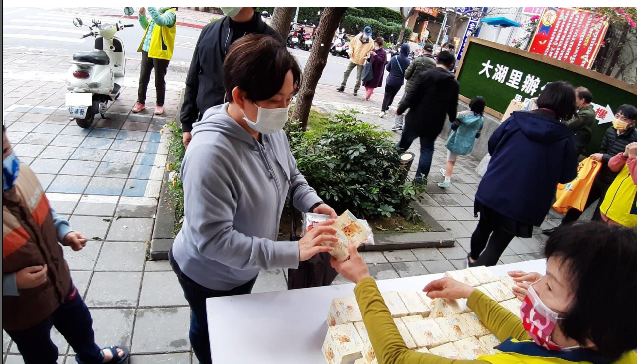
說明：發放里民燈籠及湯圓