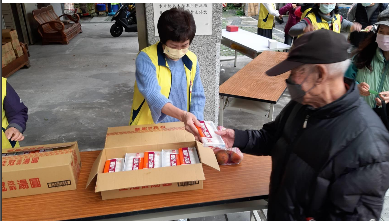
說明：發放里民燈籠及湯圓