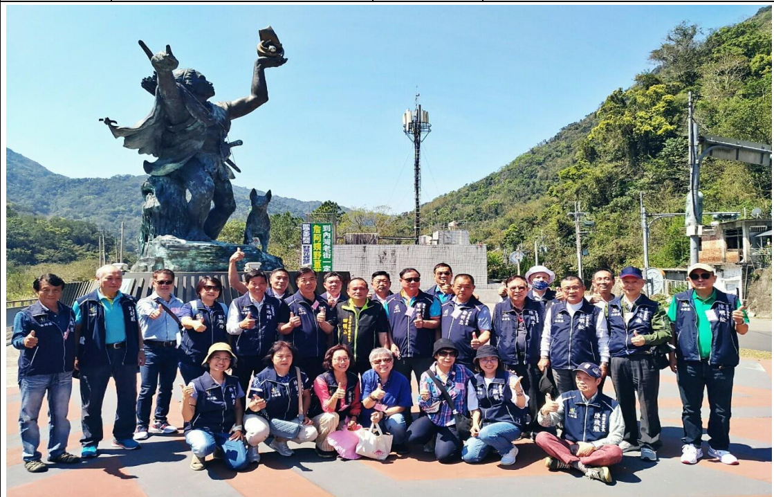
說明： 尖石鄉公所導覽尖石鄉地標。 地點： 尖石鄉公所 日期： 112.3.23