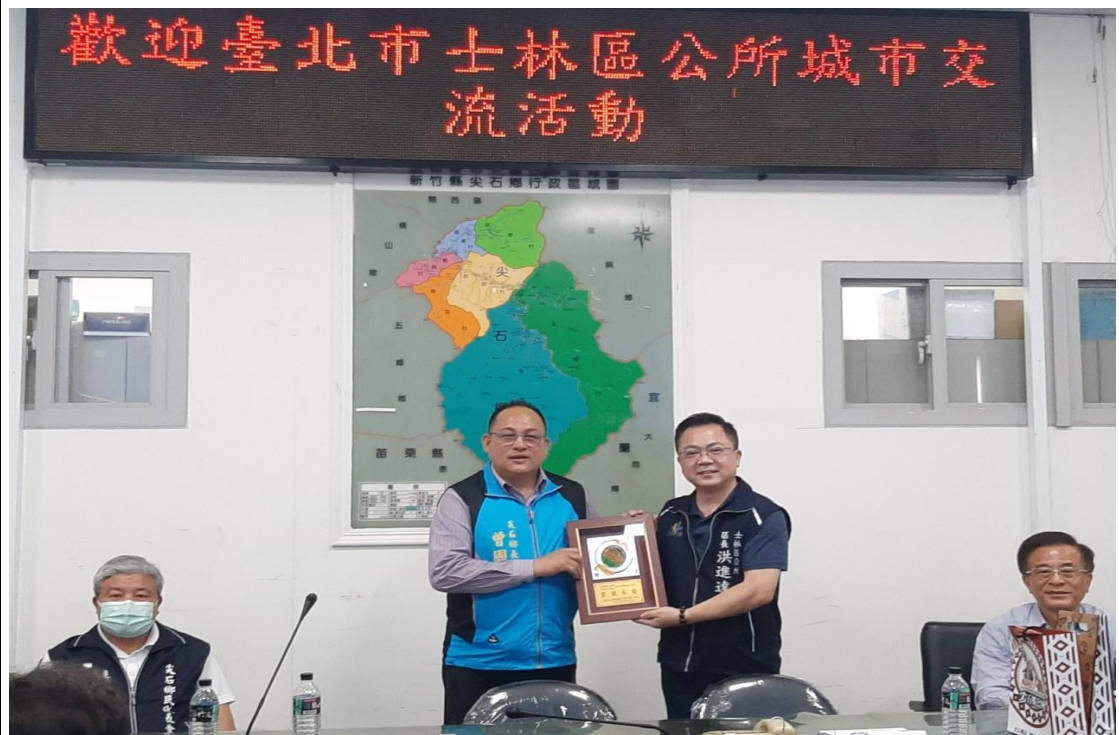
說明： 洪進達區長致贈紀念牌，開啟雙方友好的交流 地點： 尖石鄉公所 日期： 112.3.23