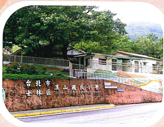
台北市溪山國民小學 士林區