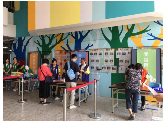
說明：陽明山國小成立緊急安置所。