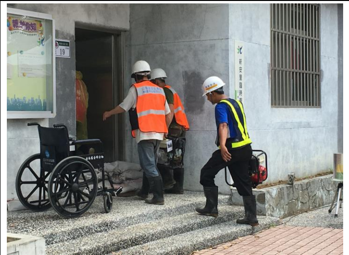
說明：開口合約廠商會同里長協助住戶抽水。