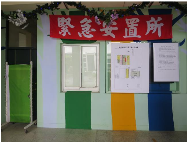
說明：陽明山國小成立緊急安置所。