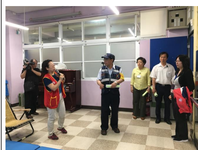
說明：由陽明山國小校長進行環境介紹。