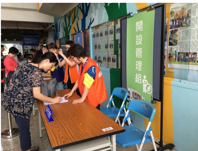
說明：陽明山國小成立緊急安置所之災民身分區分。