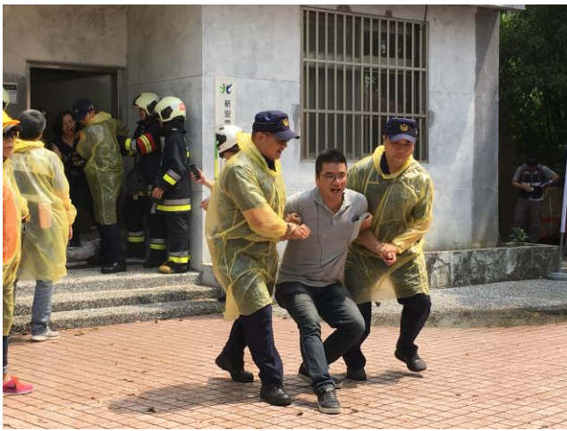
說明：執行保全住戶強制撤離作業。