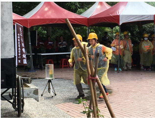
說明：里上的防災士協助受災戶堆放沙包。