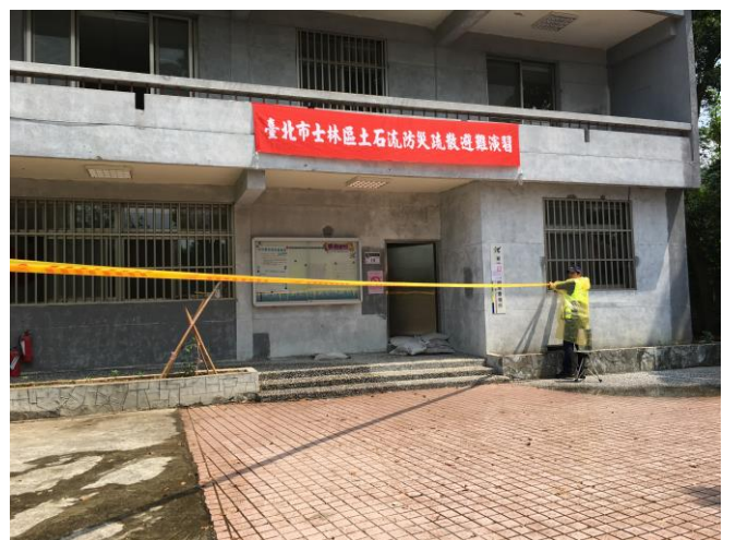
說明：員警於現場拉警戒線警戒，同時於管制範圍張貼危險地區公告，執行人車出入管制。