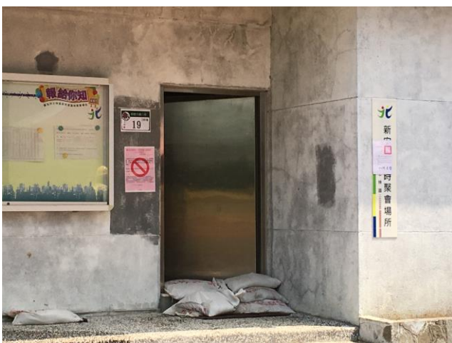
說明：員警於現場拉警戒線警戒，同時於管制範圍張貼危險地區公告，執行人車出入管制。