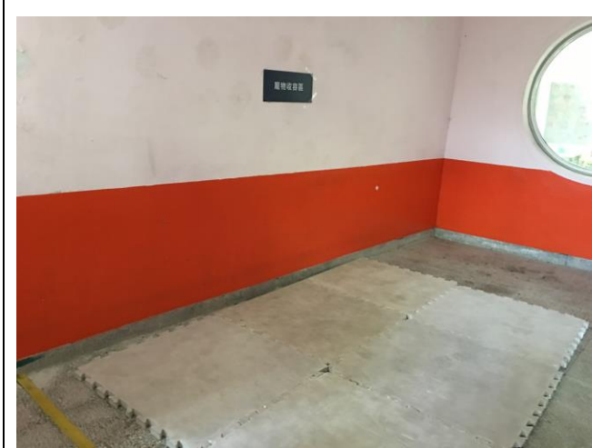
說明：動物收容安置區。