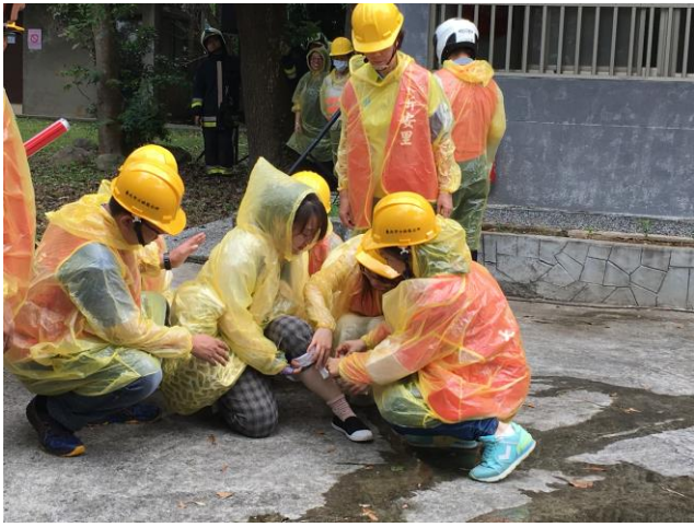
說明：協助受傷住戶撤離。