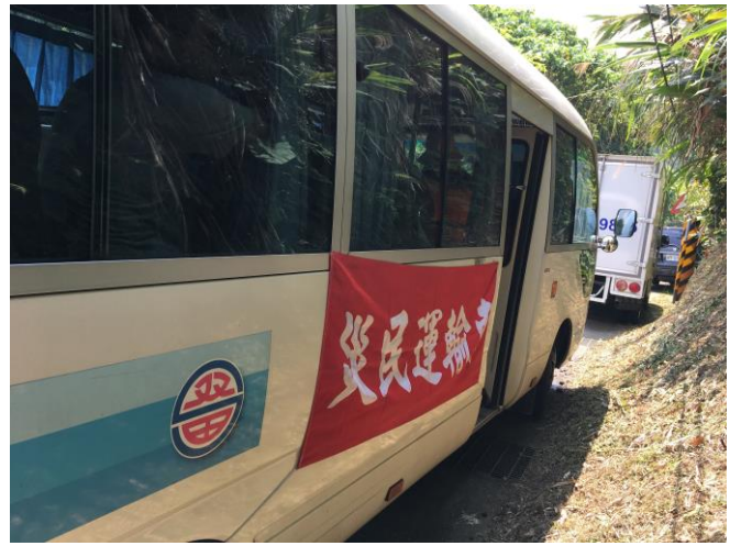
說明：治安交通組安排車輛載運已疏散至緊急避難集結點等候的災民。