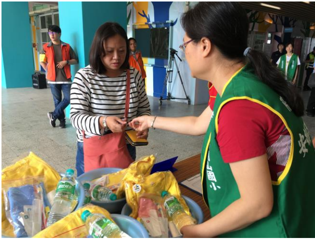
說明：緊急安置所提供災民生活物資。