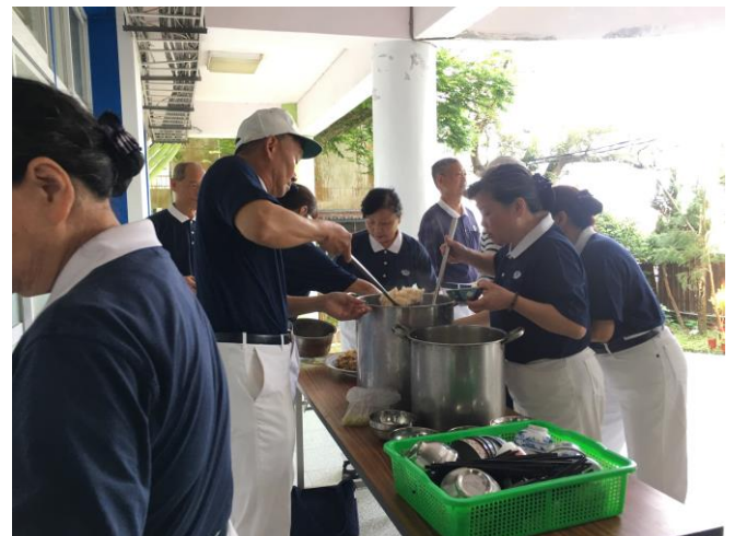
說明：運用慈善團體於緊急安置所協助提供熱食。