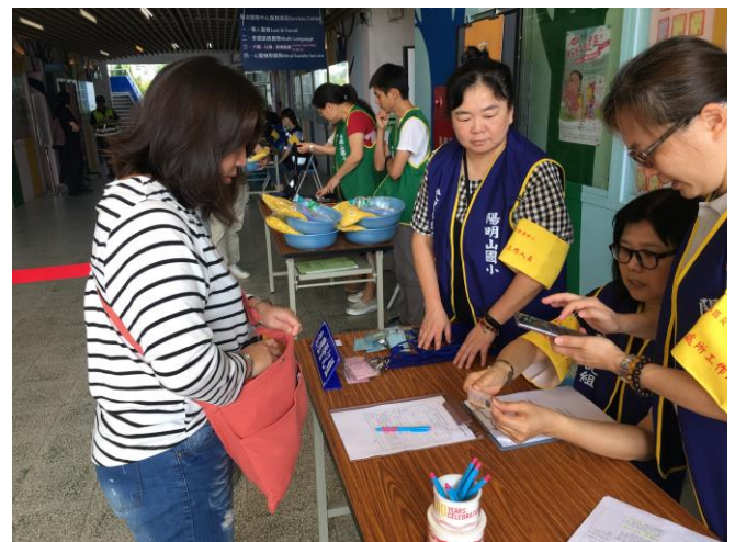
說明：陽明山國小成立緊急安置所之災民身分區分。