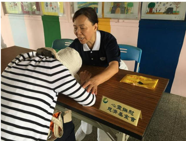
說明：運用慈善團體於緊急安置所安撫災民情緒。