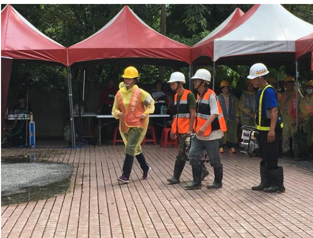
說明：開口合約廠商會同里長協助住戶抽水。