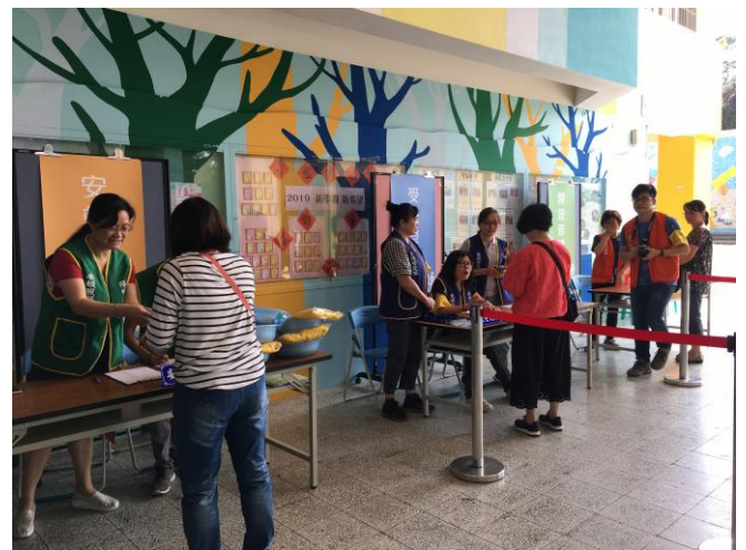
說明：災民於緊急安置所進行登記。