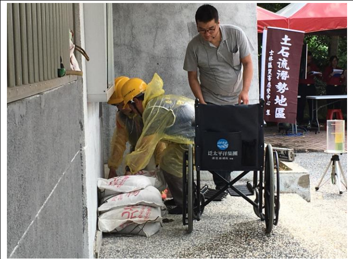
說明：里上的防災士協助受災戶堆放沙包。