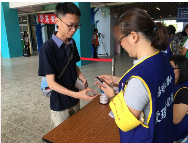
說明：災民於緊急安置所進行登記。