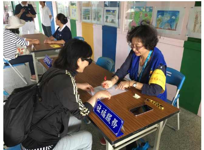
說明：聯合服務中心提供多項服務。