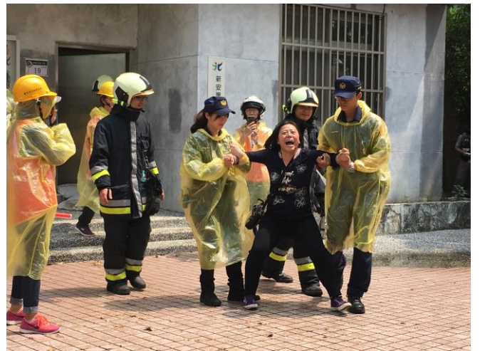
說明：執行保全住戶強制撤離作業。