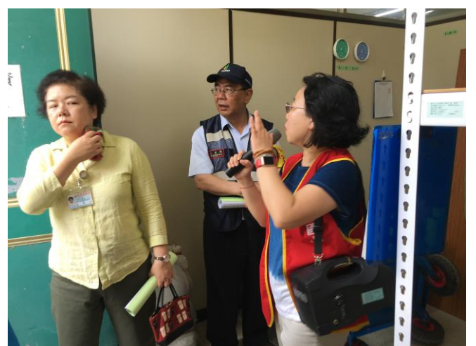
說明：由陽明山國小校長進行環境介紹。