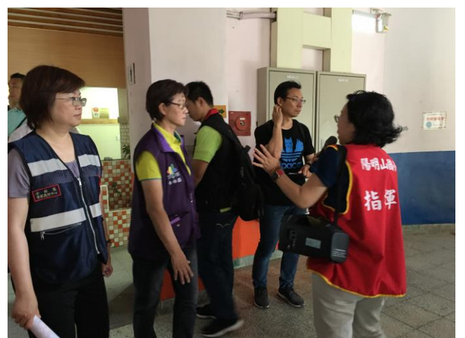
說明：由陽明山國小校長進行環境介紹。