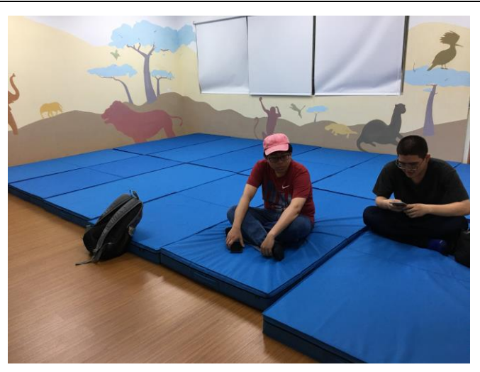
說明：災民於安置處所休息情形。