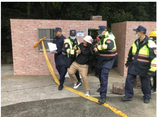
說明：執行保全住戶強制撤離作業。