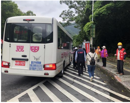
說明：引導住戶至指定地點搭乘安置專車。