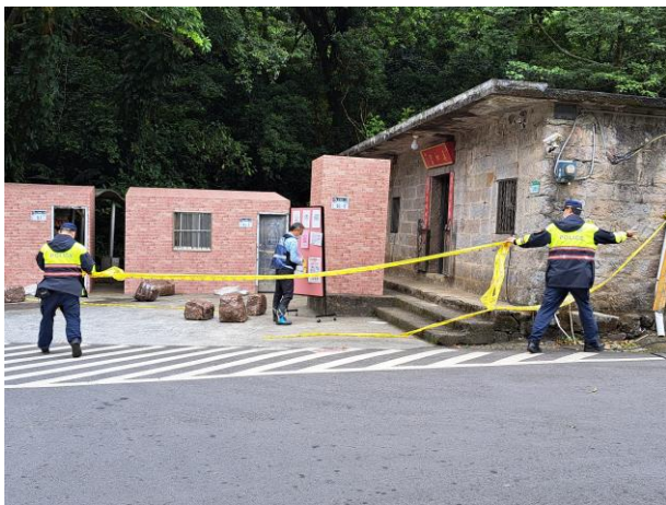
說明：員警於現場重新拉警戒線警戒。