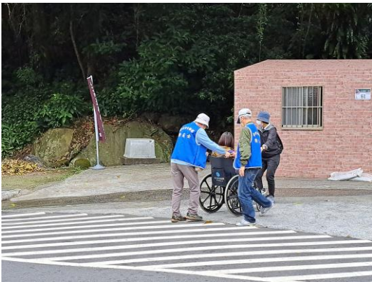
說明：防災士協助行動不便之保全住戶撤離。