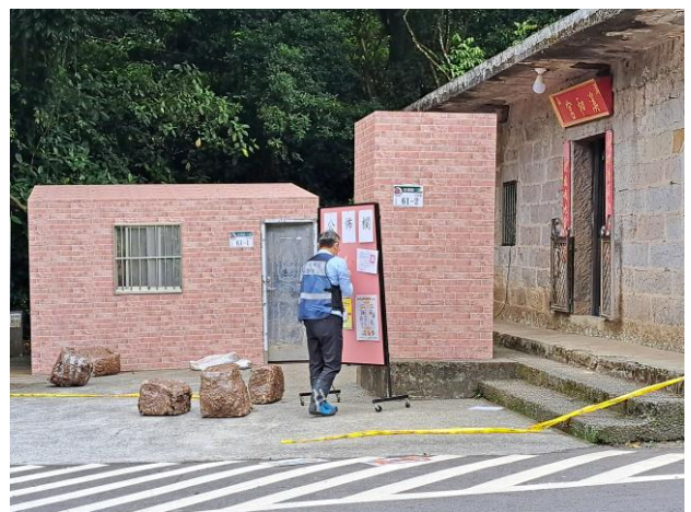
說明：於管制範圍張貼危險地區公告，執行人車出入管制。