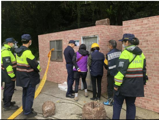
說明：警察局人員與里長、里幹事於門外再次勸導保全住戶進行撤離。