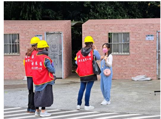
說明：協助新移民之保全住戶撤離。