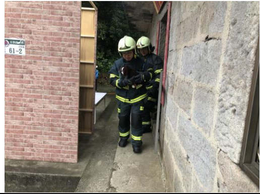
說明：協助撤離住戶寵物帶出。