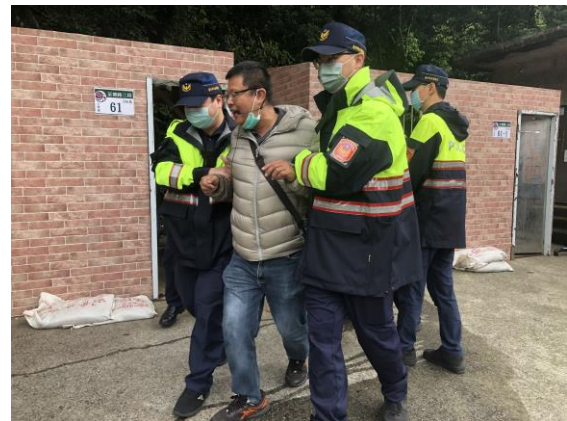
說明：執行保全住戶強制撤離作業。