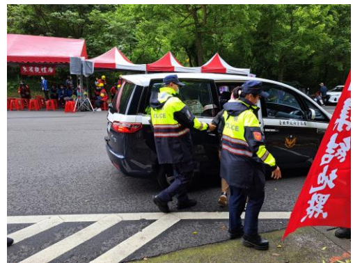
說明：將保全住戶強制帶上警車撤離。