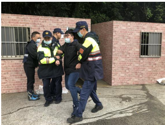
說明：執行保全住戶強制撤離作業。