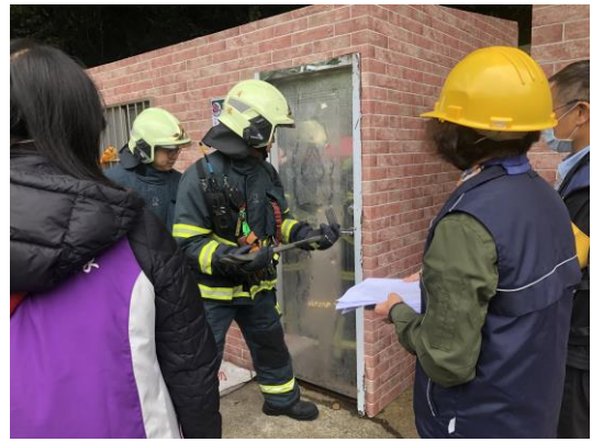
說明：消防局人員準備破門進入。