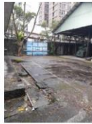
111年06月06~07日 台北機廠舊廠雀榕樹修剪作業

本廠已於年度預算經費內，委外辦理每月一次之例行性清潔維護作業，並於施工當天上午致電信義區新仁里里長及清潔隊說明辦理情形，查6月份清潔維護暨雀榕樹修剪作業已於111年6月6~8日完成(如附件)，過程中並有清潔大隊同仁蒞臨指導。