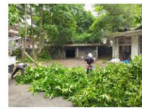
111年06月08日 台北機廠舊廠環境園藝整理維護