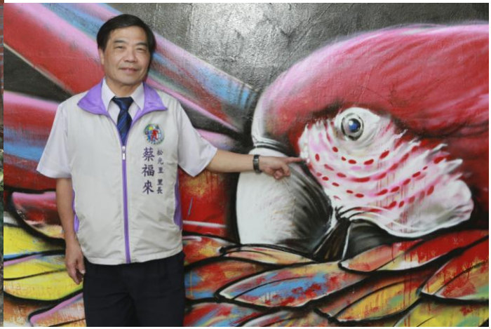
說明：前金區公所旁綠地，利用漂流木與彩繪藝術裝點得美輪美奐