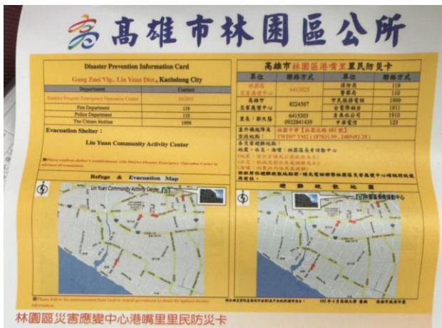
林園區災害應變中心港嘴里里民防災卡