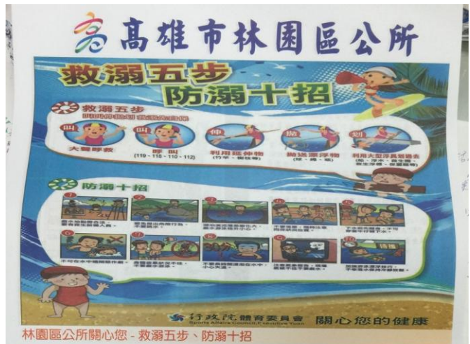
林園區公所關心您 - 救溺五步、防溺十招