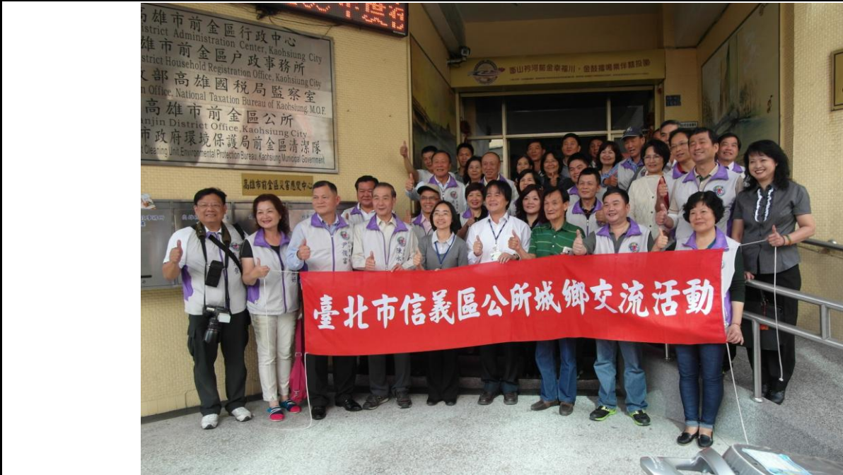
說明：雙方於前金區公所大門口合影