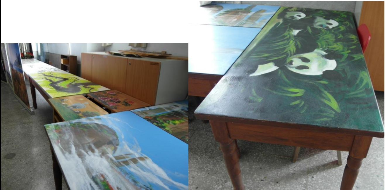
說明：前金區彩繪桌椅成果豐碩